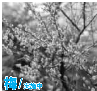
梅 / 実施中