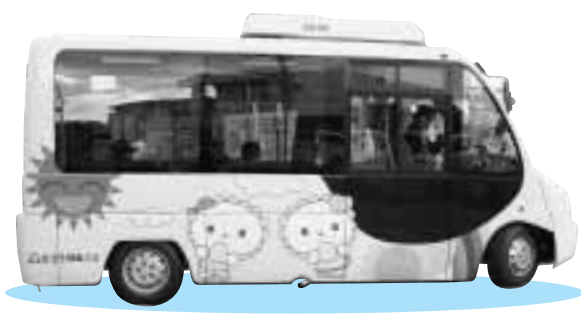
黄色い車体にかわいいイラストが描かれたバスが、西部循環赤コースを走ります

問い合わせ 都市計画課 ☎五五二二九〇四 ☎五三二二七七三 富士急静岡バス株式会社 ☎七一一二四九五