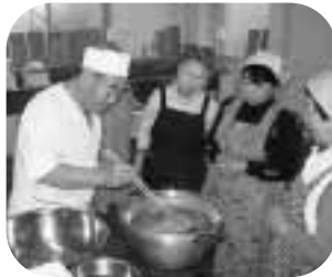
講師から、おいしいそばのゆで方を教わりました