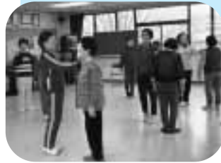
バランス感覚を養う体操 (東公民館「高齢者健康体操」にて)