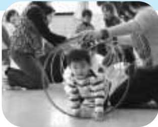
お母さんと一緒に親子体操（広見公民館「いきいき子育て講座」にて）

鷹岡公民館 ☎71-3215 広見公民館 ☎21-3444 大淵公民館 ☎35-0002 丘公民館 ☎71-3961 天間公民館 ☎71-4007