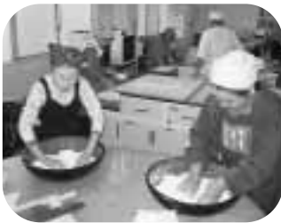
そば粉をこねる手に力が入ります

伝法公民館では、「いきいき・雑学講座」の受講生が、講座の一環として、そば打ちに挑戦しました。そば粉をこねるのに四苦八苦しなながらも、できあがったそばには皆、感動しました。