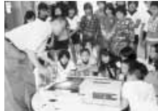
小学校での環境学習会

事業所環境マネジメントの推進や構築のためのセミナーを開催 セミナー参加者数：八十人