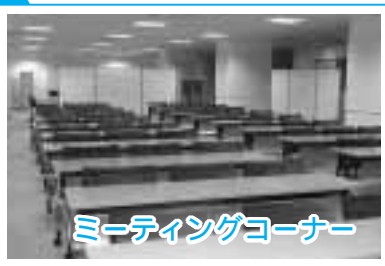
ミーティングコーナー

センターは、自由にご利用いただけますが、ミーティングコーナーやメールボックスなどは、事前に申請が必要となります。