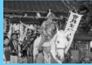
曾我まつり (五月二十八日)