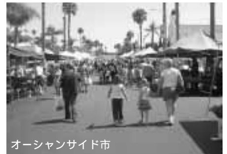
オーシャンサイド市

申し込み 5月30日~6月10日(土 ・日除く)に申込用紙(市内中学 校・高校または国際交流室で配布) に所属学校長の確認印を得て、直 接国際交流室へ