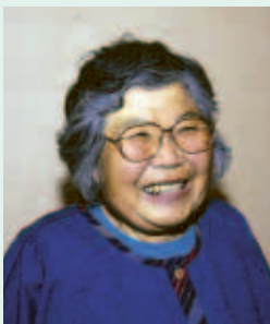
小学校で調理員として働いていた

いつも「給食のおばちゃん」と慕ってくれた子どもたちのことは、今でも忘れません。一緒に行った遠足やバス旅行など、楽しい思い出がたくさんあります。給食を食べた子どもたちの成長した姿を見ることが、一番の喜びでした。