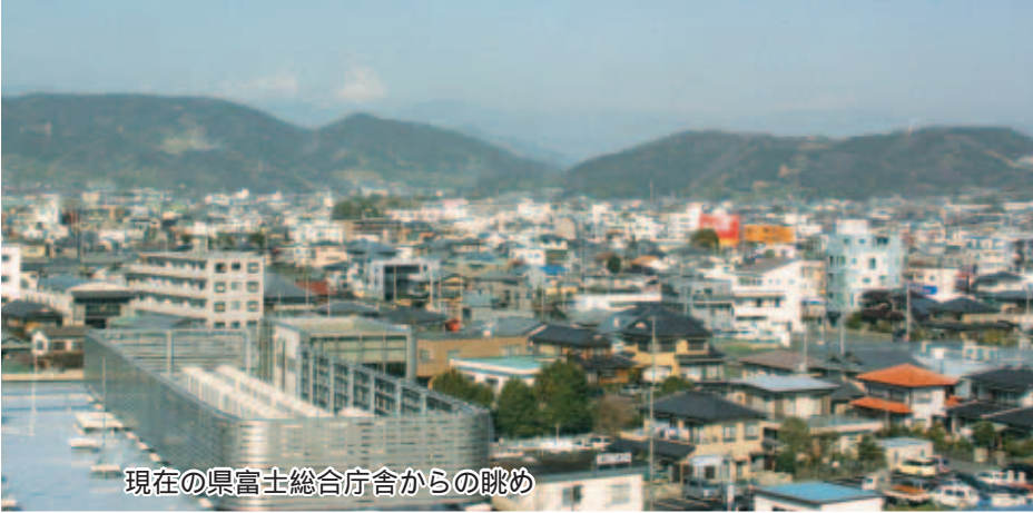
現在の県富士総合庁舎からの眺め