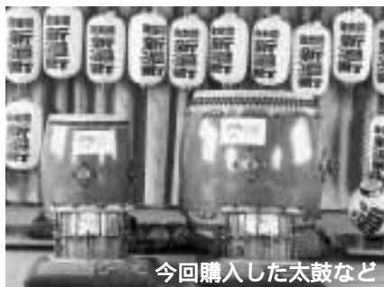
今回購入した太鼓など

青少年の健全育成と町内の活性化を図るため、新迫町町内会が、平成16年度宝くじ助成を受け、太鼓などを購入しました。今後ますます活動が盛んになることが期待されます。