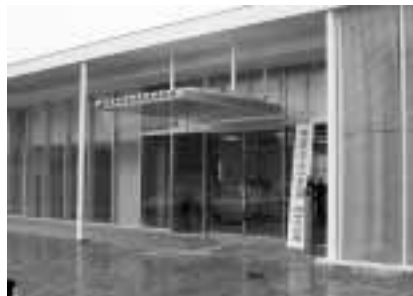
ふじやま・くすの木学園