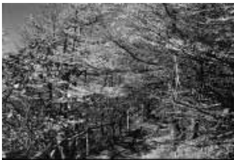
富士山五合目宝永遊歩道