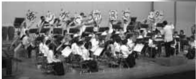
富士交響吹奏楽団による「ポップスコンサート」。(2月14日)