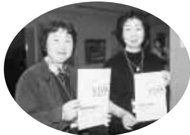
愛着のある市民センターのために集まった閉館記念事業実行委員会のスタッフやボランティアの皆さんが、イベントの運営を支えました。