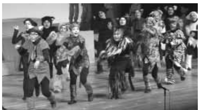
富士市少年少女合唱団が、「グランドフィナーレ特別コンサート」として、子どもミュージカル「11ぴきのネコ」を上演。閉館への思いを込めた団員の熱演・熱唱に、超満員の客席からは大きな拍手が寄せられました。(3月21日)

「ファイナルフェスティバル」では、あいにくの雨にもかかわらず、センターの内外で、各団体の熱演が繰り広げられました。(二月二十二日)