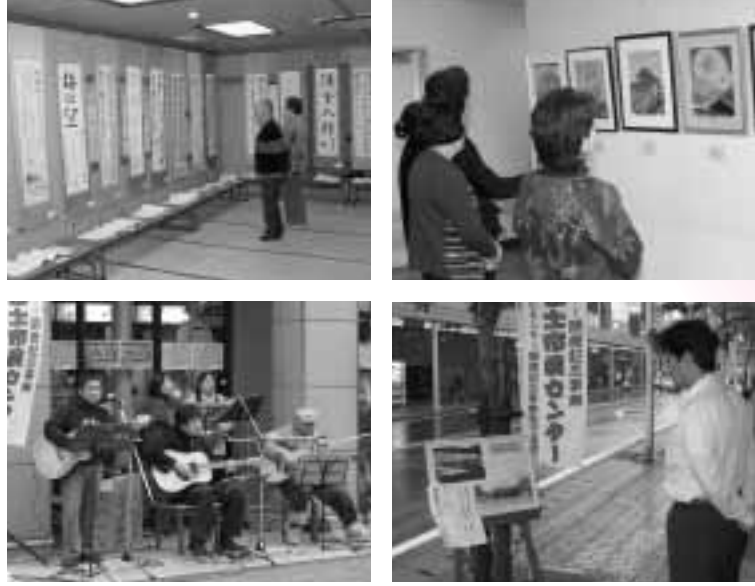
市民センター周辺では、アコースティックライブ、今昔写真展などのまちづくりイベントも行われました。(2月10日~22日)

展示部門では、書道、富士の型染などさまざまな文化団体が作品の展示を行いました。(2月10日~22日)