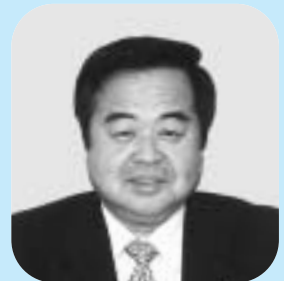
富士市水防管理者 鈴木 尚 富士市長