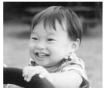
松 とうま 井 ま 刀 た 麻 ま ちゃん H14.10.9 生 父・俊之 母・潔保(広見町7) 「だれに会ってもパパにそっ くりと言われるボク。寝相 までパパ似らしいよ!」