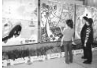
秋季大会の展示風景