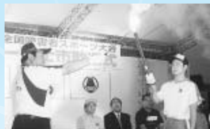
大会旗及び炬火リレー-富士市歓迎式