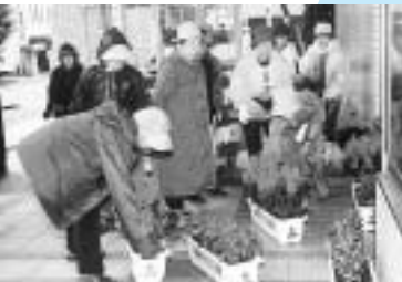
花の会の皆さんによるプ ランターの会場への搬入

一般公募の「花の大使」をはじめ、花の会、緑化 指導員、市内小中学生、協賛事業者の皆さんの協 力により、競技会場や練習会場周辺などに、花の プランターが飾られました。