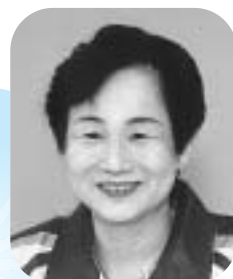
スポーツ芸術・式典専門委員会