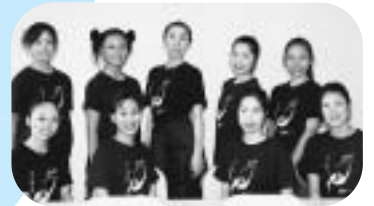
夏季大会式典前演技者 服部バレエスクールの皆さん

大きな舞台で踊れて幸せ たくさんのダンサーの中で自分の個性が出せるようにいろいろ考えて演じました。本番までは長い道のりでしたが、とても楽しく踊れました。国体というこんなに大きな舞台で踊ることができて幸せでした。