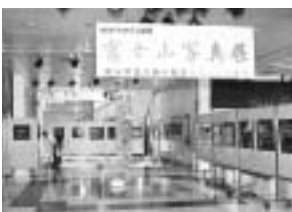
ステーションプラザ FUJIでの展示風景

開催期間中、展示写真の縮小版を五百枚用意しましたが、九州から来られた人が四十枚もおみやげに買ってくれるなどして、ほぼ完売しました。大盛況でもうれしかったですね。写真をもらいになった皆さんに富士山を愛していただきたいと思えます。