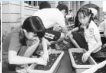
小学生の皆さんによる種子 から育てた苗の植えつけ