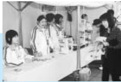
チームふじっぴーの皆さんによるスタンプラリーの受付(左)とのぼり旗の設置