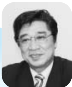
競技・施設専門委員会

これまでの啓発活動が実った大会。平成十一年から開催に向けて、一人でも多くの市民の皆さんに国体の参加者になっていただくこと、さまざまなPRイベントを行ってきました。大会では、会場に訪れるほどの人が訪れるとともに、「ふじ3運動」でも、多くの皆さんに積極的に参加していただき、これまで続けてきた活動の成果があったと大変うれしく思います。