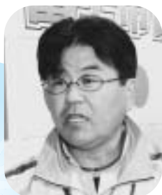
大会旗及び炬火リレー専門委員会

スポーツと芸術の共通の感動を発信。富士市のスポーツ芸術は、スポーツの持つ美しさを縦系に、富士市に伝わる文化・歴史を横系にして、スポーツと芸術の共通の感動を発信できたかと思っております。感動を発信できたかと思っております。それぞれの発表は多くの皆さんの協力ですばらしいものに仕上がっていました。今後もこのエネルギーを富士市の文化の発展につなげてほしいと思います。