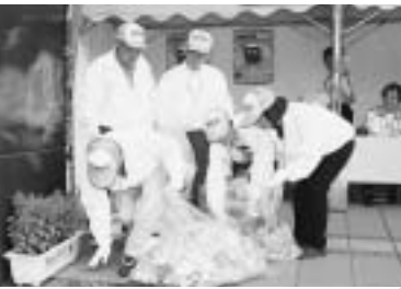
ゴミバスターズ2(ツアー)の皆さんによる環境美化活動