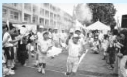
秋季大会中央リレー

違った形で再び国体へ参加 大学時代、国体に陸上で出場したことがあります。今は競技をやめてしまいましたが、静岡で国体をやるといふことで、違った形で自分が参加できたらいいなと思い、リレー走者に応募しました。本番は、練習のときよりスピードが速くてびっくりしましたが、沿道の皆さんが応援してくれて、とても楽しく走ることができました。