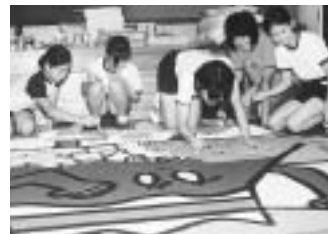
富士第一小学校の制作風景