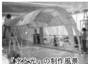
「水と光」の制作風景

富士山の湧水と自然から得た恵みを市民がどう活用しているかをイメージしてつくりました。湧水には紙バンドを使用しました。訪れる皆さんに競技を見るだけでなく、それに関する芸術を見ていただけるようなよい作品に仕上がりました。