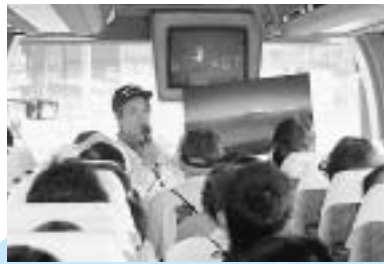
観光ボランティアガイドの皆さんによるシャトルバス内の観光案内