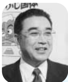
輸送・交通・警備・消防専門委員会

計画どおり運営できた輸送バス。選手・役員・観客の皆さんを安全かつ的確に輸送するため、一日に百台という車両の確保やシャトルバス、選手輸送バスの定時運行など、富士市独自の輸送体系をまとめました。また、警備、消防関係においても、万全な体制を整えました。その結果、計画どおりに運営でき、多くの皆さんに利用していただき感謝しています。