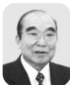
宿泊・医事・衛生専門委員会

食中毒がないよう万全を期して準備。直接選手の体に影響する宿泊・医事・衛生の担当ということで、気を使いましたね。まだ暑い時期の開催だったので、食中毒には一番注意しました。富士市から絶対食中毒を出さないという思いで、弁当も事前に試食してチェックしました。何事もなく終了したのも、万全を期して準備をしていたおかげだと思えます。