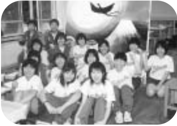
鷹岡中学校美術部の皆さん

図案を考えるのに一番時間がかかりました。月が出て空が明るいきれいな雰囲気が出るようにしました。月の光が当たっているところの赤から青に変わっていく富士山を見て、きれいだなと思ってもらえるように描きました。