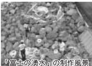
「富士の湧水」の制作風景