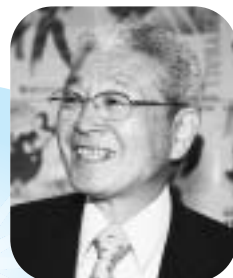
総務・企画専門委員会