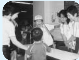
イベントでの受付

ふじ3運動は、私たちのシンボルである富士山をイメージ、三つの目標を展開する市民運動です。