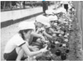
今泉小4年生が、田宿川沿いに花の苗を植えました(6月12日)