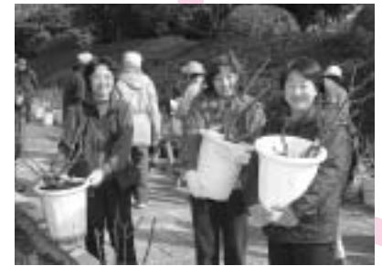
ようこそ!「かぐや富士」まつりの会場では、市民の皆さんが育てたバラの花が飾られます。

ようこそ!「かぐや富士」まつりで開催するイベントの日時や会場、ばらサミットについては、4月20日号の広報ひびで詳しく紹介します。