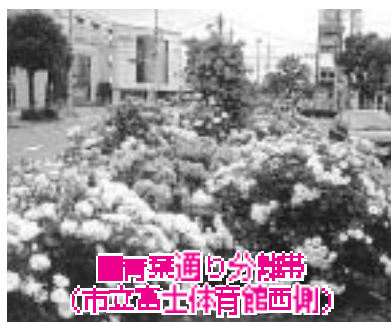
青森通り分岐帯 (市立富士体育館西側)

車で通り過ぎるのはもったいないほど、色とりどりの鮮やかな花が、目に飛び込んできます。