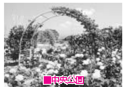
申安公園 ロゼシアター北側のバラ園。「富士市バラ会」の皆さんによって丁寧に手入れされています。