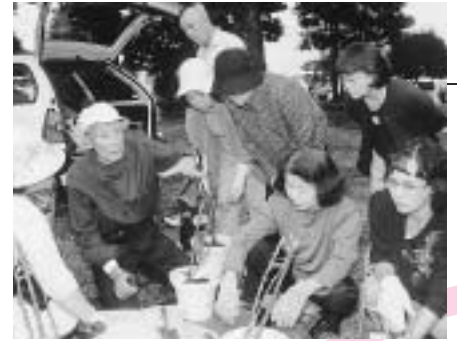
バラであふれるまちづくりを目指して、「バラスクール」を開催し、バラに関する歴史・文化、管理方法などを学んでいます。

五月二十二日~二十五日には、「かぐや富士」まつりという趣向イベントが盛り込まれます。バラの作品展、押し花展、切り花やハンギング・コンテナバスケットコンテストのほか、市内外のさまざまな団体が登場する「あつぱれ富士」などが開催されます。