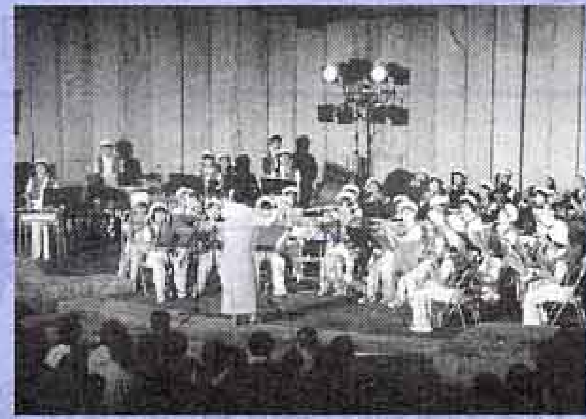
星空のコンサート (十月五日)