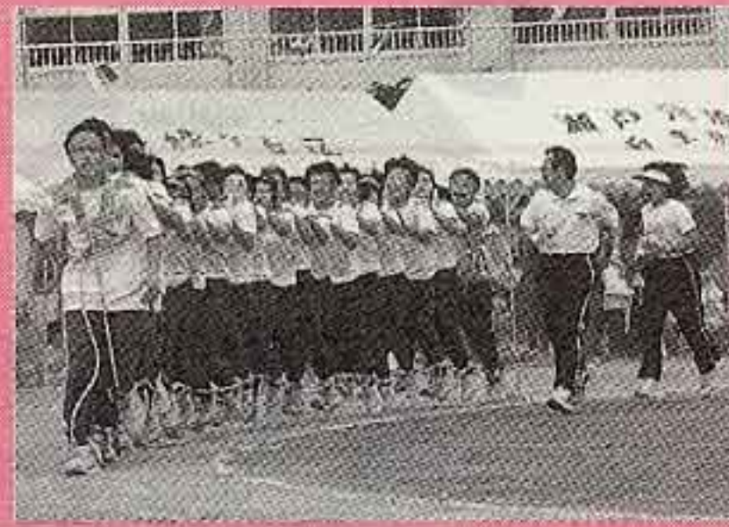
岩松中学校運動会 (九月二十一日)