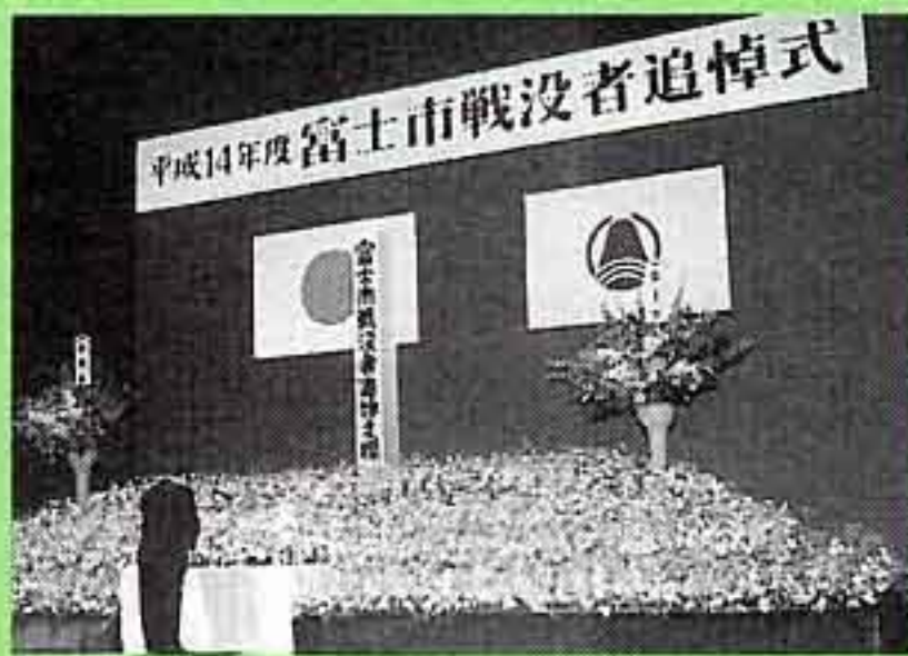
富士市戦没者追悼式 (八月十五日)