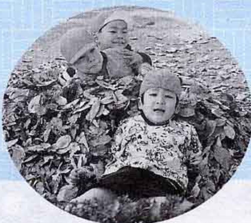
「落ち葉の布団はふかふかだよ」