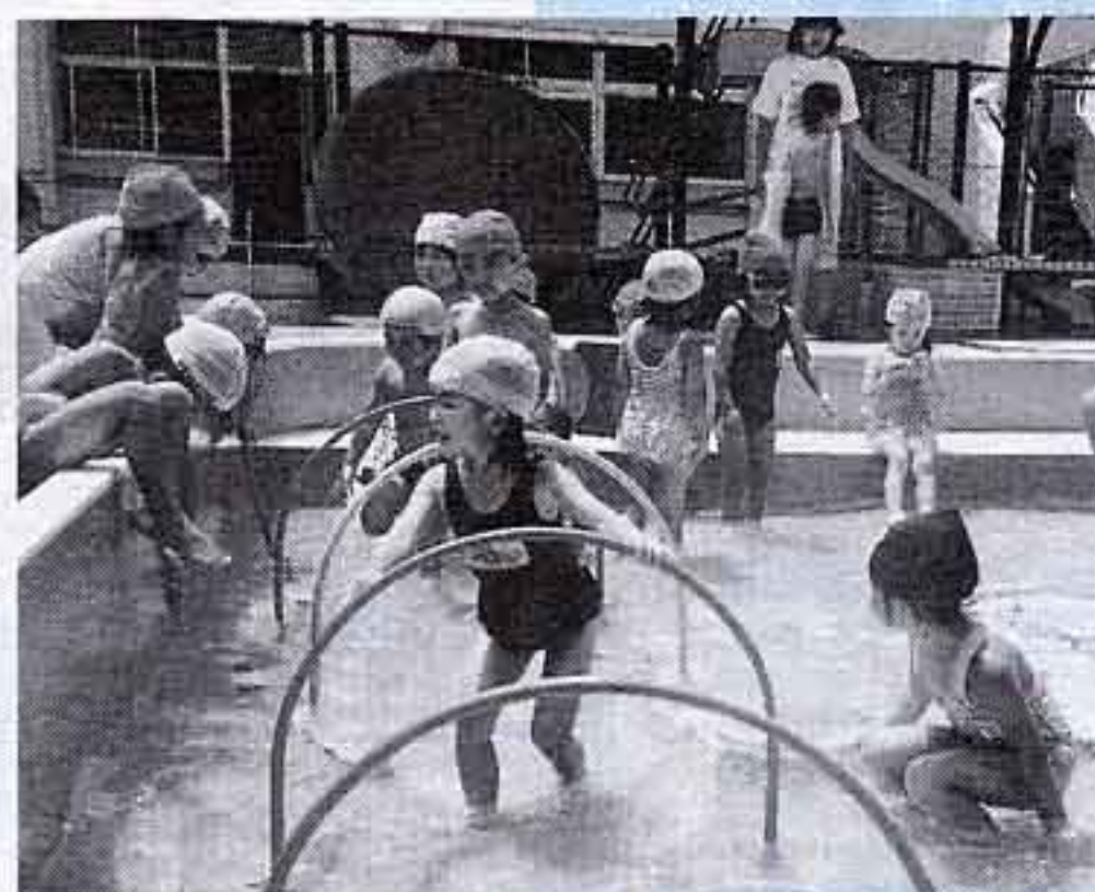
「プールの水遊び。『気持ちいい』」

市内には、公立、私立を合わせて25の幼稚園があり、3歳児から小学校入学前の子どもたちが通園しています。