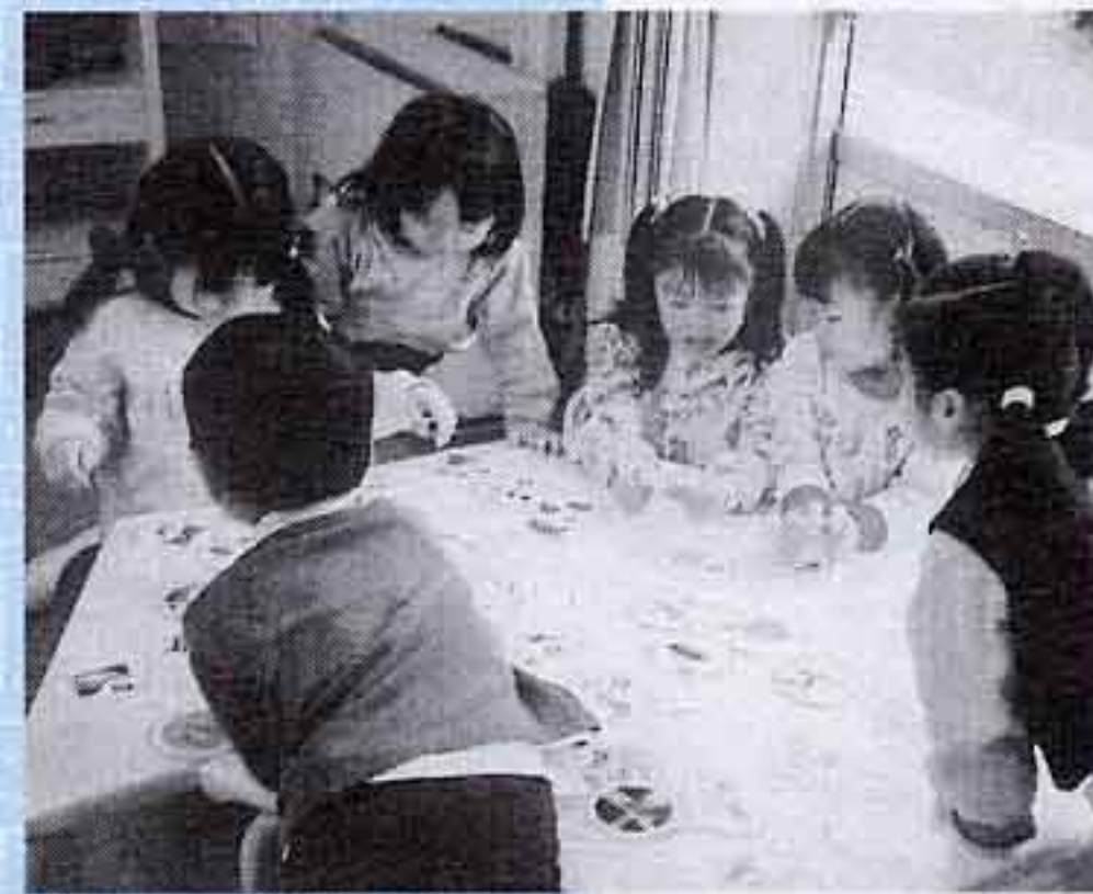
「みんなですごく遊ぶ。『今度は私の番ね』」

幼稚園は遊びを大切にした教育を行っています。子どもたちは遊びやさまざまな経験を通して、うまく人とかわかれるようになり、言葉が豊かになったり、自然の美しさや不思議さに気づいたりすることで将来の学習の基盤をつくっています。また、よいことや悪いことの区別、他人への思いやりや社会的ルールなど、心の教育を地域や家庭と協力して取り組んでいます。