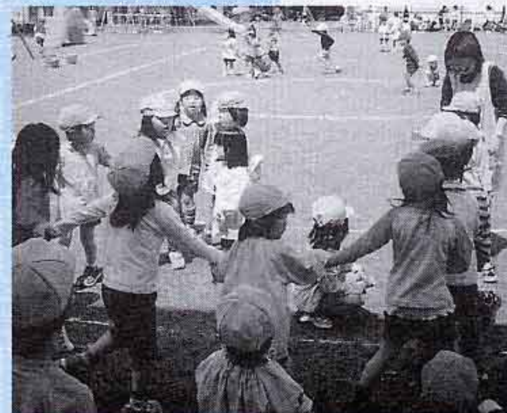
「みんな楽しんでかごめかごめ」