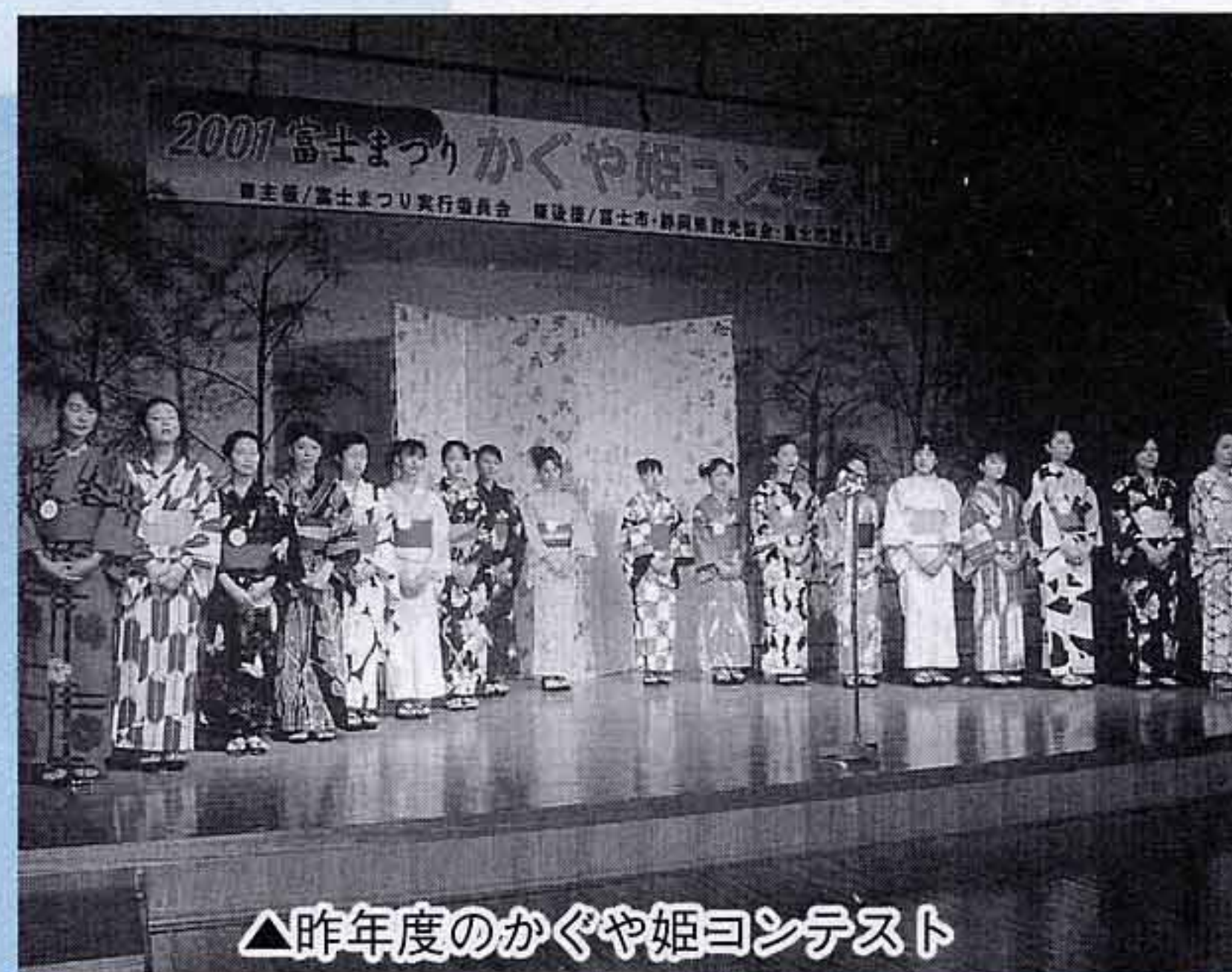
△昨年度のかぐや姫コンテスト