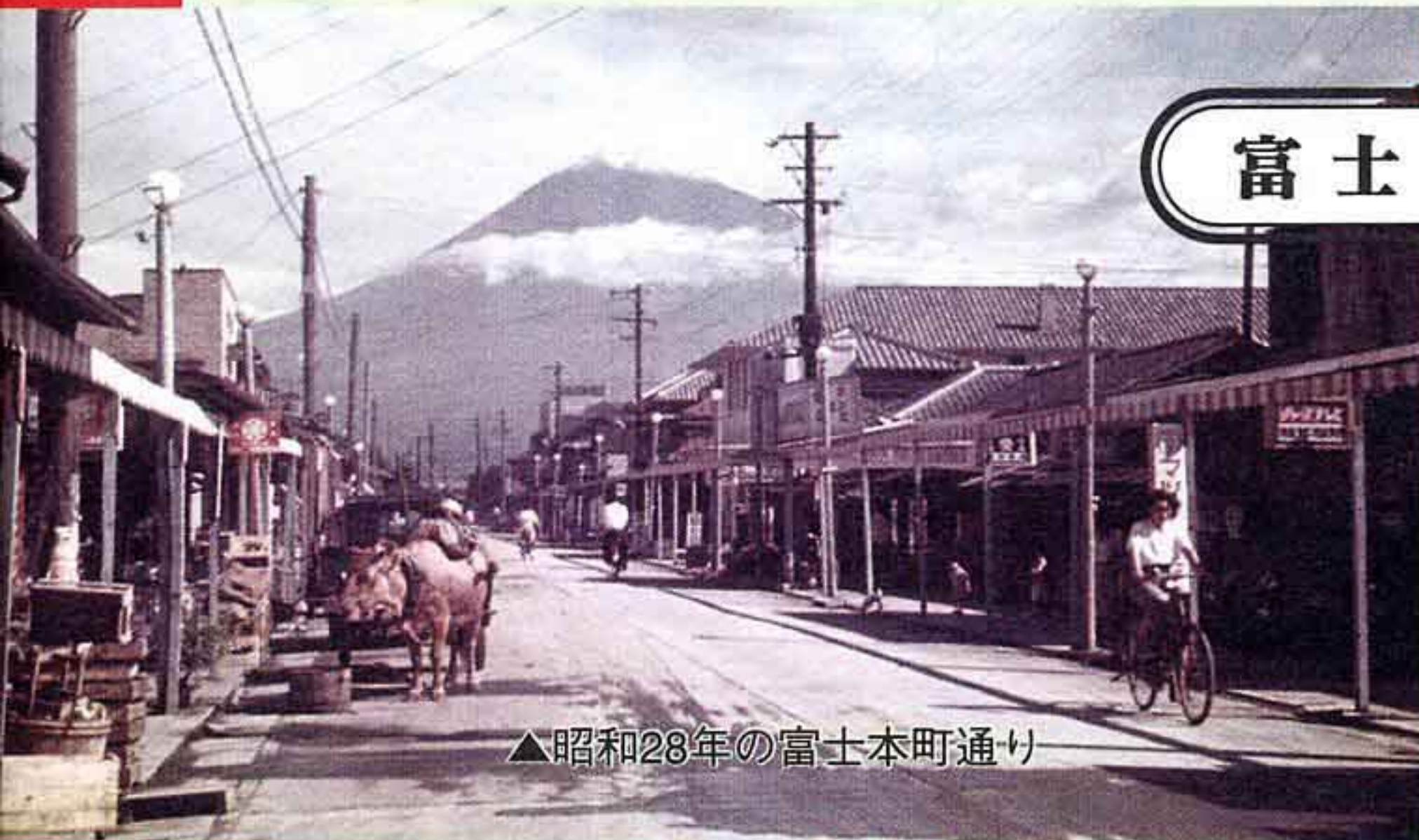
▲昭和28年の富士本町通り

昭和の初め、私の子どもころ、本町通りの周りはナシの畑や水田ばかりでした。夏になるとナシを運ぶ牛車や馬車が、朝五時ごろからゴトゴトと通りを行き交っていました。母が「ごはんだよー」と呼ぶまで、毎日友達と外で遊んでいました。私の家の裏には川が流れていていました。平垣八幡町あたりで梨を川に投げ入れ、プカプカと浮いているナシに沿って歩いてきて家の裏でナシを拾って食べると、ちょうど冷えていて、それはおいしかったですよ。物はない時代でしたが、川も道もきれいでごみ一つ落ちていませんでした。川に素足で入っても、けがをすることもありませんでした。