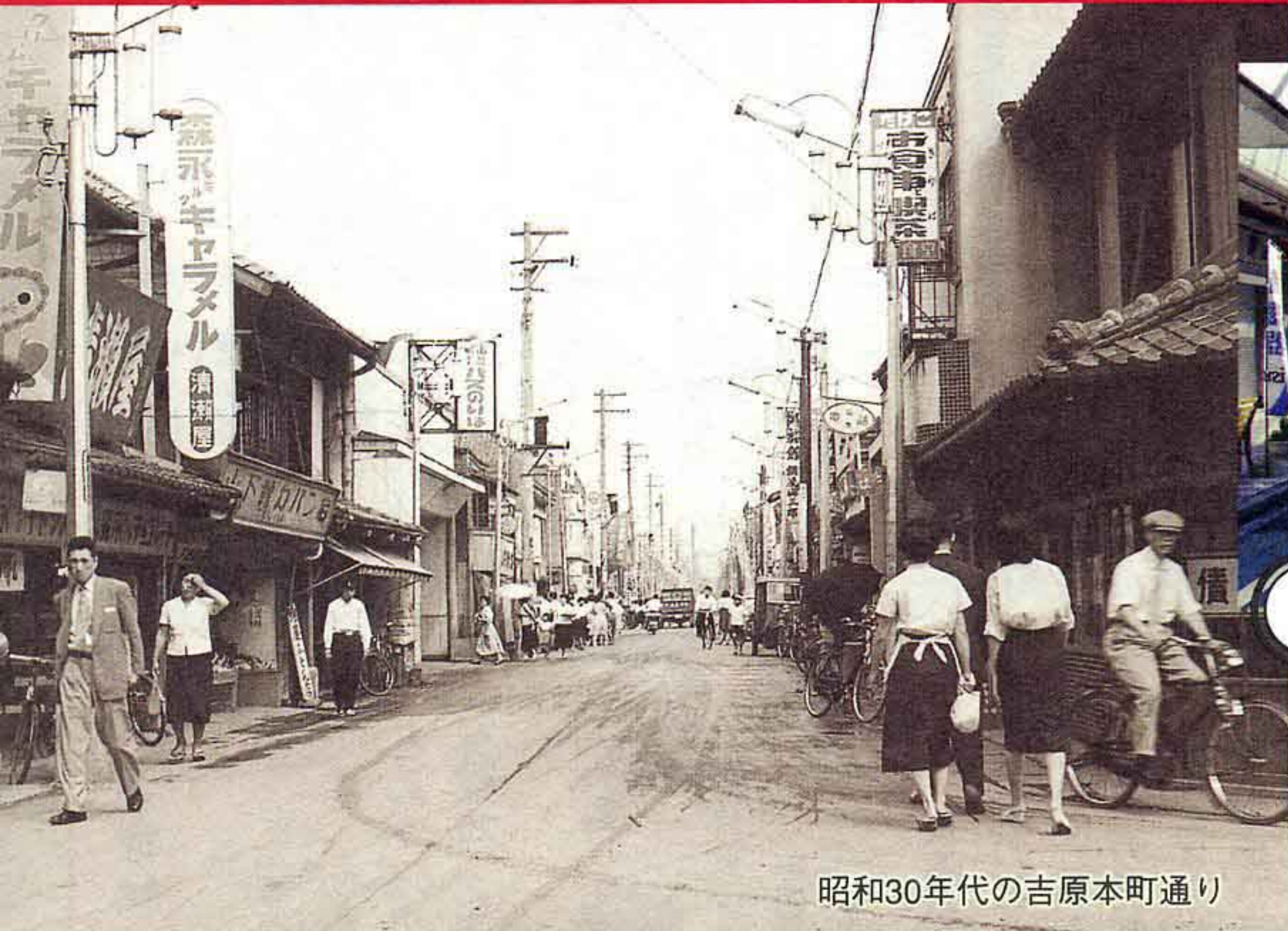
昭和30年代の吉原本町通り