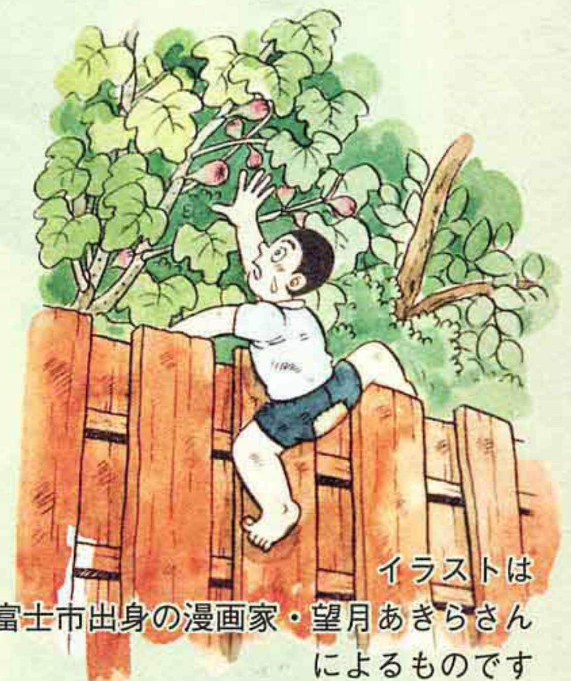
イラストは 富士市出身の漫画家・望月あきらさん によるものです