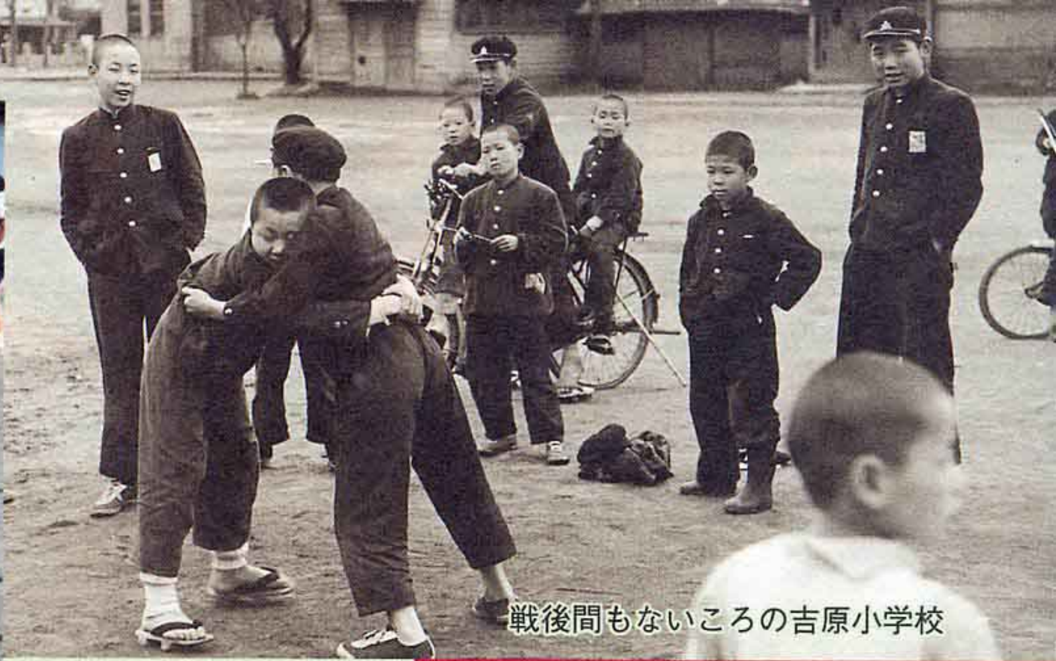
戦後間もないころの吉原小学校

東海道に宿駅制がしかれて、ことしで401年目。東海道の歴史に新しい1ページを加える年です。市立博物館では開館20周年を記念し、市民の皆さんから古い時代の写真を募集し、「20世紀 写真のなかの富士Ⅱ～東海道の町なみ～」展を開催します。その中から現在の写真とともに4点を紹介し、その場所にまつわるお話を伺いました。家族や友達と、懐かしいあそこ、あの場所を見つけてみませんか。