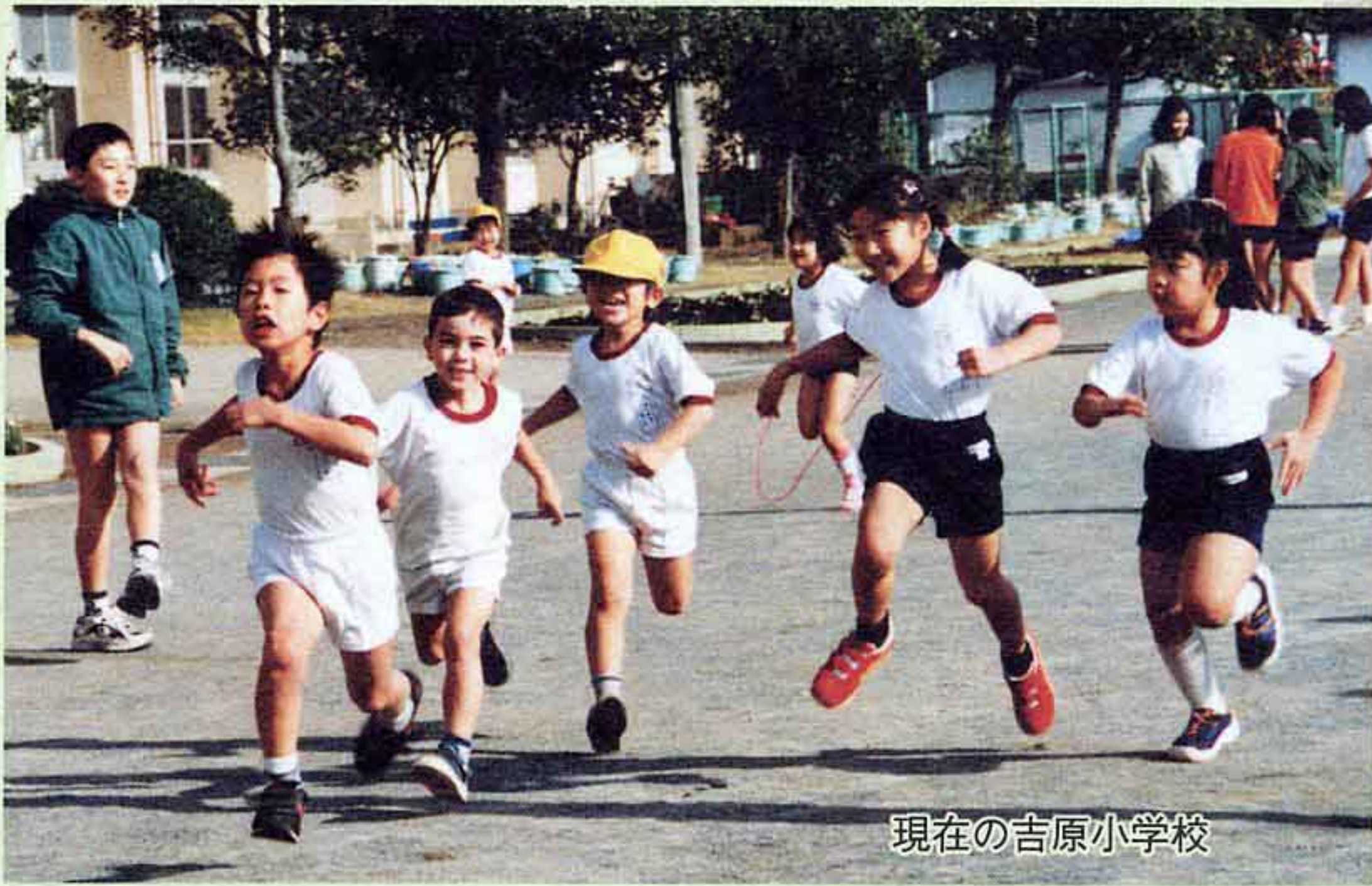
現在の吉原小学校