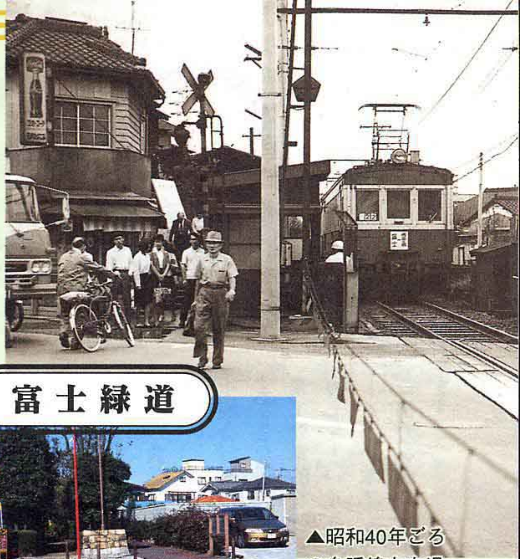
▲昭和40年ごろの身延線本市場停留所の踏切