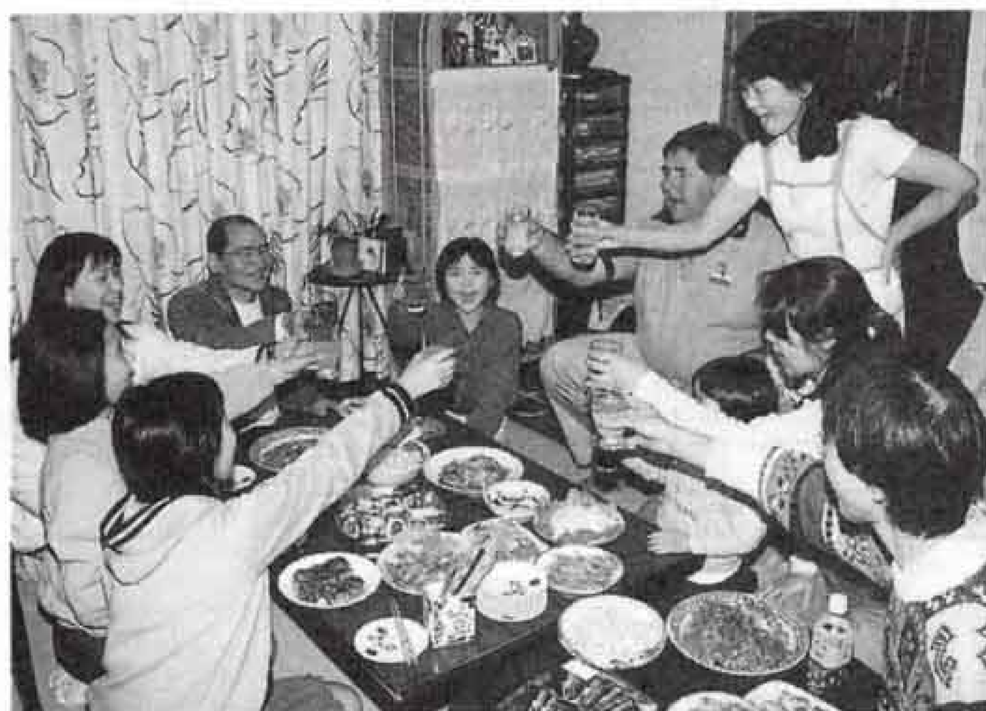
▲ ホームビジット先の家庭でふだん着の交流。夕食を前にみんなで「乾杯！」