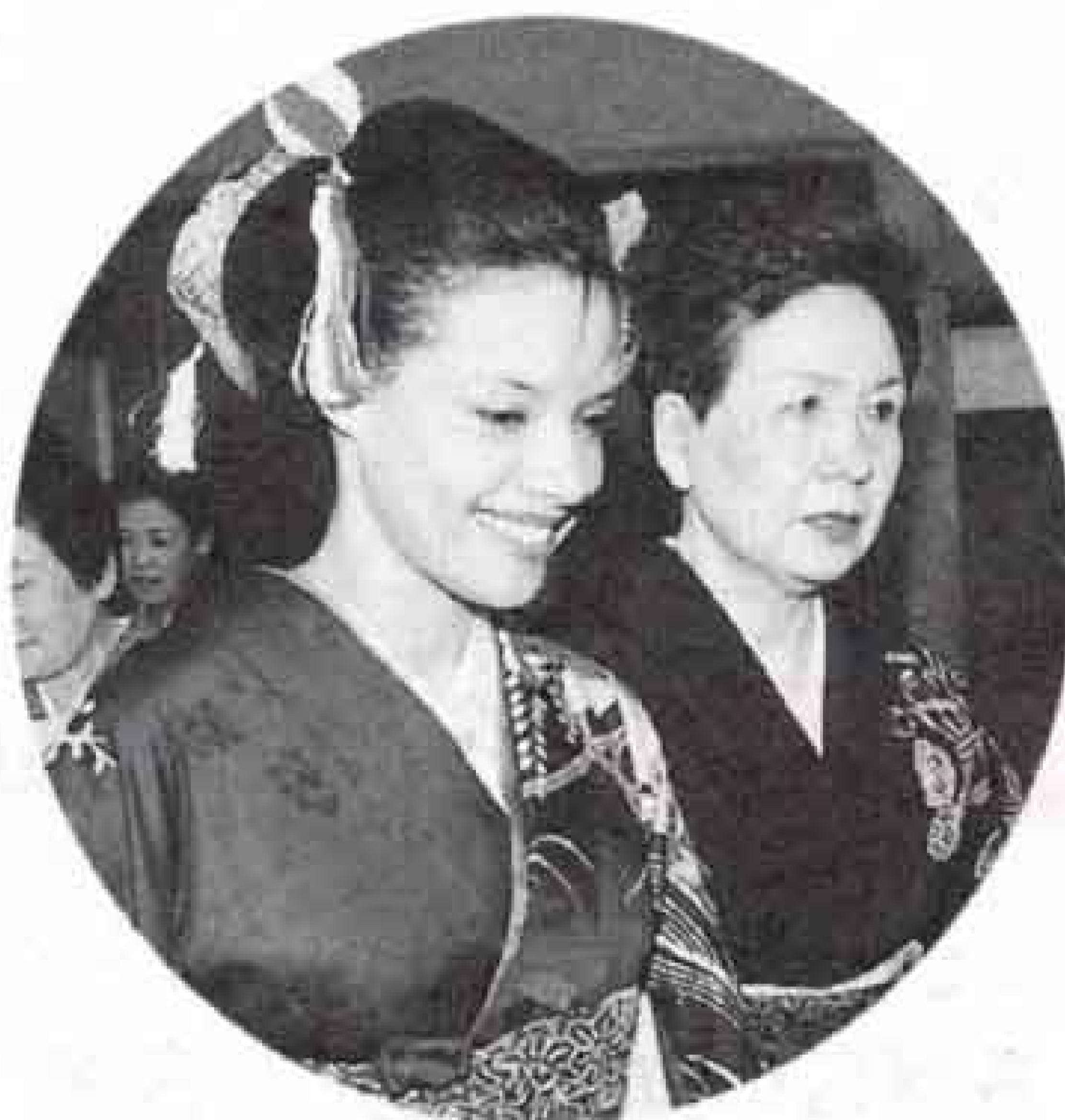
▼ 着物で日本文化を体験する機会も