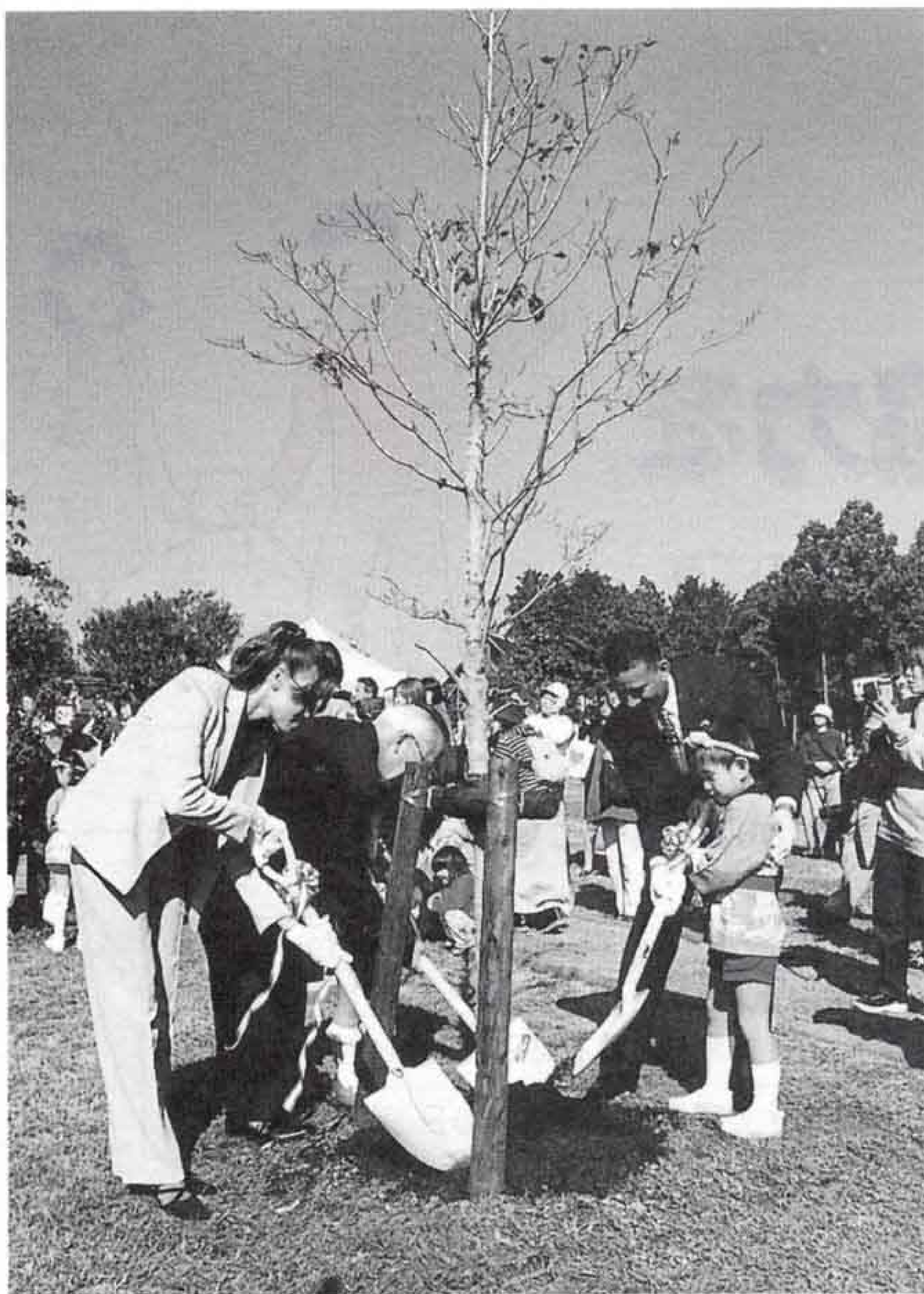
▲ 広見公園で行われた記念植樹。植樹した場所には、「オーシャンサイドの森」と刻んだ石碑を設置