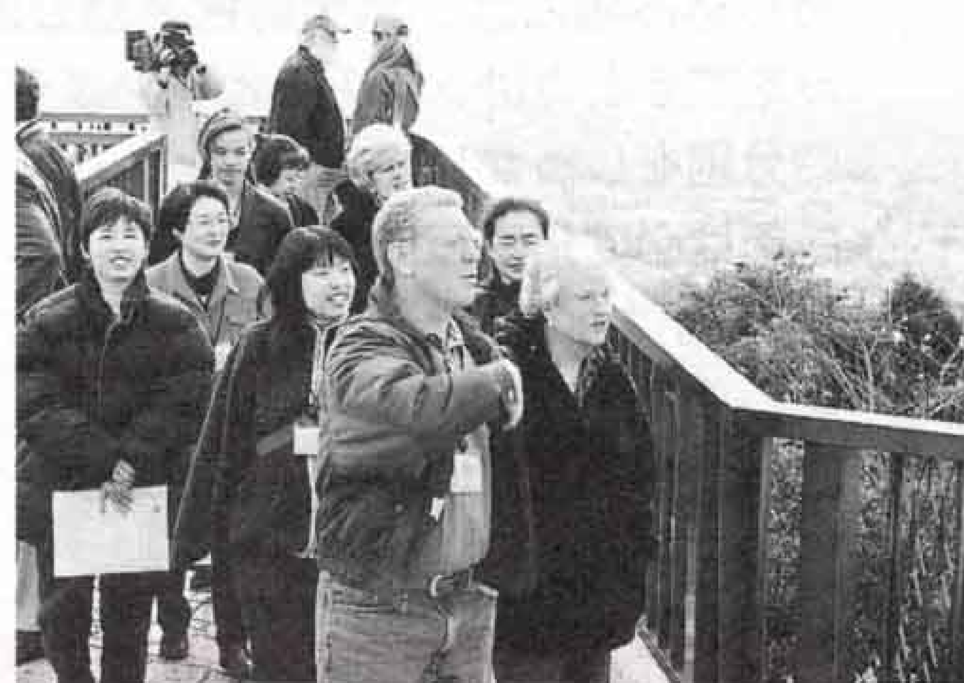
▲ ボランティアの案内で富士山周辺を観光。岩本山公園からの眺めに感激