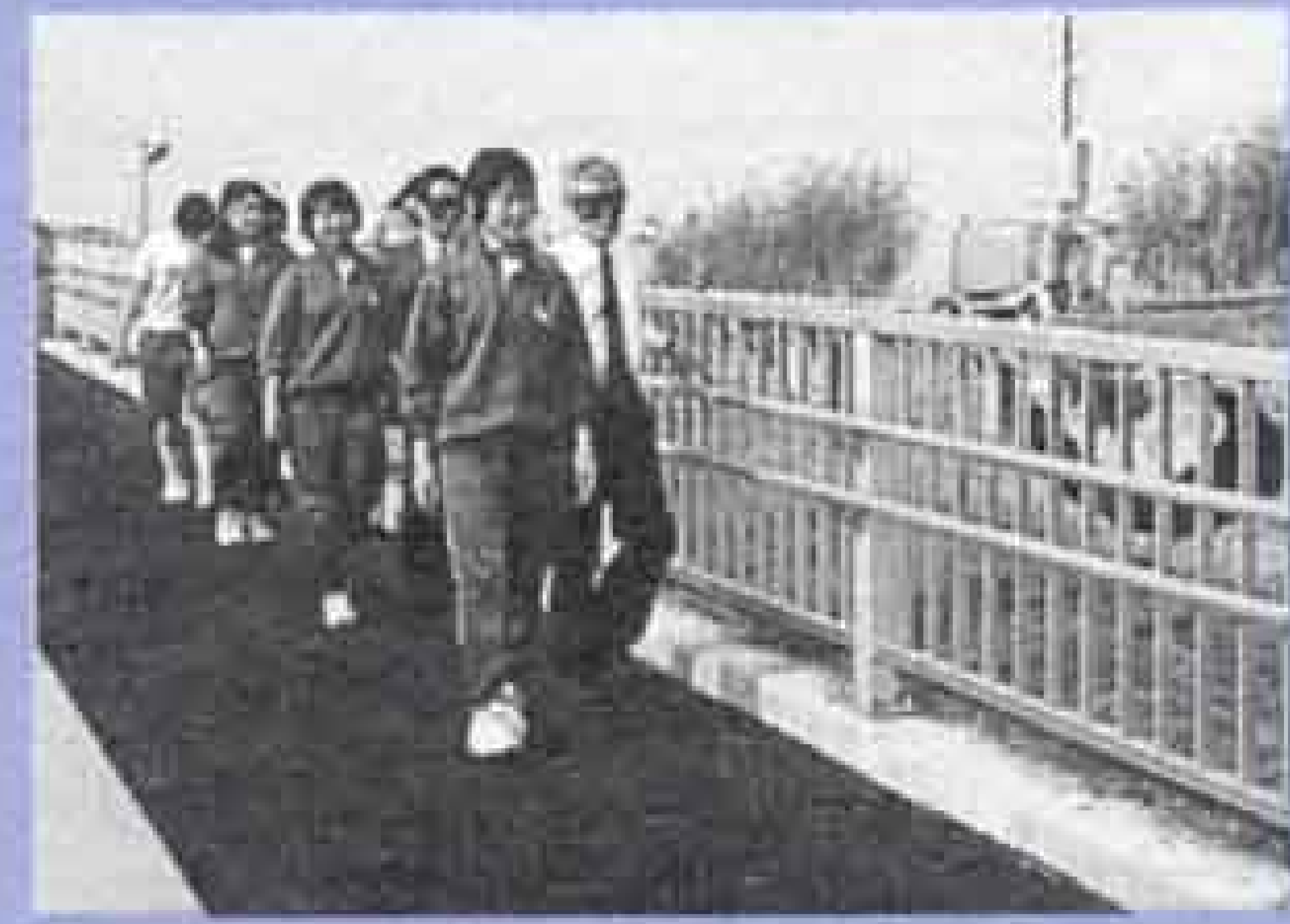
福祉の坂路完成 (雁堤) (十月六日)