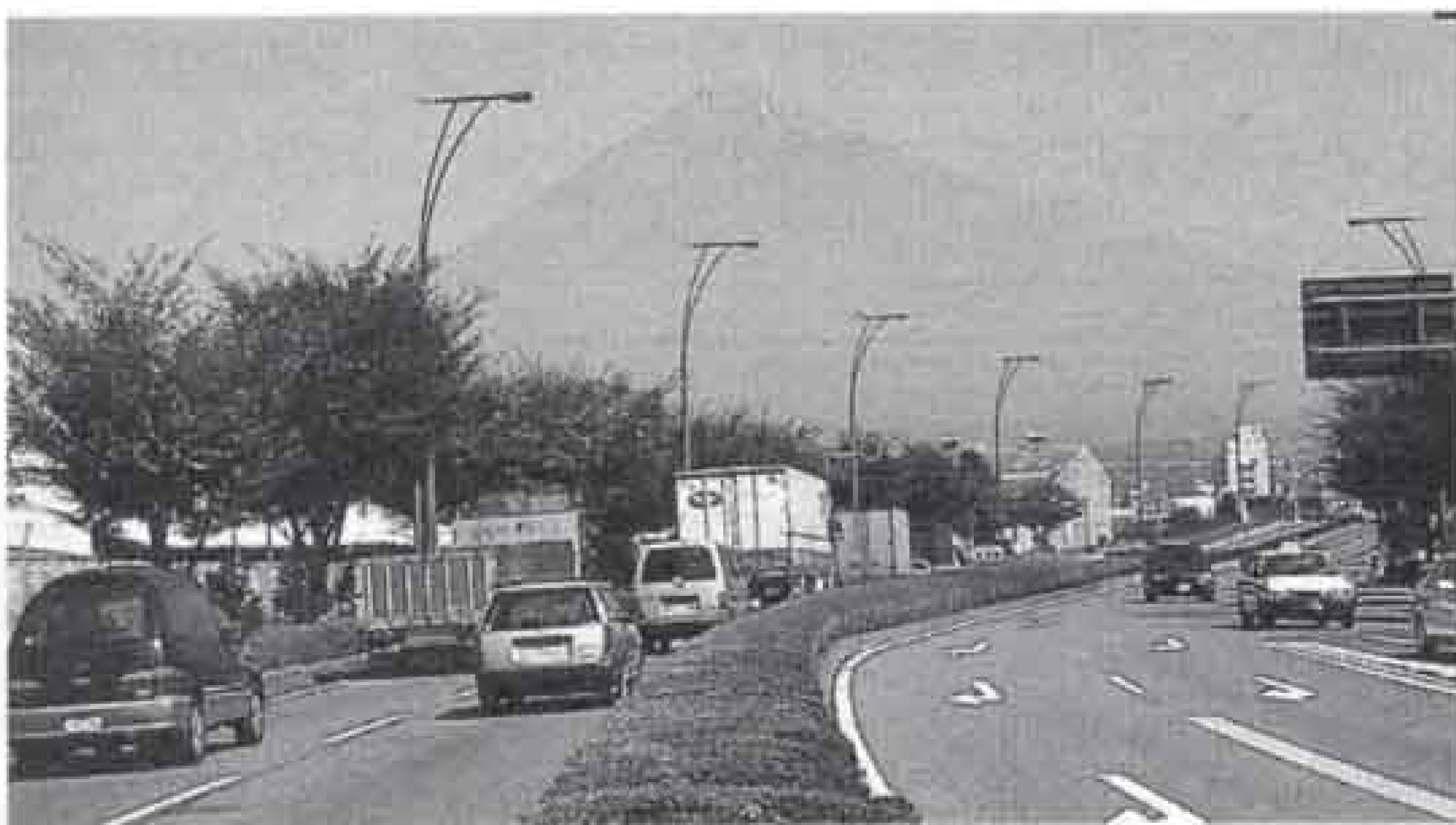
その実現に向けたまちづくりの進め方などを明らかにしていくのが「富士市都市計画マスタープラン」です。

それらのまちづくりの進捗状況や最近の社会経済状況の変化、現在のまちの問題点、例えば環境に優しいまちづくり、災害に強いまちづくりなど、将来の富士市が目指すべきまちの姿を具体的に描き、その実現に向けたまちづくりの進め方などを明らかにしていくのが「富士市都市計画マスタープラン」です。