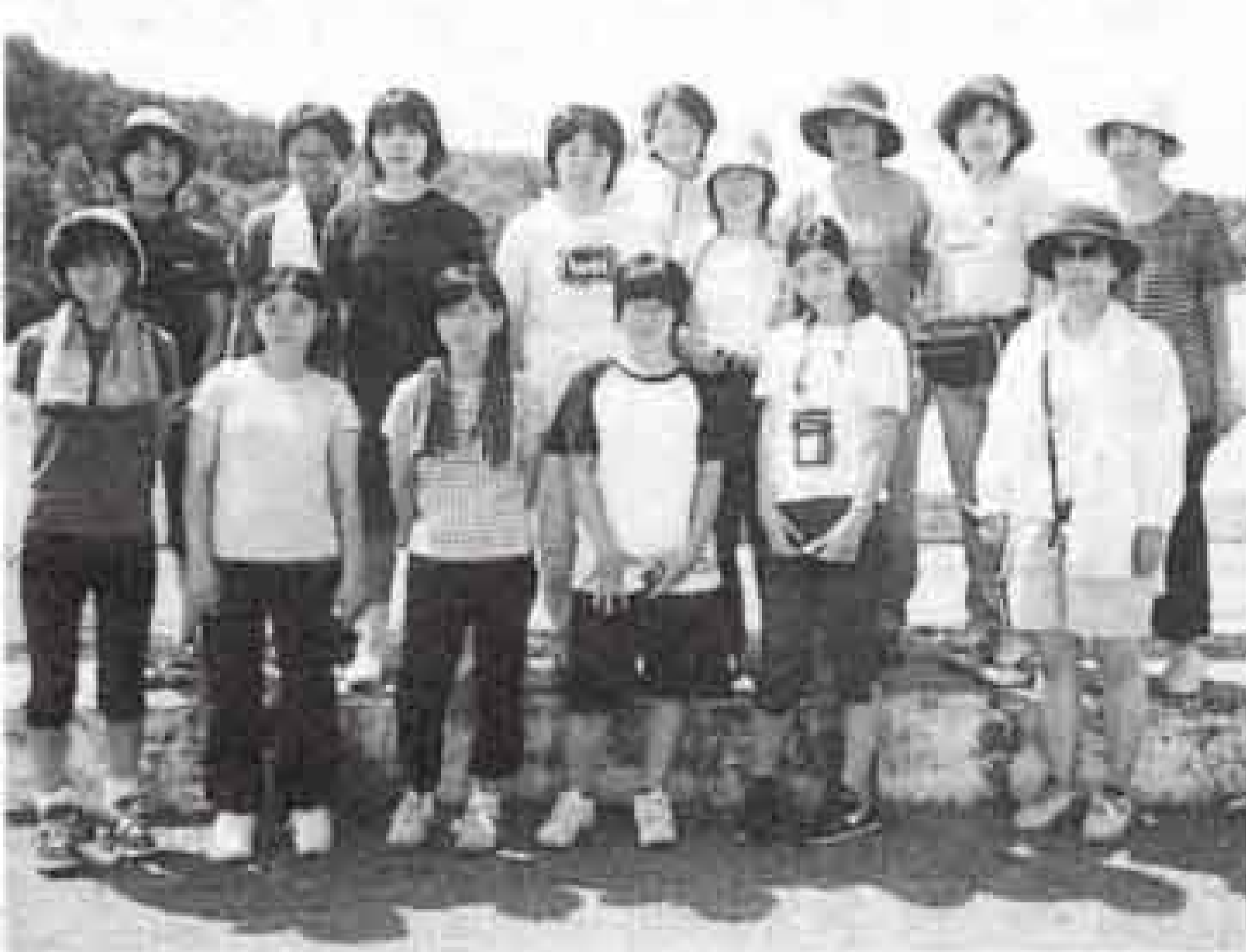
▲研修に参加した皆さん

林などを行ってきました。この研修の成果を受け継ぎ、ことし同協議会では独自にベトナムでの研修を企画。高校生の団員十人、指導員・役員五人の計十五人が参加し、マングローブの種子の採取と植林の実践活動に取り組んだほか、地元高校生との交流、ベトナム戦争ゆかりの地を訪ねました。