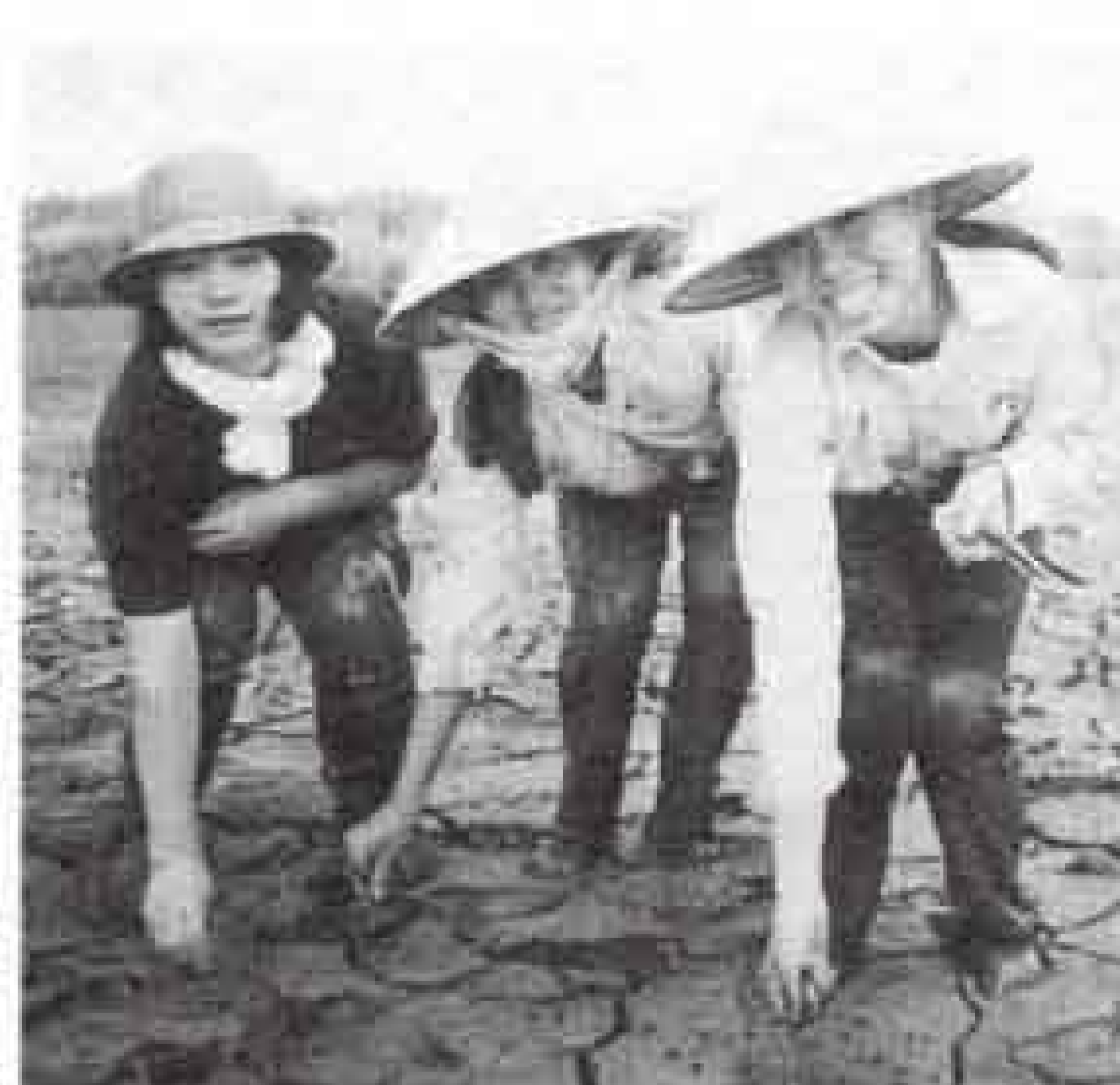
▲ベトナムの高校生と一緒にマングローブの種子を植え込む

さまざまな活動に取り組んでいるガールスカウト富士地区協議会では、七月二十五日～三十日にベトナムで海外研修を行いました。同協議会が所属するガールスカウト県支部では、これまでにNGO（非政府組織）の「ACTMANG（アクトマン・マングローブ植林行動計画）」のメンバーを招いて研修会を開催するなど、活動の一環として地球環境問題に注目。五十周年事業として平成十年から三年間、ベトナムへ研修団を派遣し、ベトナム戦争で荒廃した森林の再生を目指し、マングローブの植