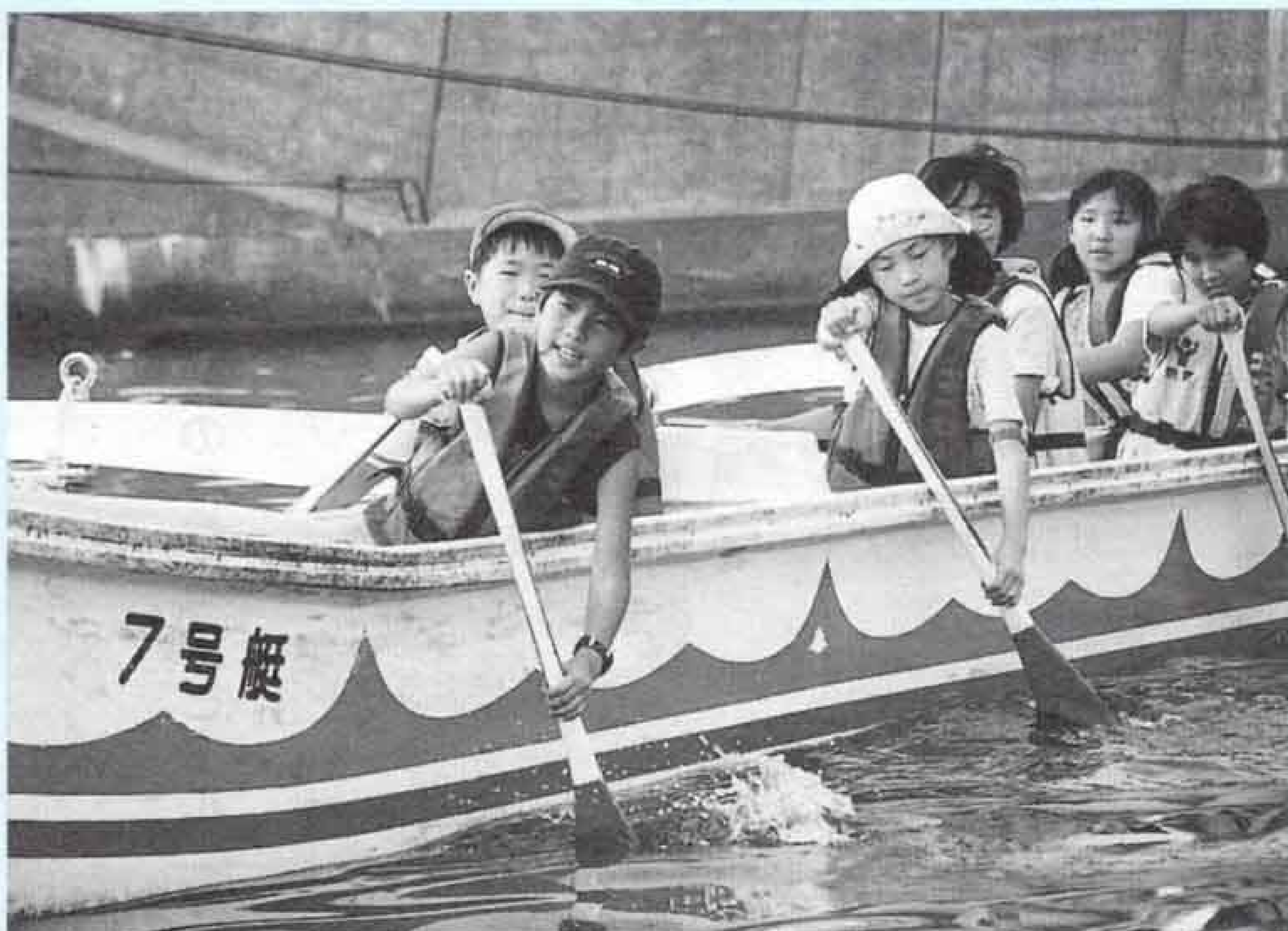
ゴールの港を目指して「イチ、ニ、イチ、ニ」