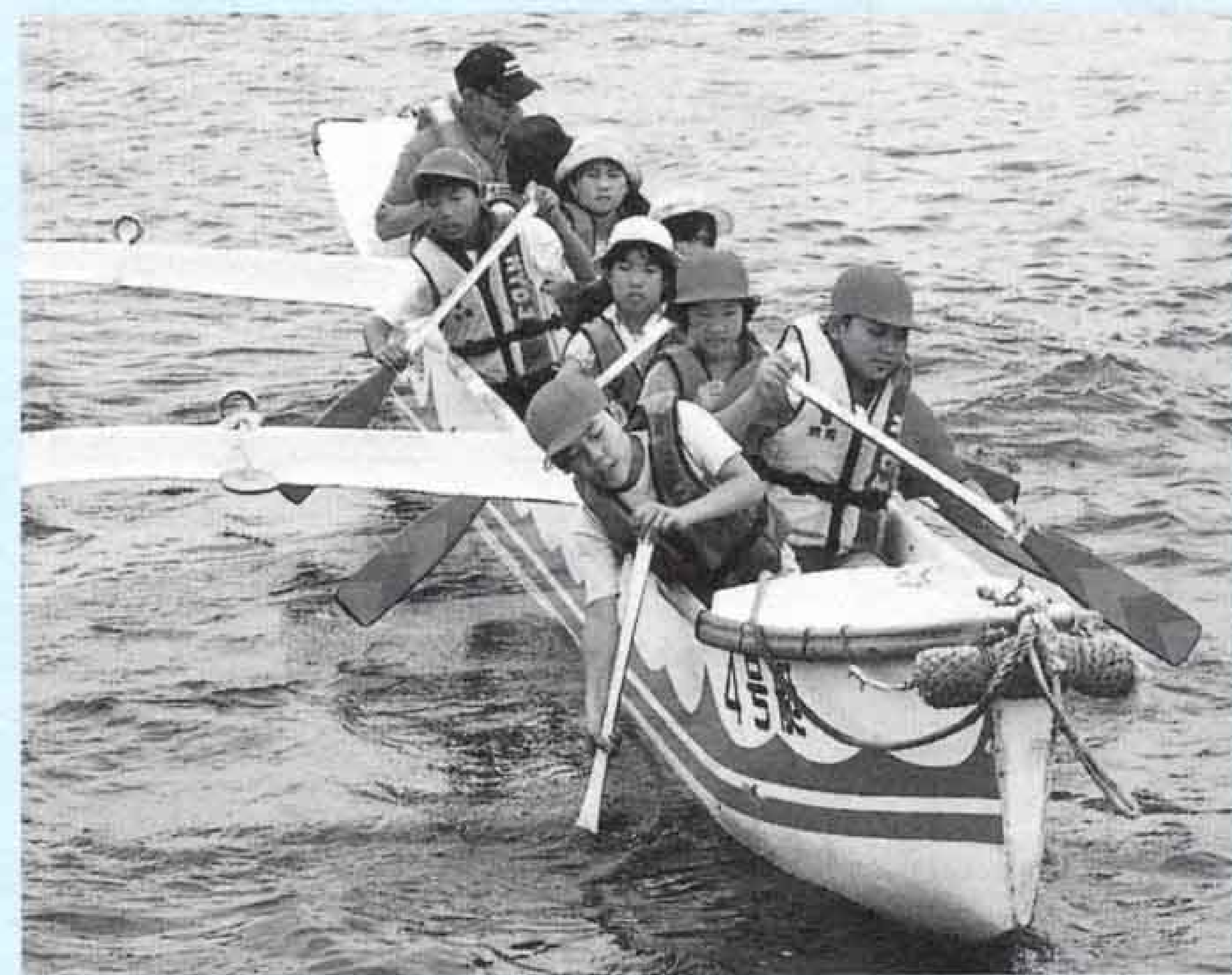
「波に負けるな、そーれ、そーれ」