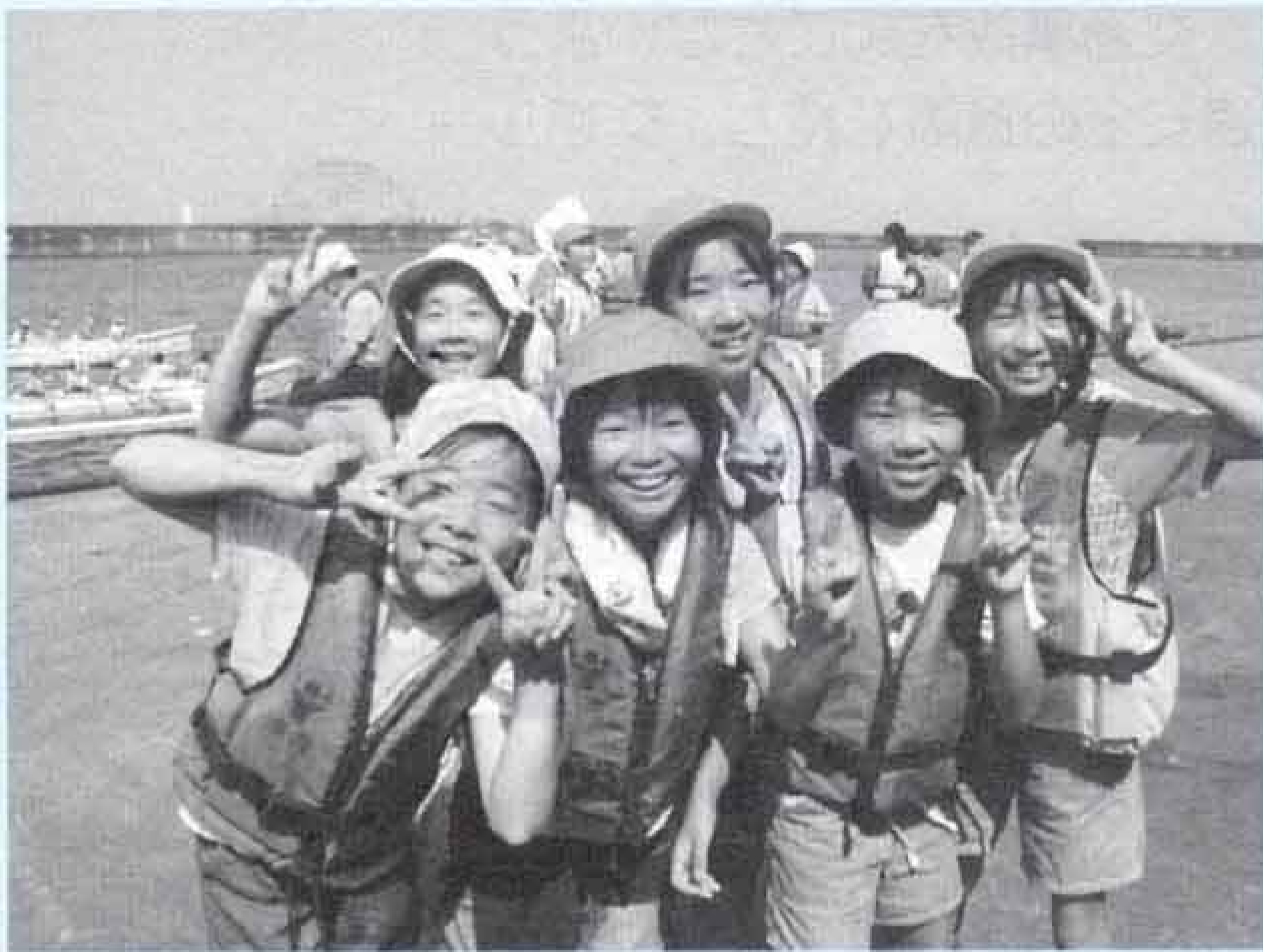
「楽しかったね。みんなでハイ、ポーズ」