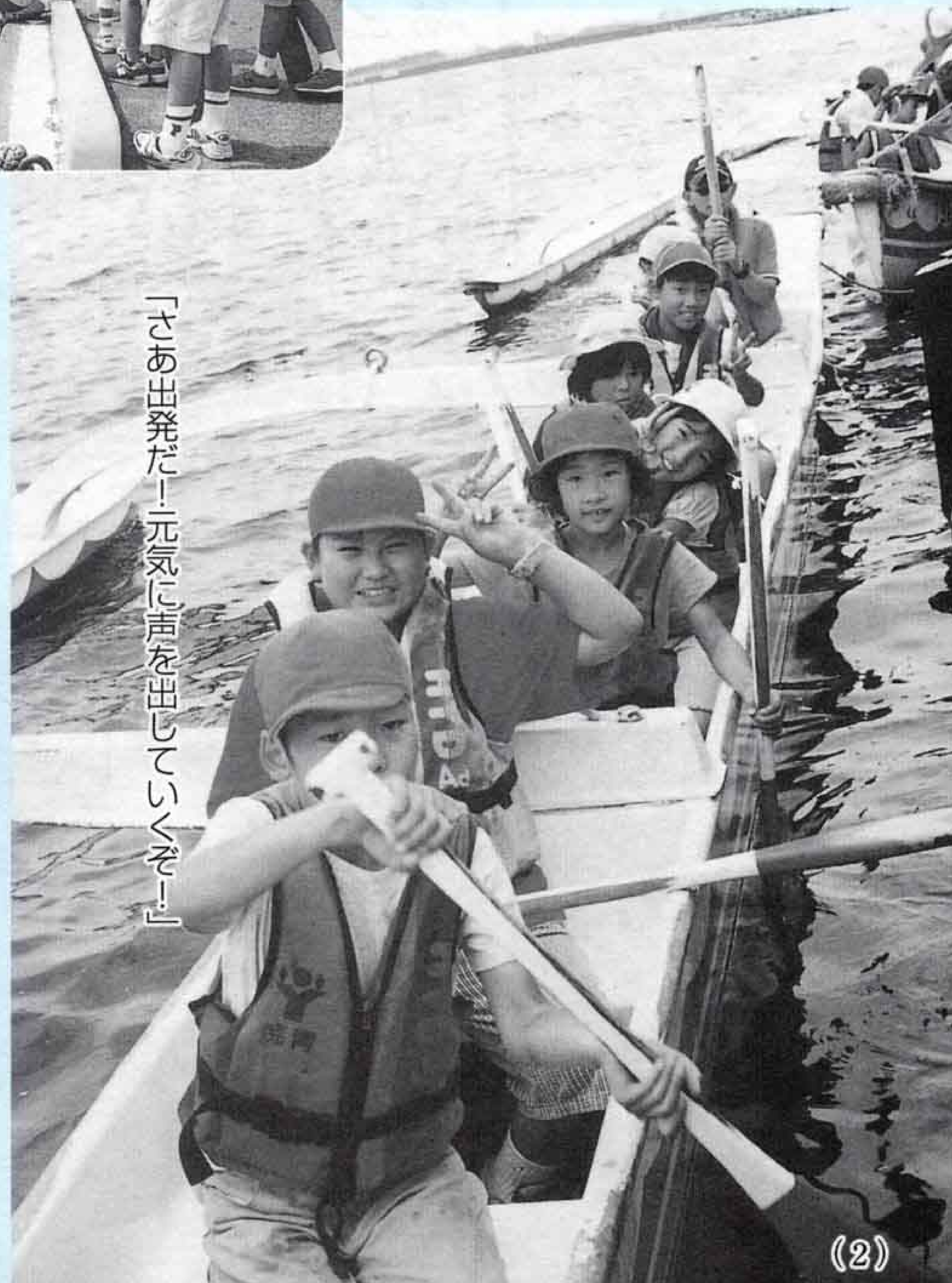
「さあ出発だー元気に声を出していくぞー！」