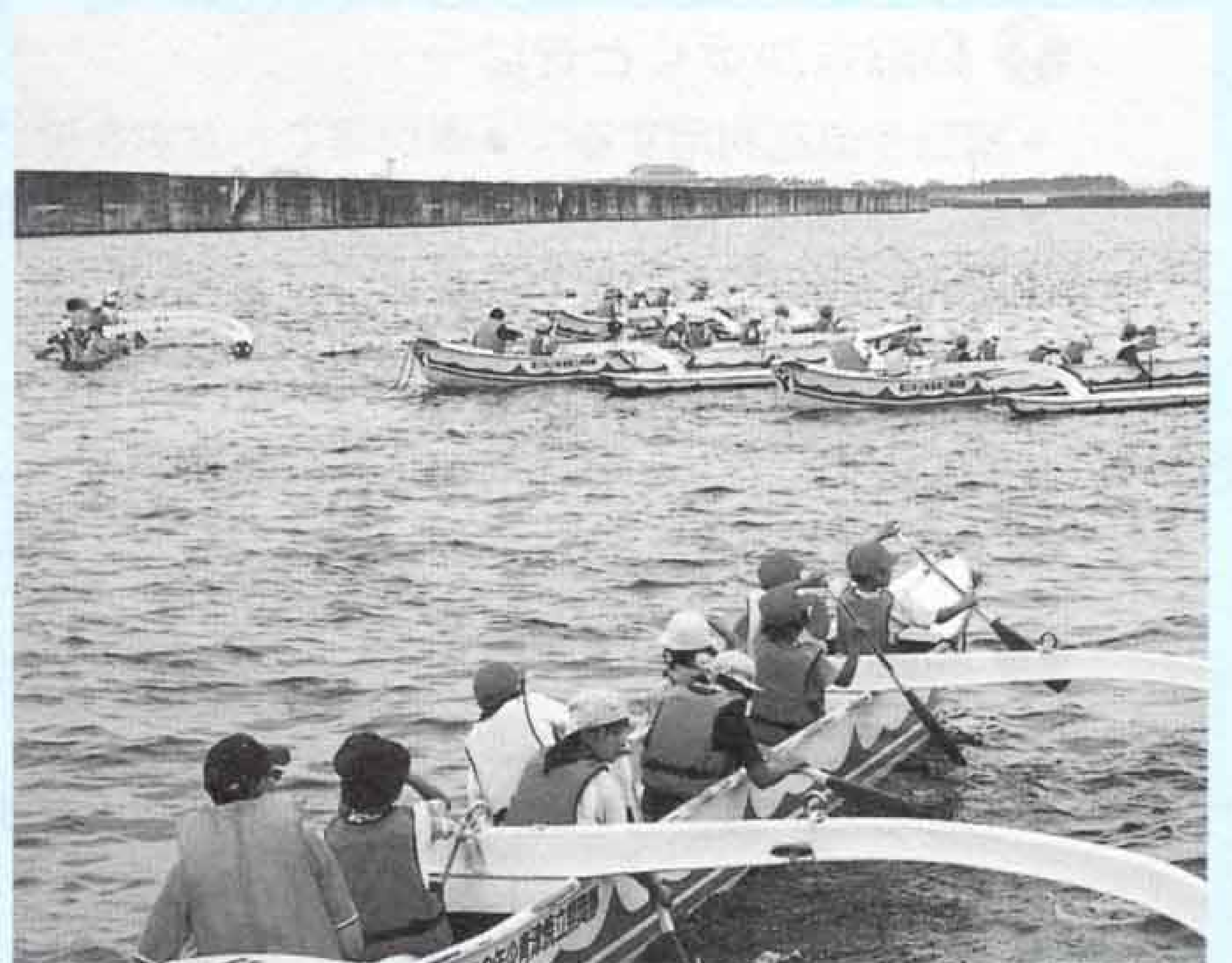
「それ、追いつけ、追い越せ」