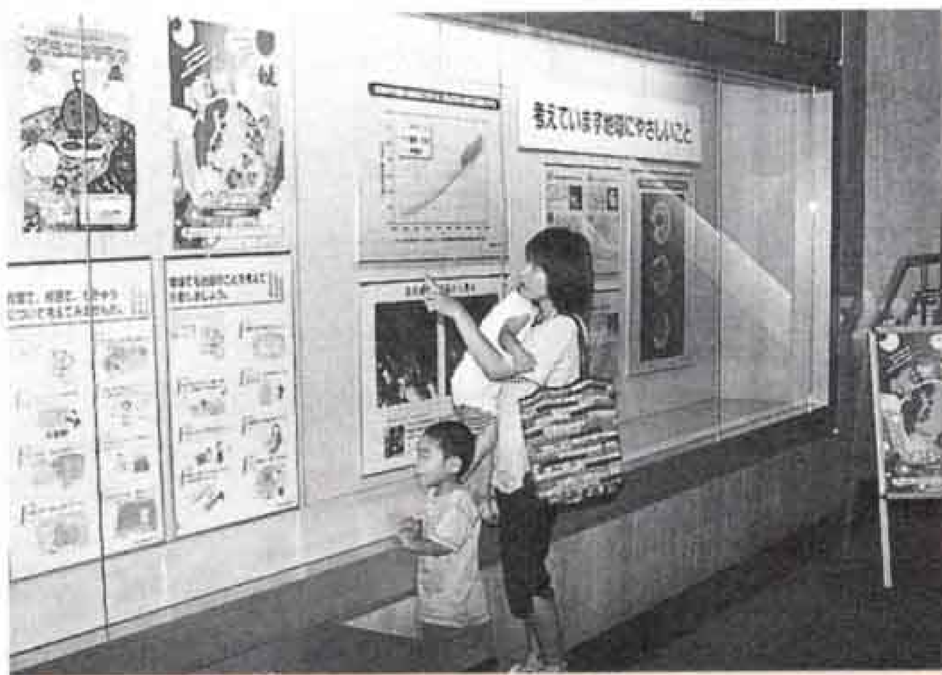
中央図書館で、環境をテーマにしたパネル展示『わたしたちと環境展』が6月12日～29日まで行われました。