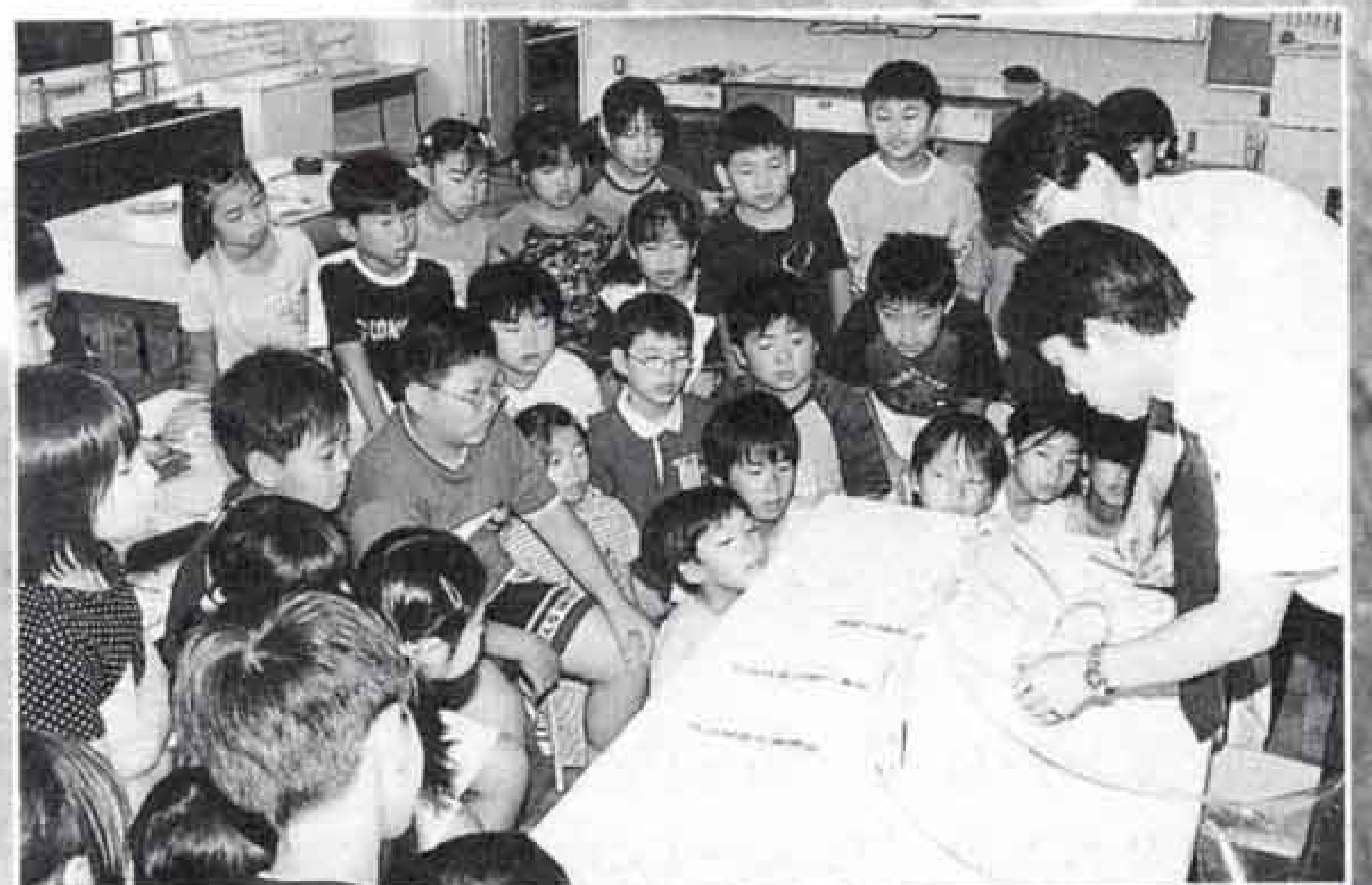
伝法小学校の4年生を対象に行われた環境学習会では、空気や水の汚れなどを市職員と一緒に調べ、環境を守る大切さを学びました。