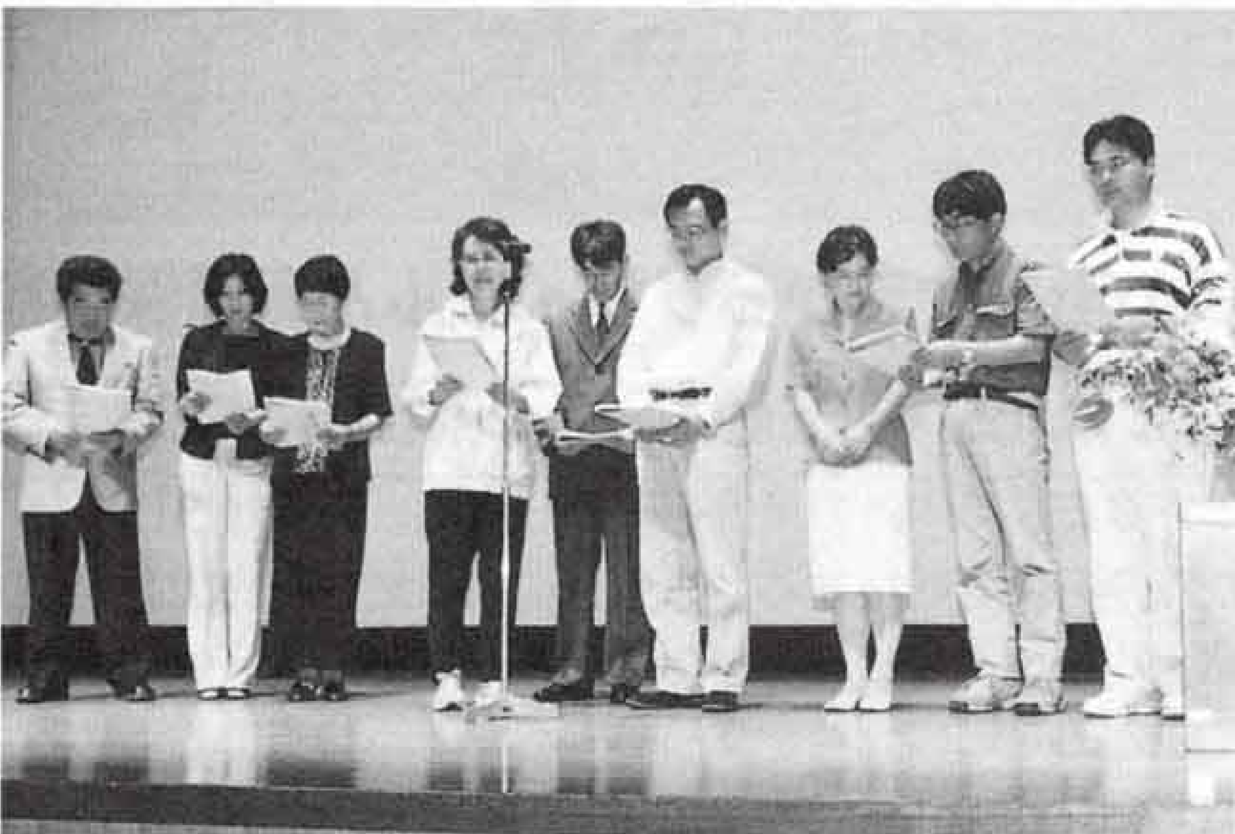
▲『ふじエコネット』設立を宣言する参加者