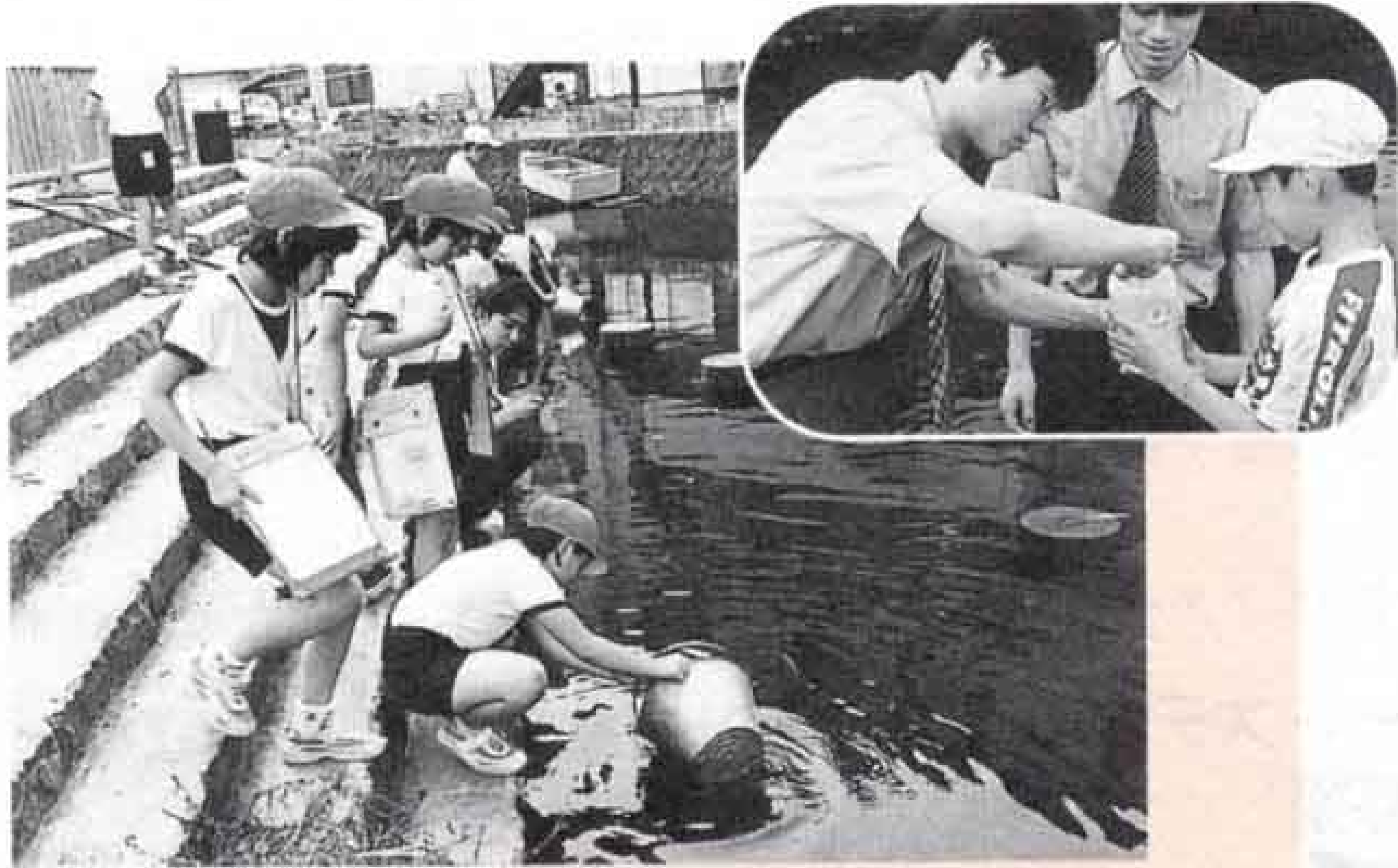
今泉小学校の4年生は環境学習会の後、野外調査に出かけ、田宿川など小学校周辺の川の水をくみ、水質調査を行いました。