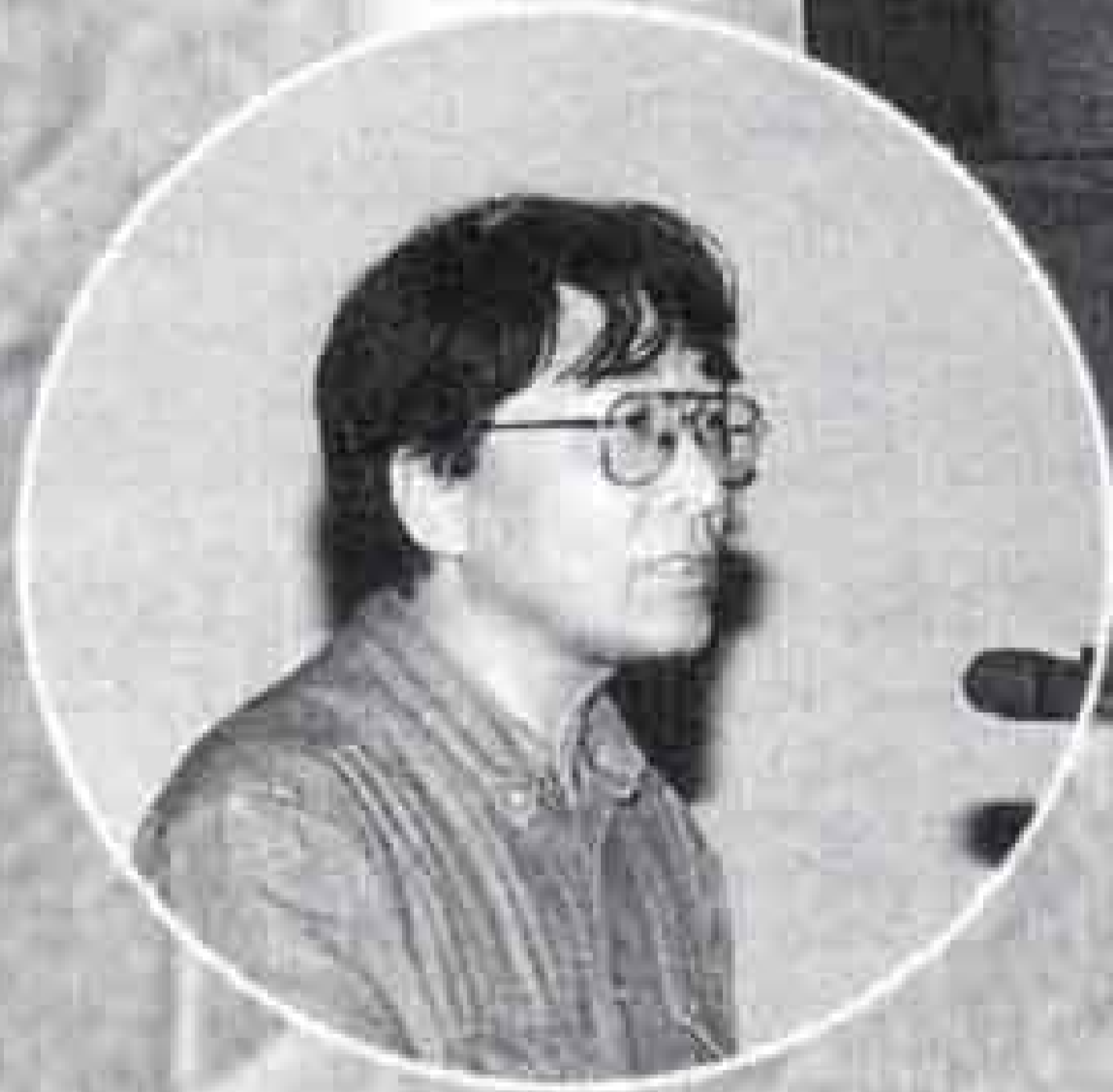
▲参加市民団体による 日ごろの活動報告が行われた