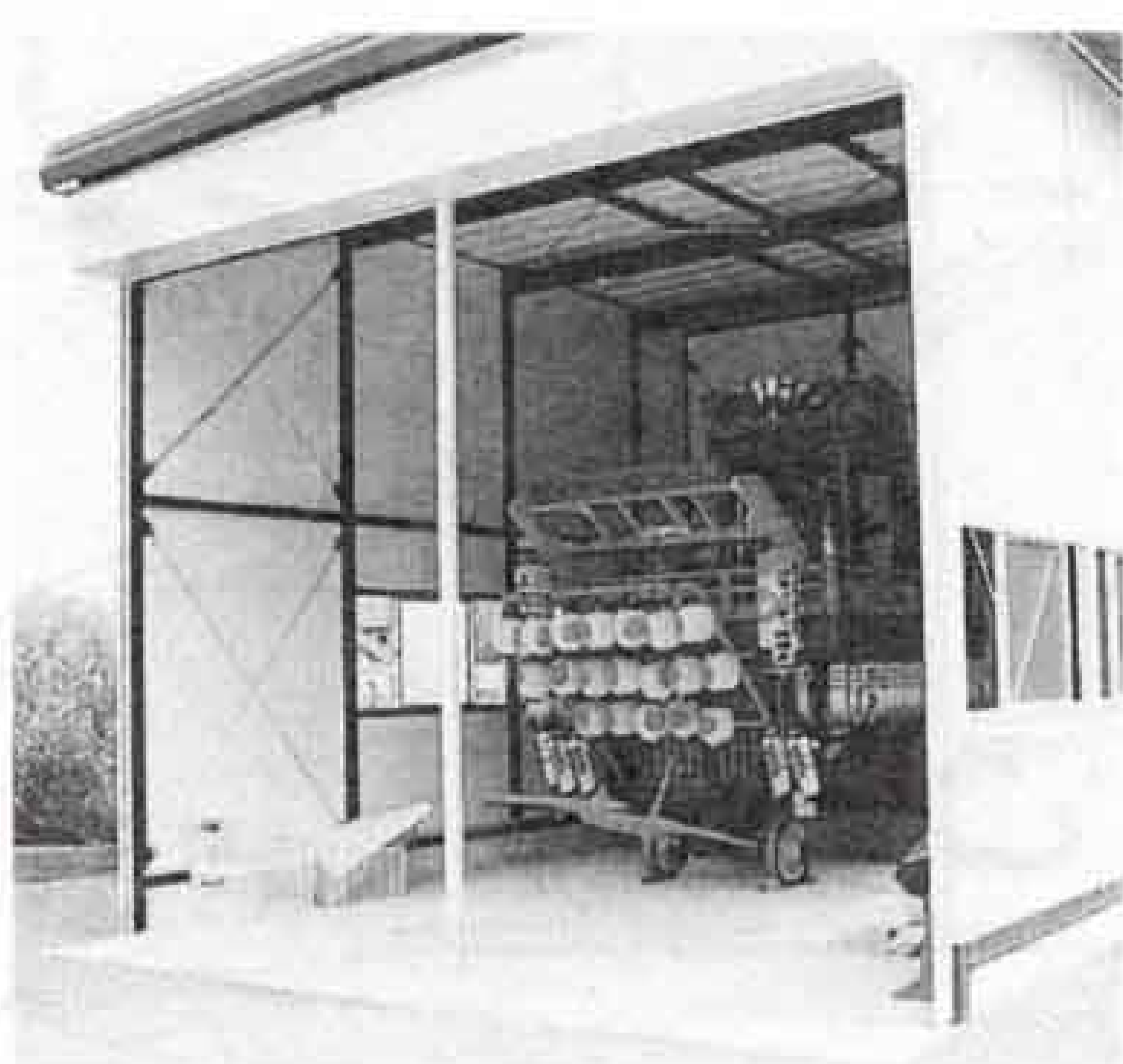
▲完成した山車保管庫と山車

民の熱意や公民館、市の協力で、この山車保管庫が完成しました。これからはこの山車を生かし、和太鼓の打ち手の育成にも取り組んでいきたいと思えます。青少年の新たな目標として、『夏まつりで太鼓をたたきたい』とってもらえるような、広見地区にふさわしい太鼓の音を響かせたいですね。 今の子どもたちが、将来広見を離れても、夏まつりが近づくと思ってきて、山車を引き回し太鼓をたたき、そんな光景を夢見ながら、七月二十八日の夏まつりに向けて準備を頑張っていきたいと思えます」と話してくれました。