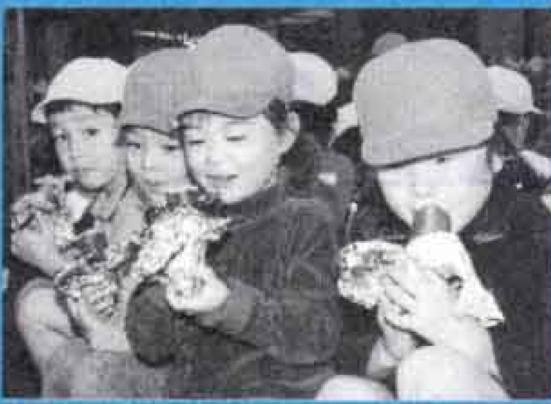
十一月十六日 焼き芋大会 (岩松幼稚園)