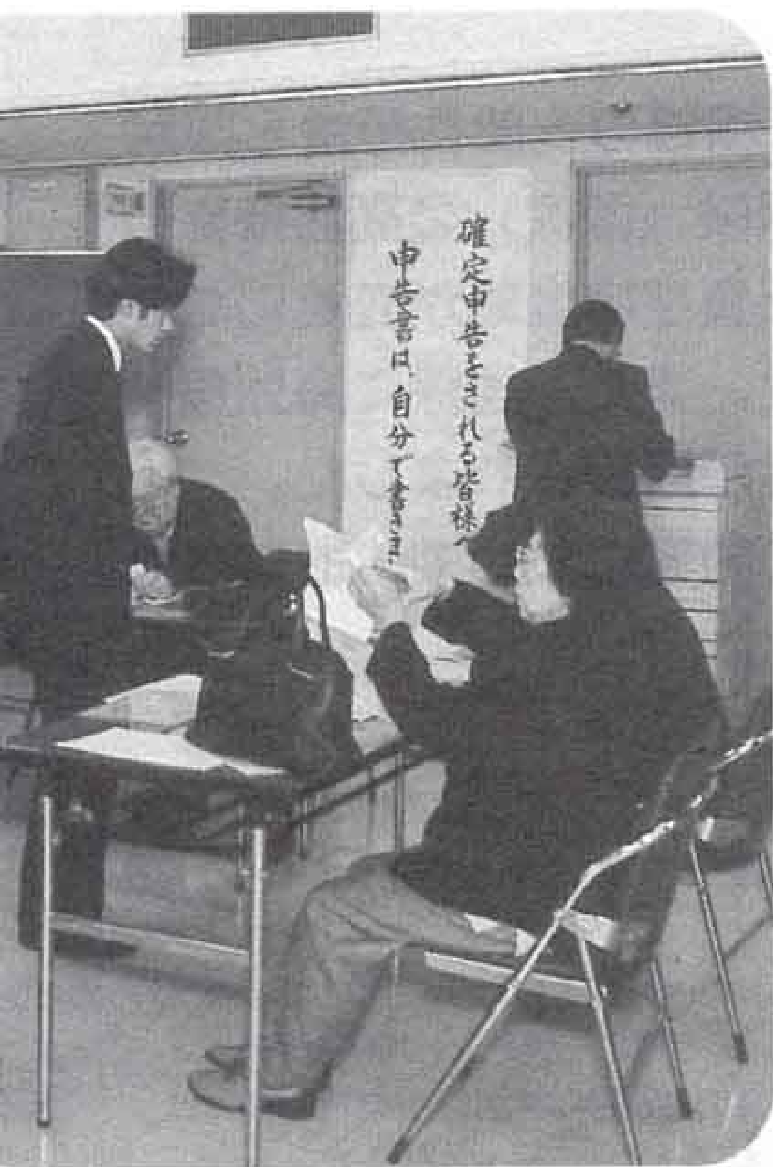
▲申告者自身が申告書を作成 (昨年の申告受付から)