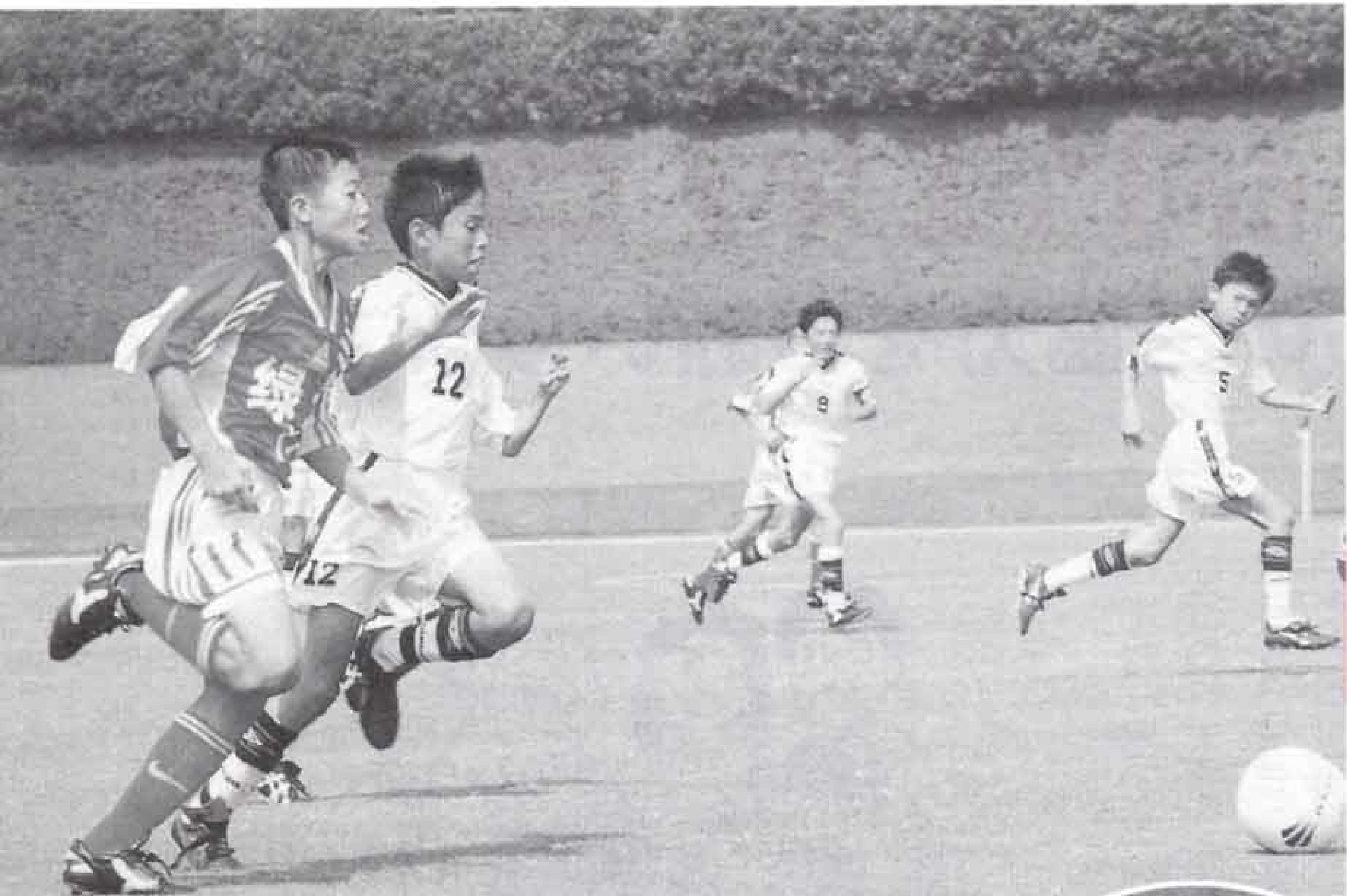
▲富士JFCと中国浙江省選抜チームとの交流試合。 熱戦が2試合繰り広げられました