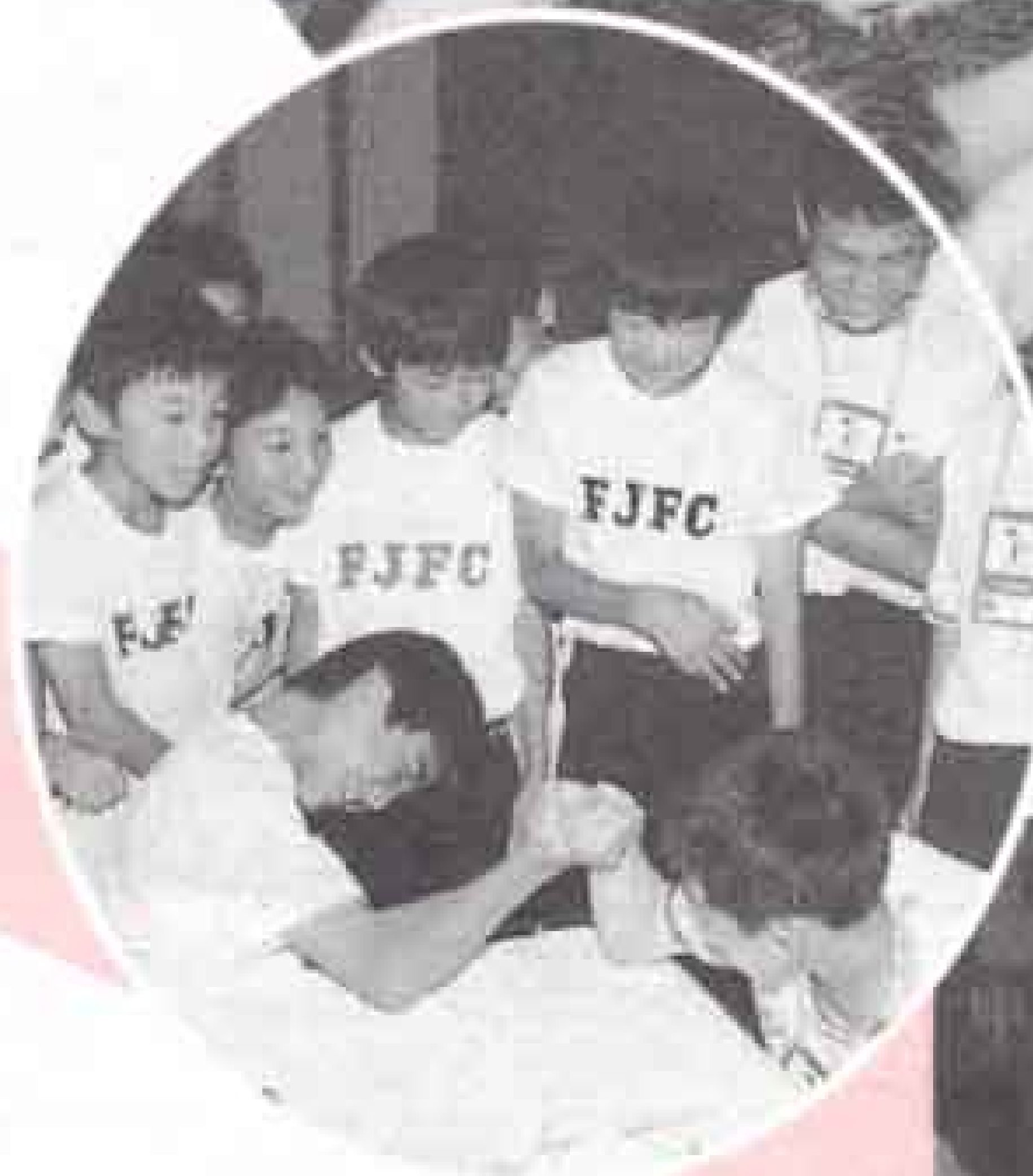
▲サッカーだけでなく腕相撲でも対戦