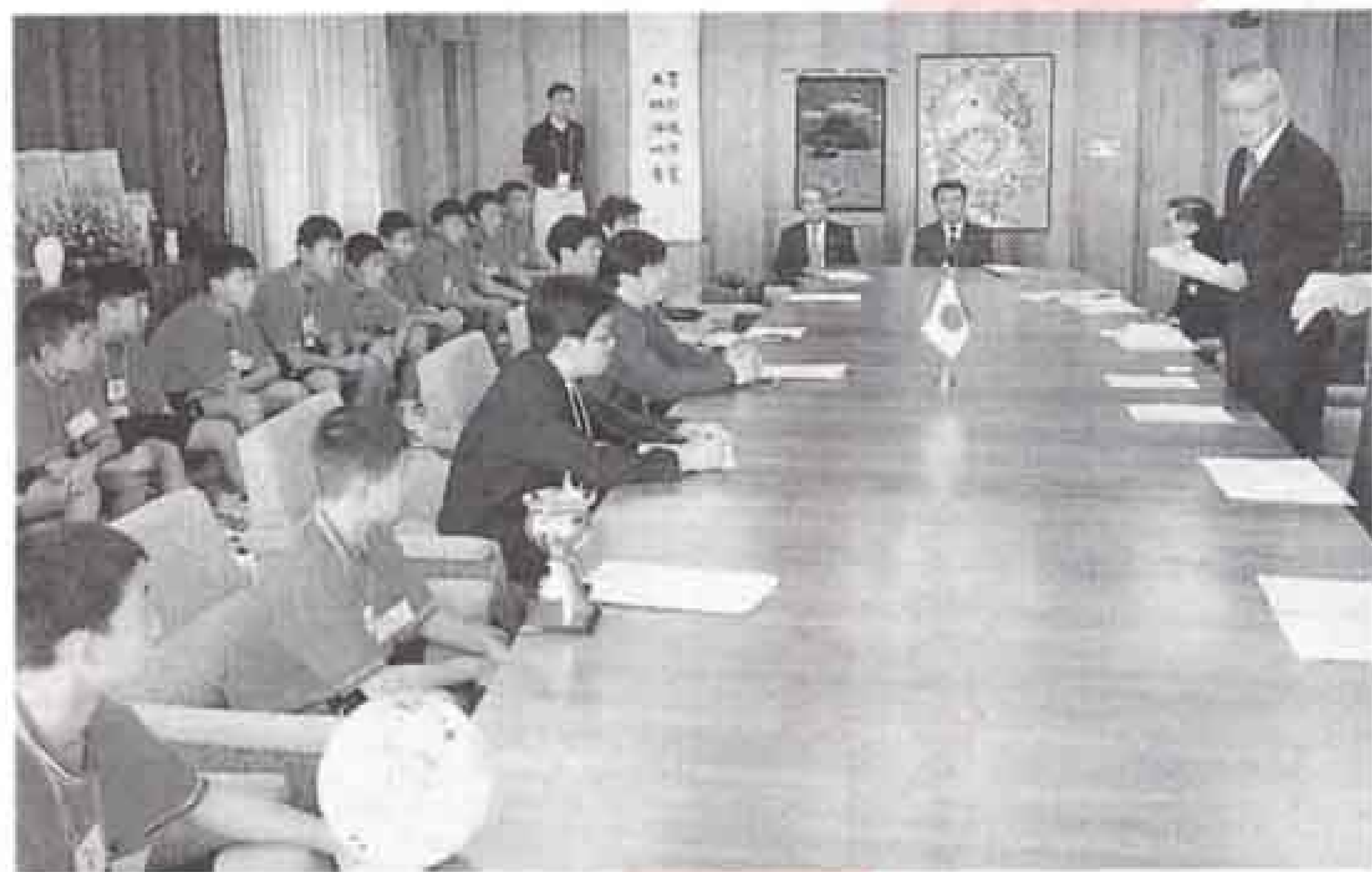
▲中国チームは大会後に市長を表敬訪問