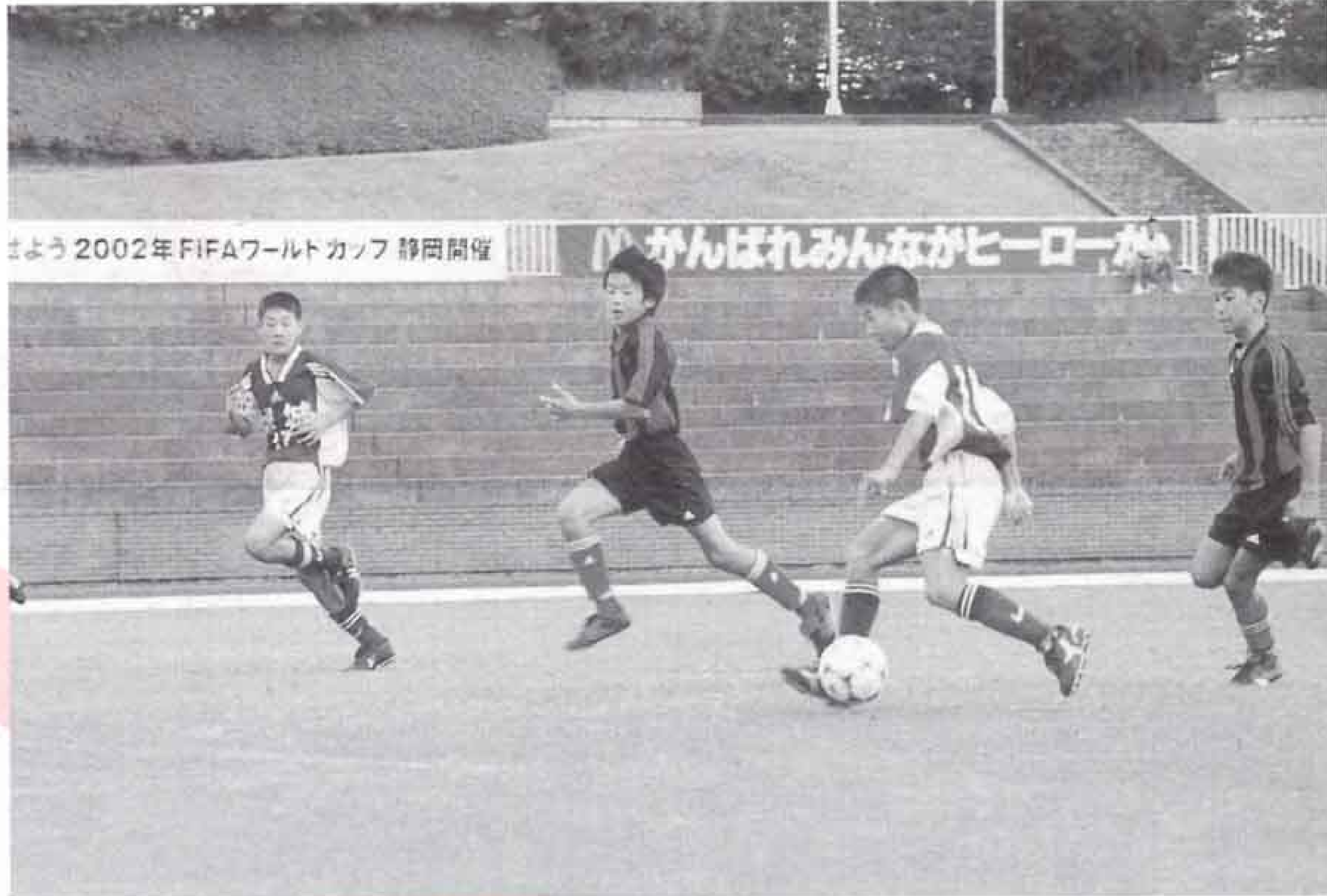
▲富士市の選手5人を含む県東部選抜チームと中国チームとの試合。 試合は4-0で中国チームが勝利。この大会で中国チームは準優勝しました