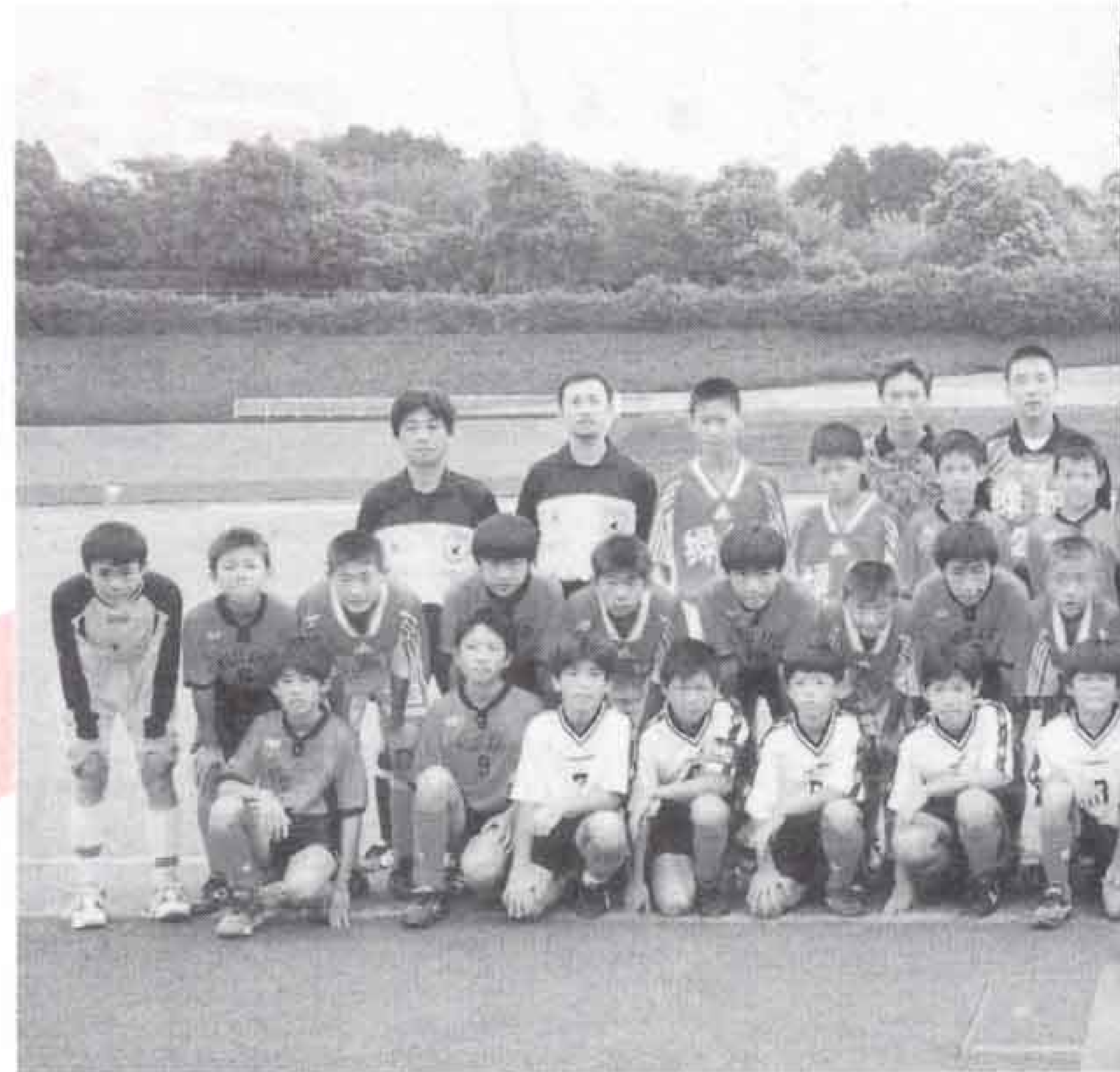
▲富士JFCと中国浙江省選抜チームの皆さん