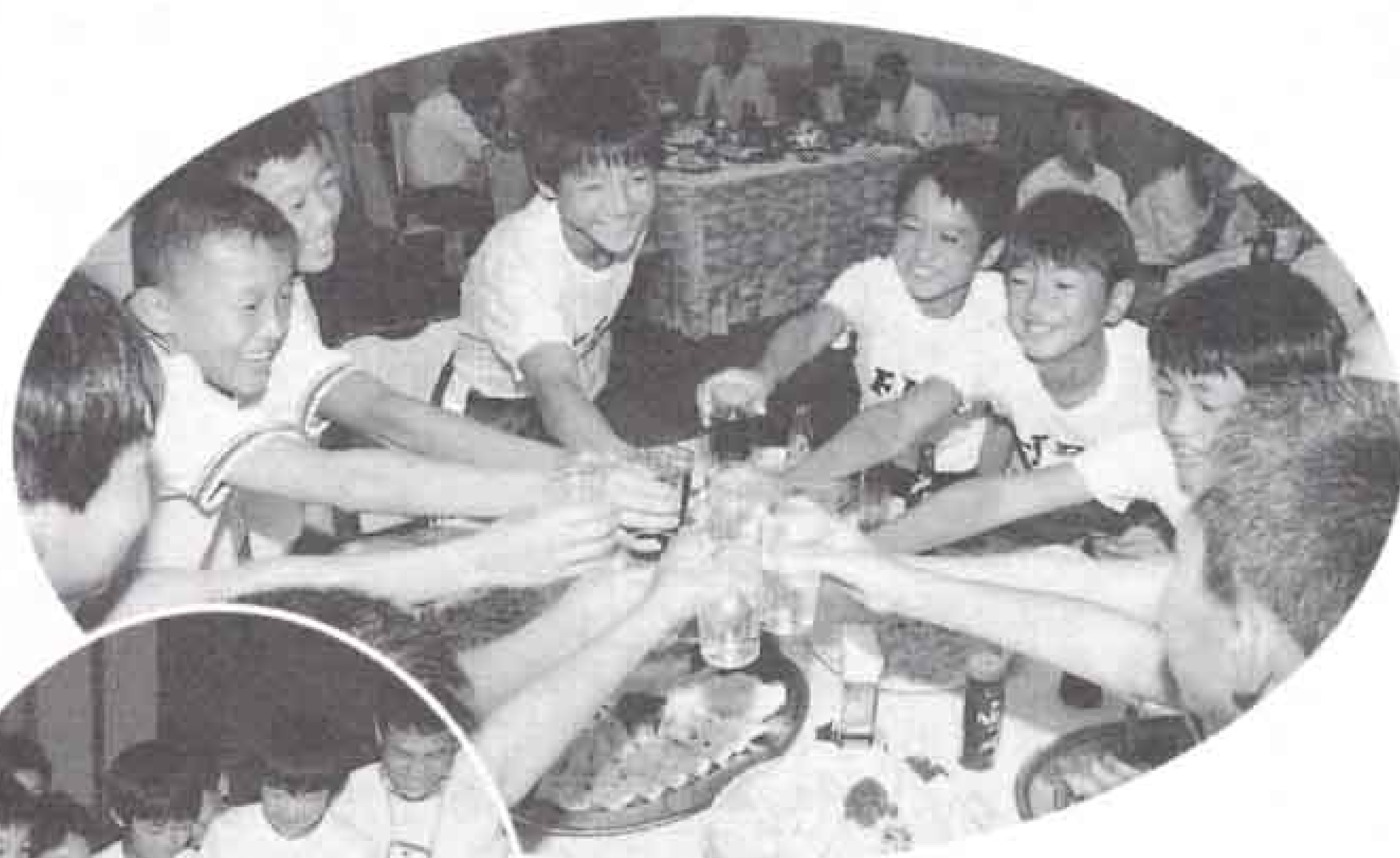
▲試合後の交流会は笑顔いっぱい 「みんなで乾杯!!」