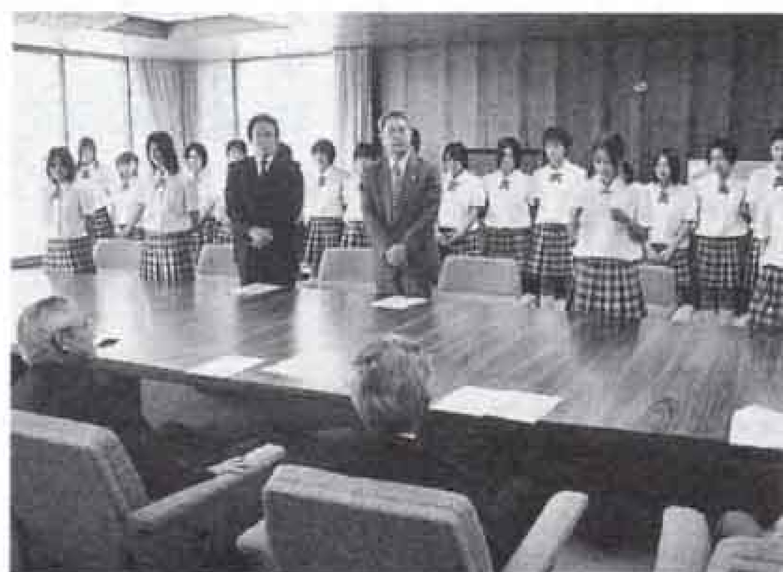
▲全国大会に向けて決意をあらわす吉高女子サッカー部の皆さん