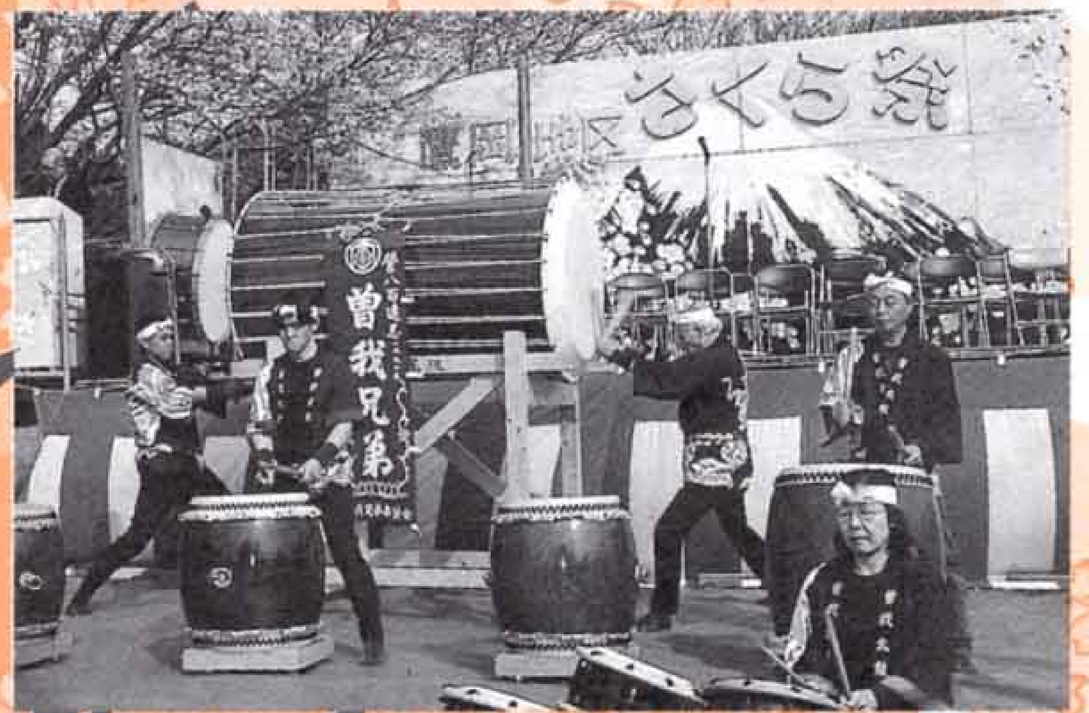
4月2日 鷹岡地区さくら祭 (潤井川左岸桜並木)