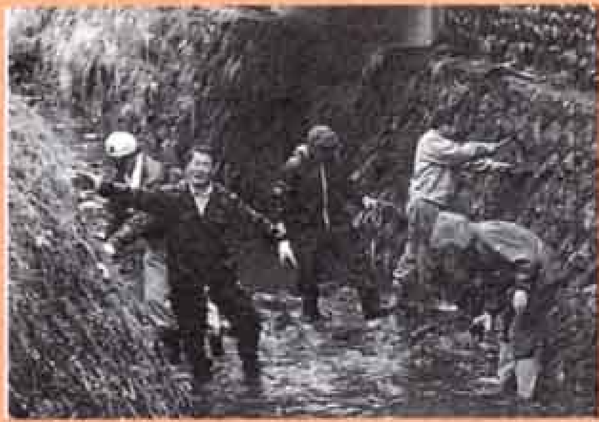
四月九日～十六日 春季河川美化運動 (春堀・丘地区)