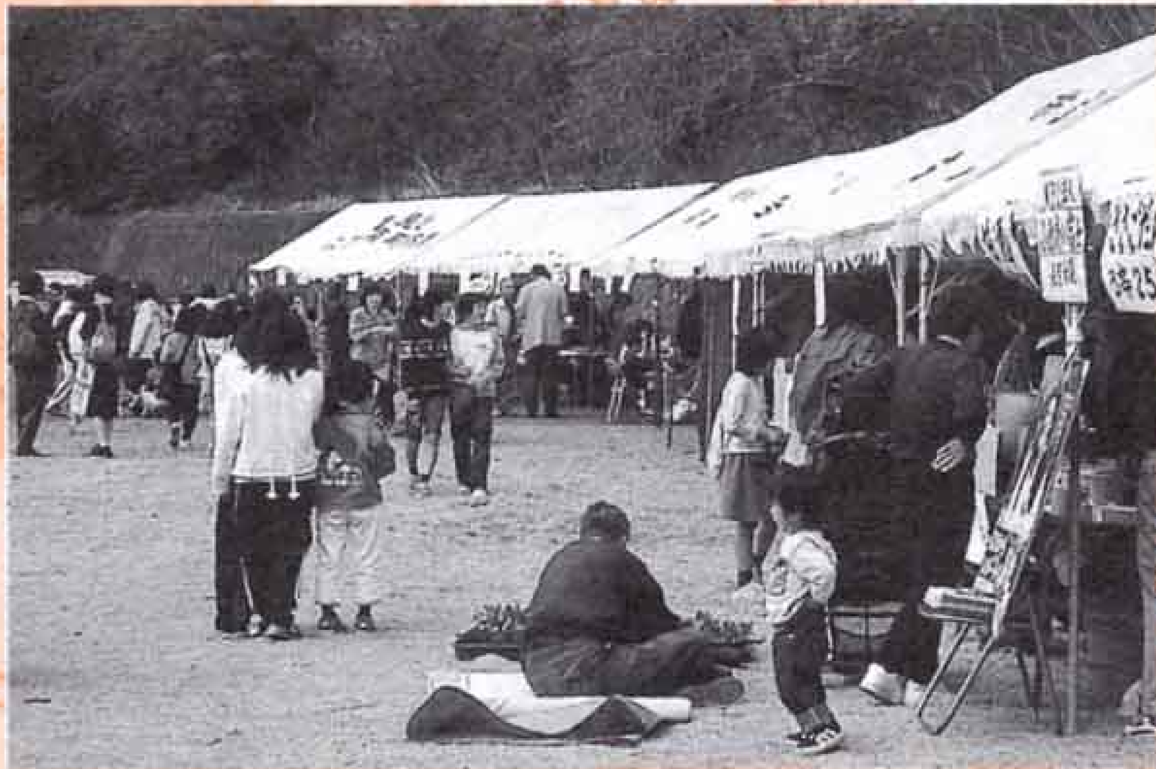
4月1日 富士見台地区さくらまつり (桜が池)