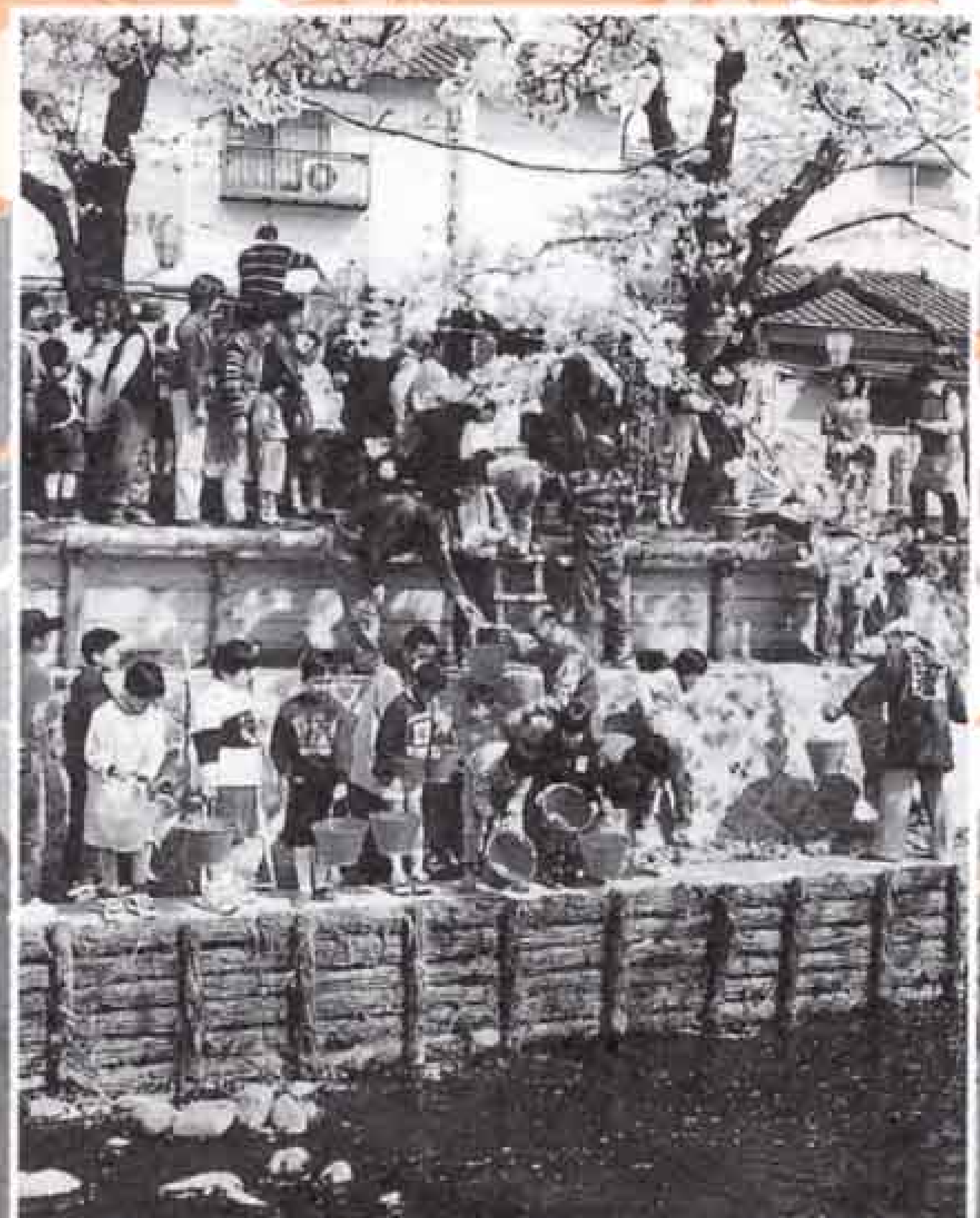
4月8日 吉原地区さくら祭 (小潤井川兩岸)