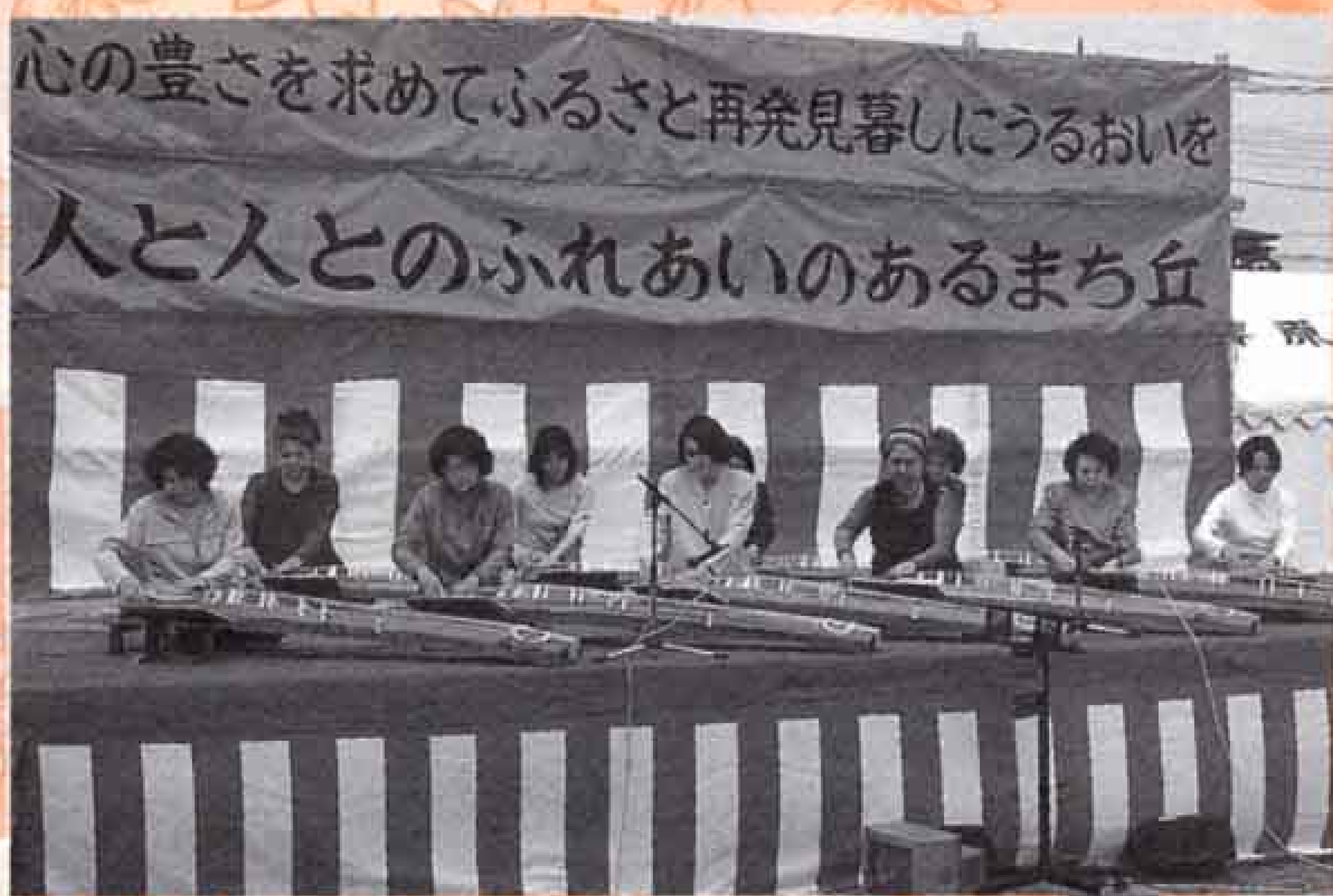
4月2日 丘地区桜まつり (厚原スポーツ公園)