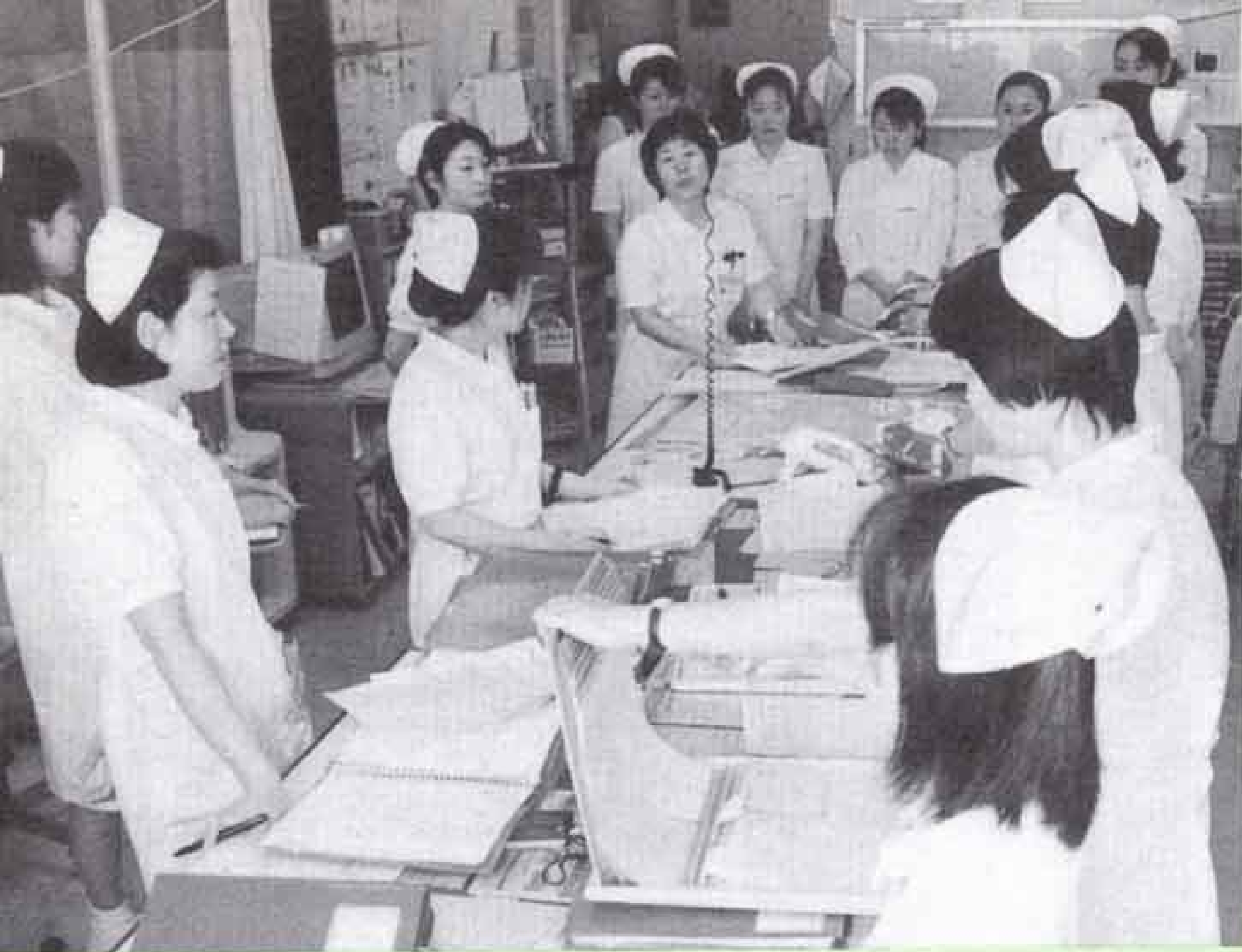
朝の打ち合わせには日勤と深夜勤務の全員がそろろう