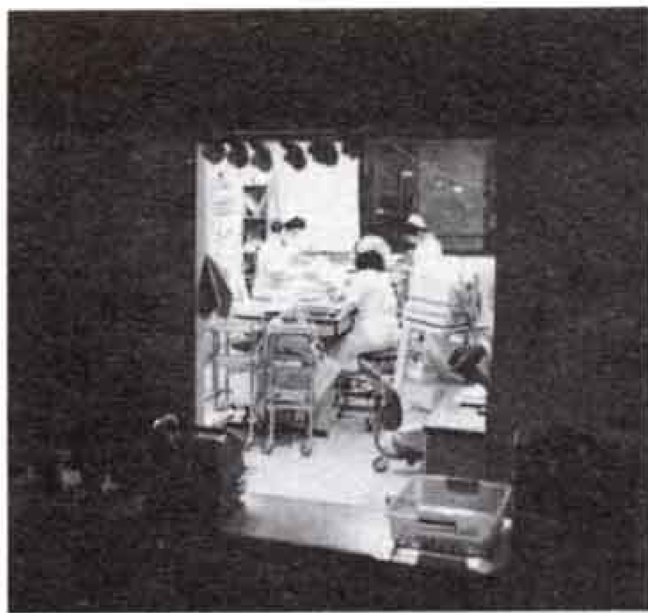
●三交代で患者さんを見守る看護婦さん。病院は一日中眠りません