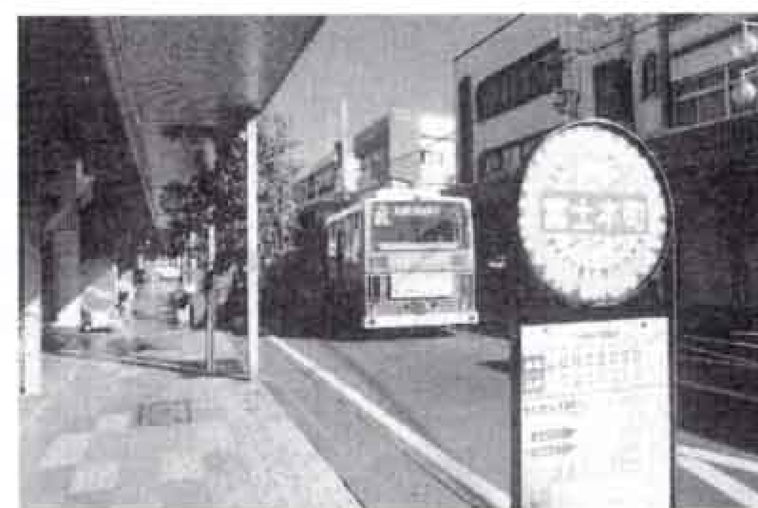
▲富士本町通りも通行

8:30~16:00の間、それぞれ30分間隔(右回り、左回りあわせて1時間に4本)で運行しています。また、コース1周は約30分です。※日曜日、祝祭日は、運休です。