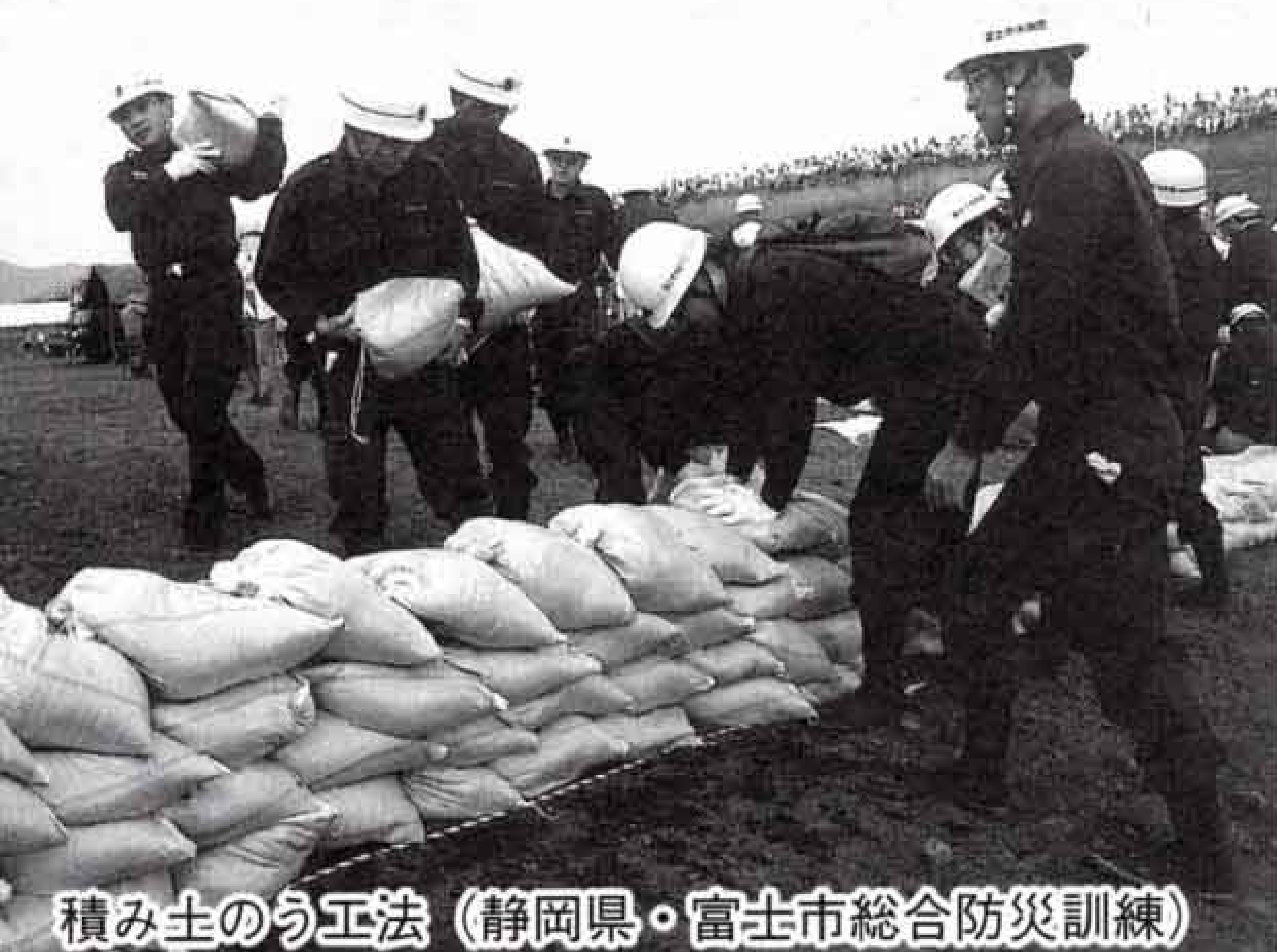
積み土のう工法 (静岡県・富士市総合防災訓練)