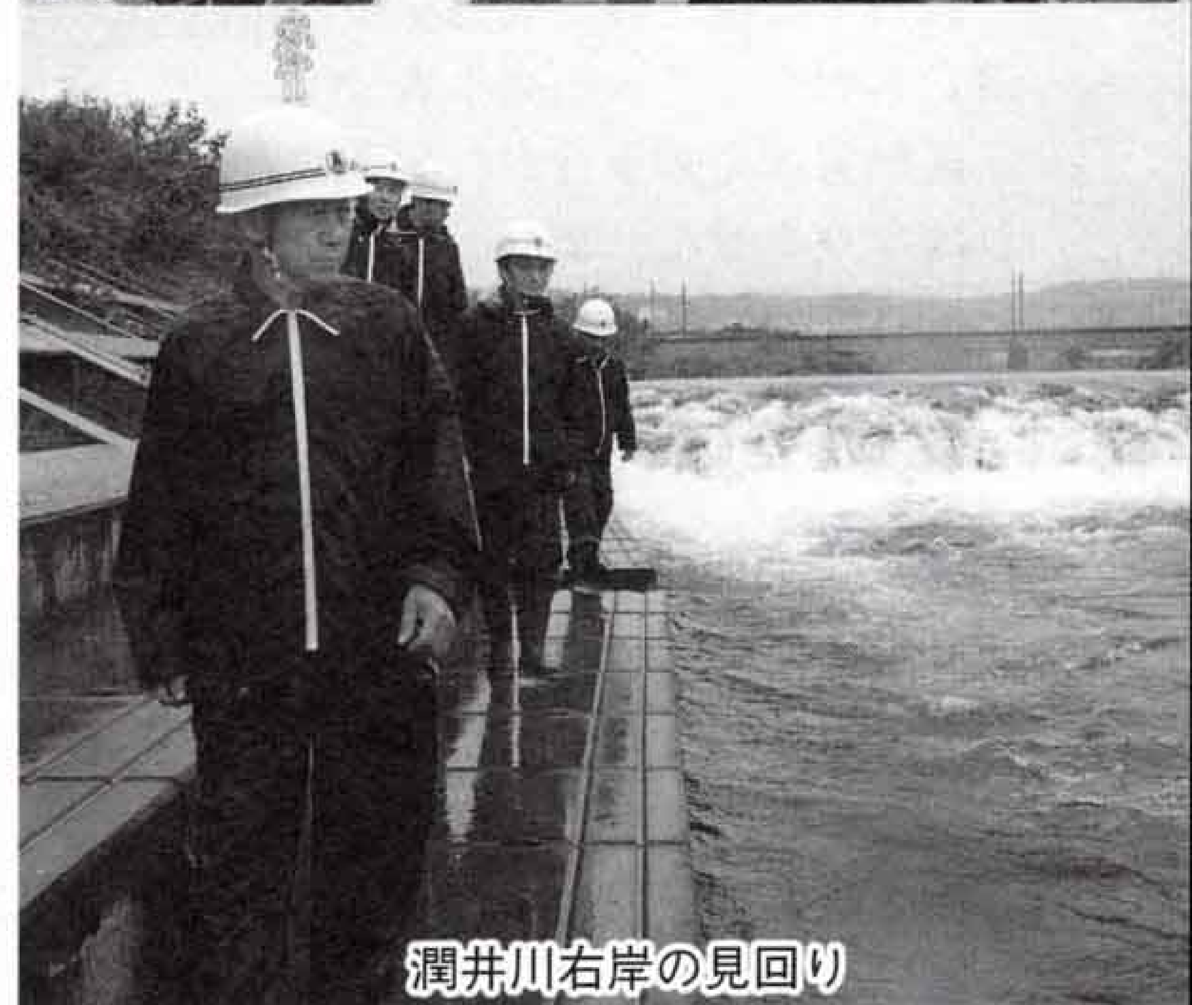
潤井川右岸の見回り