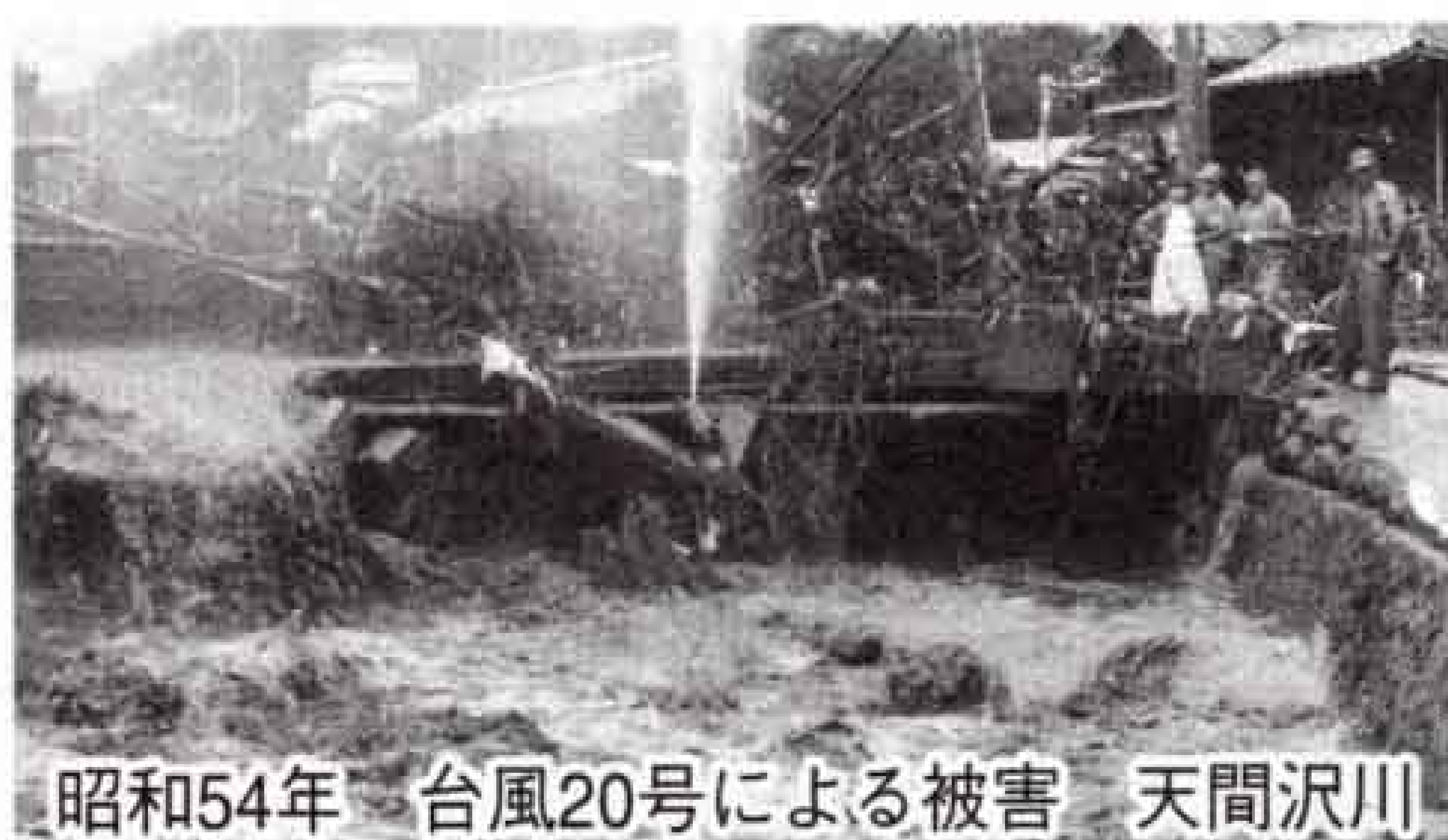
昭和54年 台風20号による被害 天間沢川