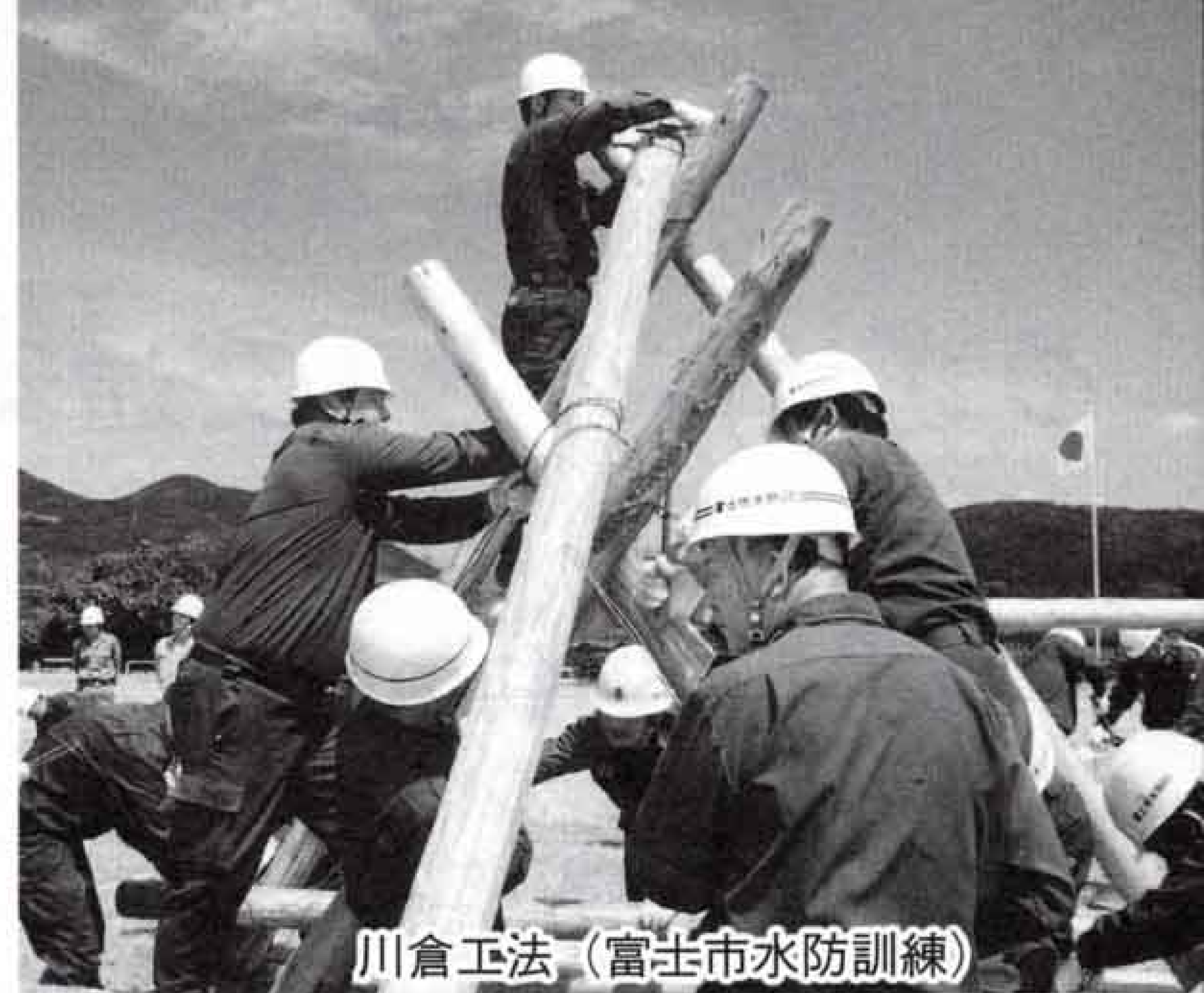
川倉工法 (富士市水防訓練)