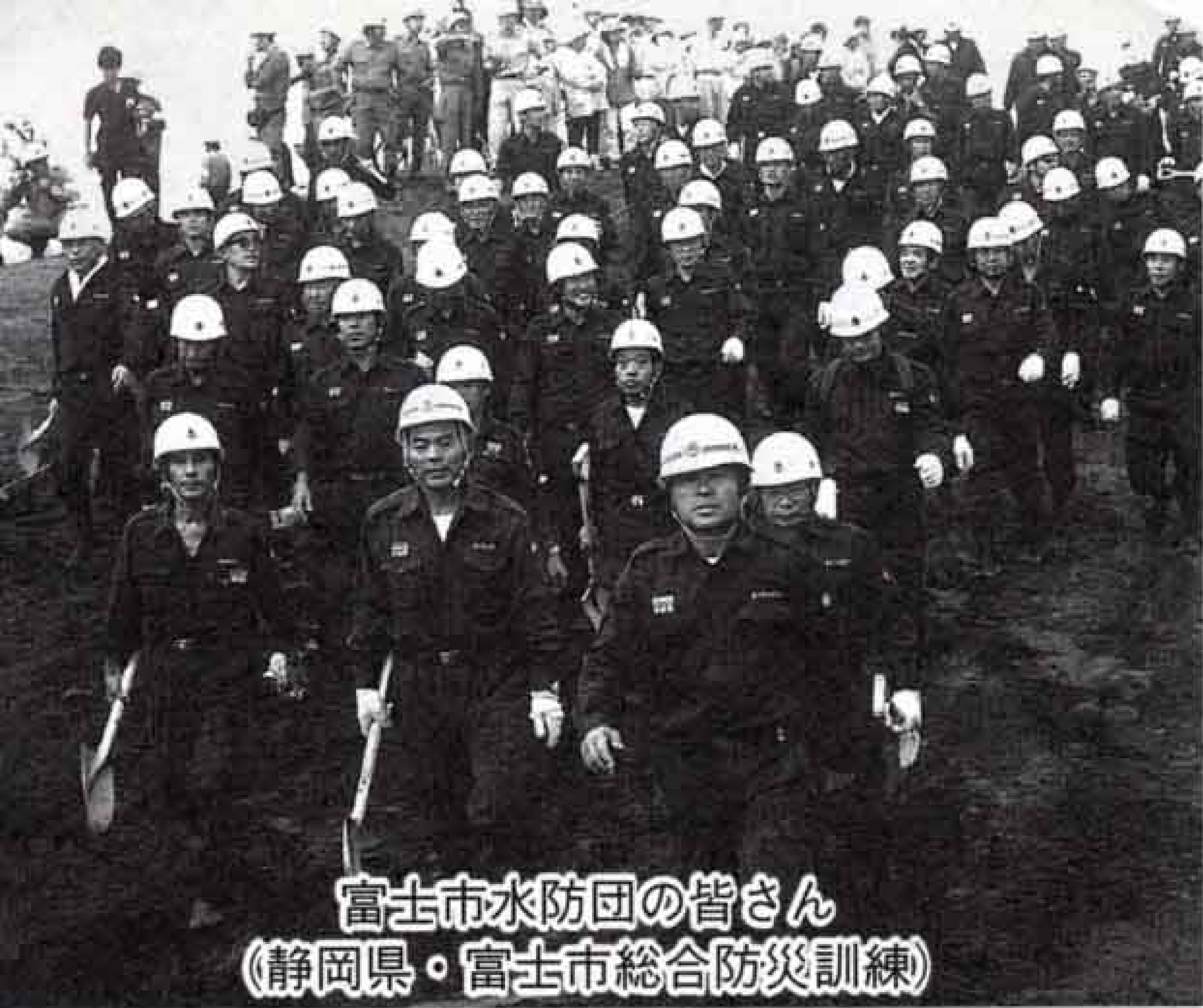
富士市水防団の皆さん (静岡県・富士市総合防災訓練)