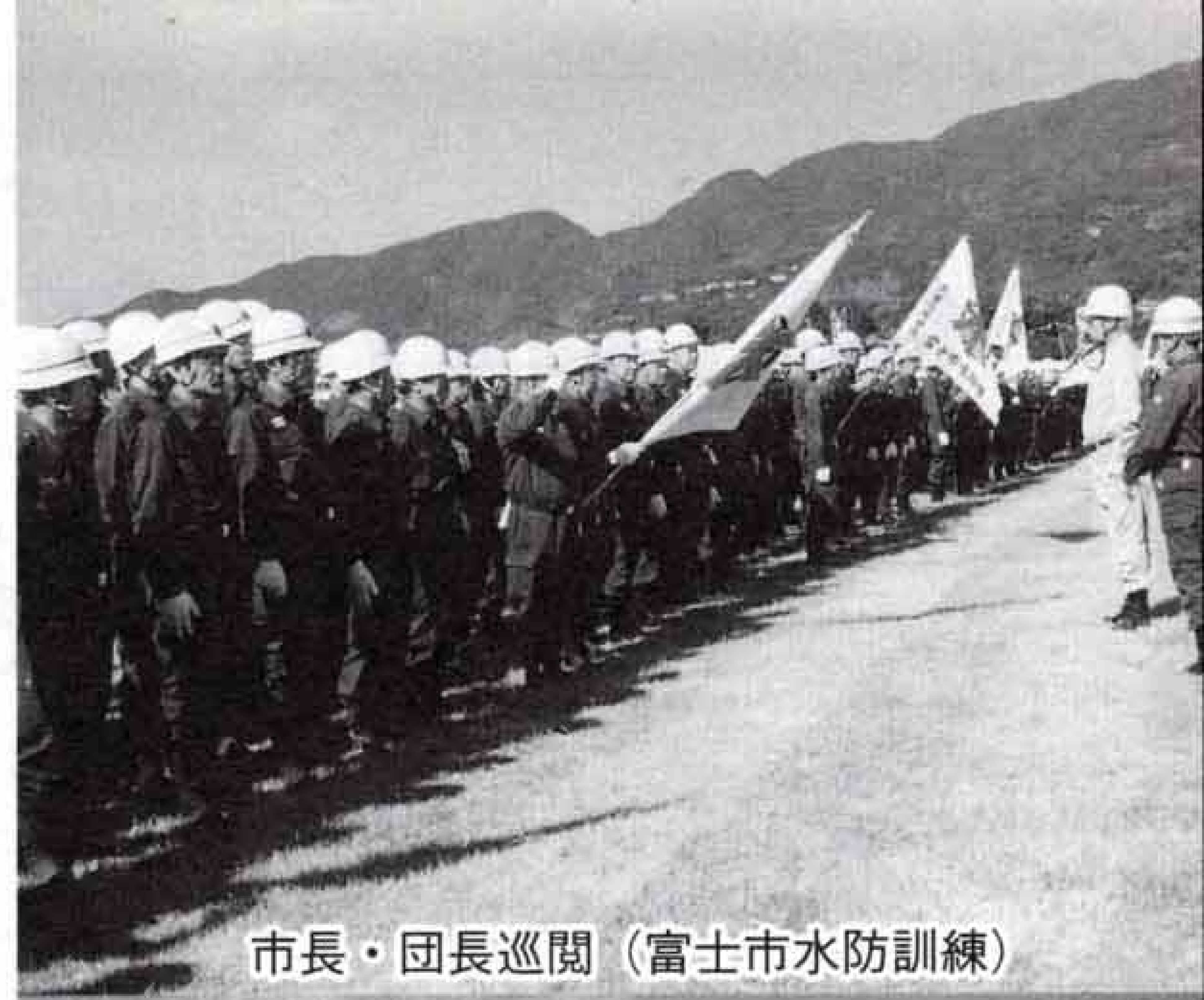
市長・団長巡閲 (富士市水防訓練)