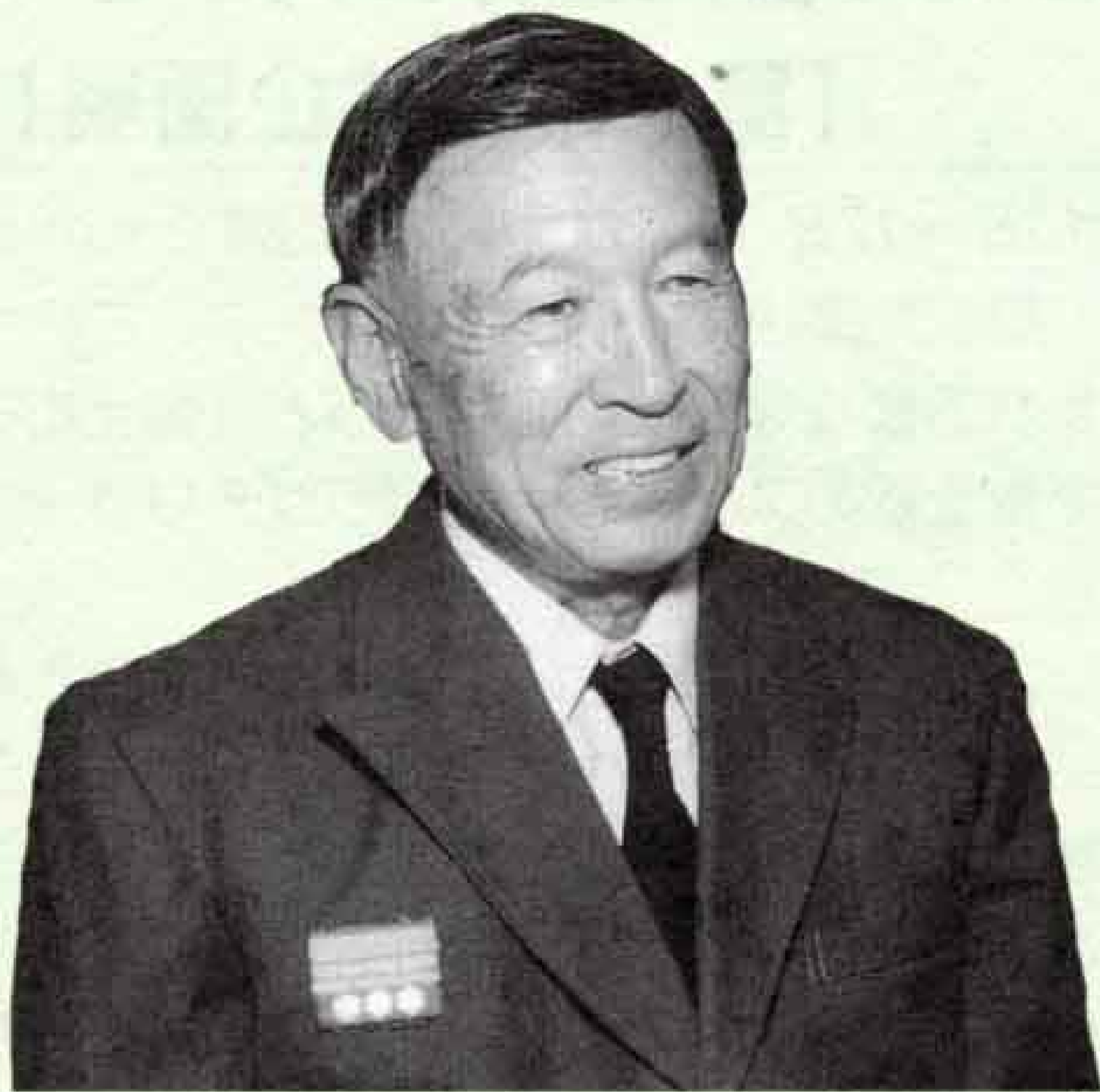
富士市水防団団長

富士市水防団の歴史は古く、明治二十二年には水防組織が発足し、昭和四十九年には富士市水防団の前身となる富士市連合水防団が発足しました。これまで、台風や集中豪雨の際に、水防活動を行ってきました。私自身としては、特に昭和四十九年の七夕豪雨の際に出動して、積み土のうや木流し工法を行ったことを思い出しますね。