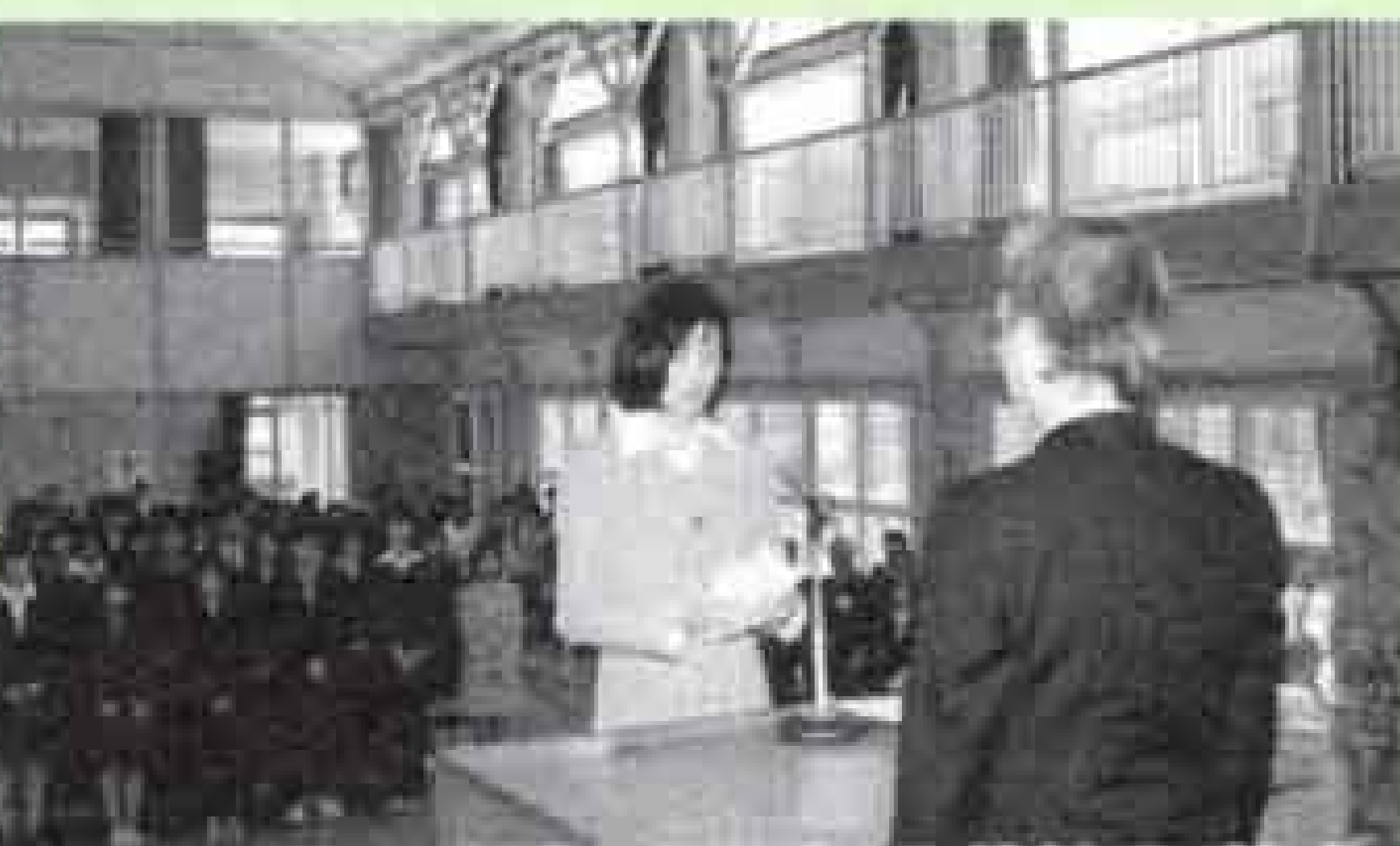
4月7日 市立看護専門学校入学式