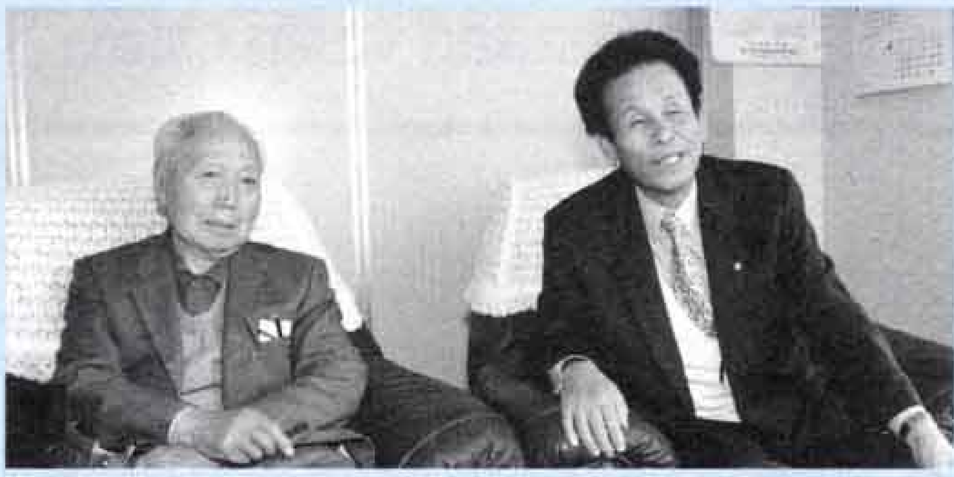
笠井信一翁顕彰会