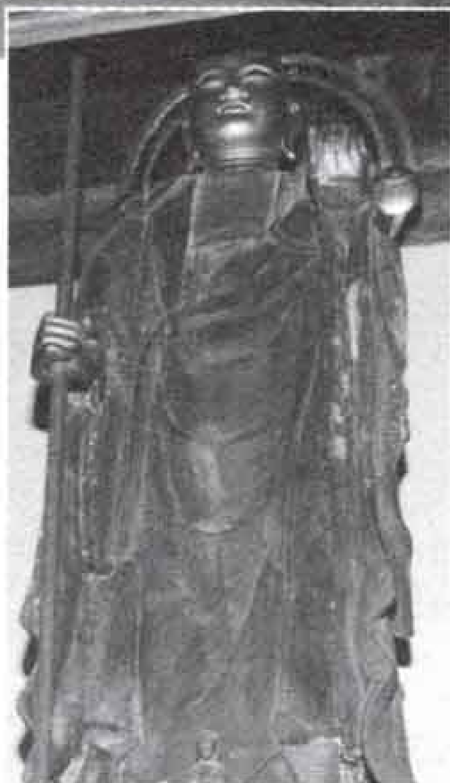
▶身代り地蔵さん 背が高く、りりしい 顔をしています

このお地蔵さんは昔から町の人に親しまれ大切にされています。明治の半ばに吉原で大火事がありました。そのとき町の人がこのお地蔵さんを担いで逃げたという逸話もあるほどですよ。 毎年七月二十三・二十四日にはこのお地蔵さんの縁日があり、盛大に行われ多くの人が訪れます。 また、今でもお地蔵さんのご利益を求めてお参りに来る人をよく見かけます。中には遠くから来る人もいます。お地蔵さんにはいつまでも人々の安全や健康を見守っていただきたいですね。