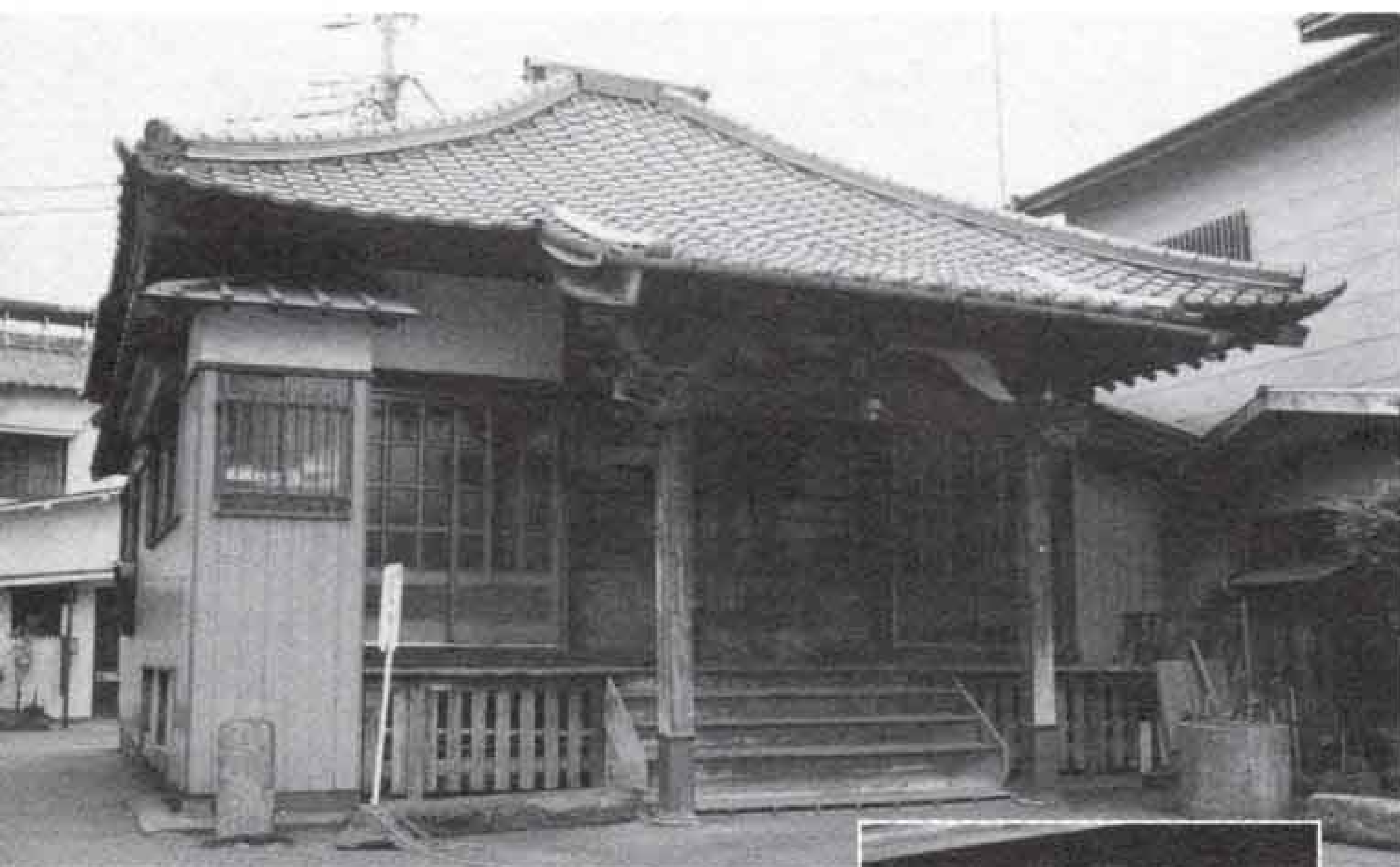
▲身代り地蔵が祭られている陽徳寺の本堂