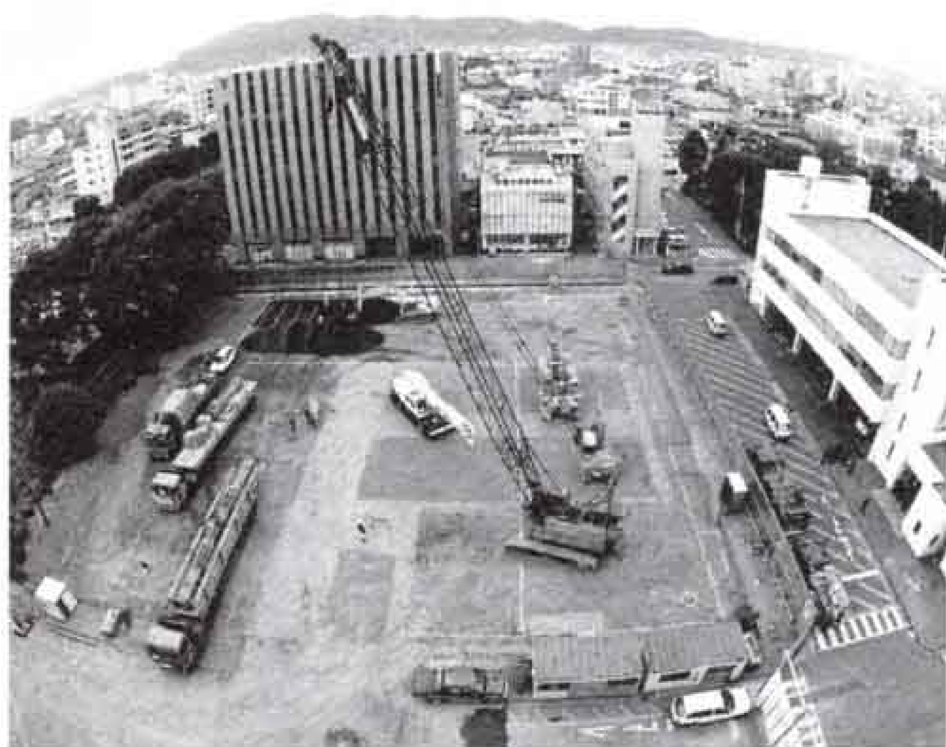
現在、建設工事が進められています。

また、支援情報システムも導入します。それは、通信指令室から現場の指揮車に、毒劇物などの危険物に対する消火方法や対象物の平面図をファックスで送信するというものです。これによって、毒劇物の危険を