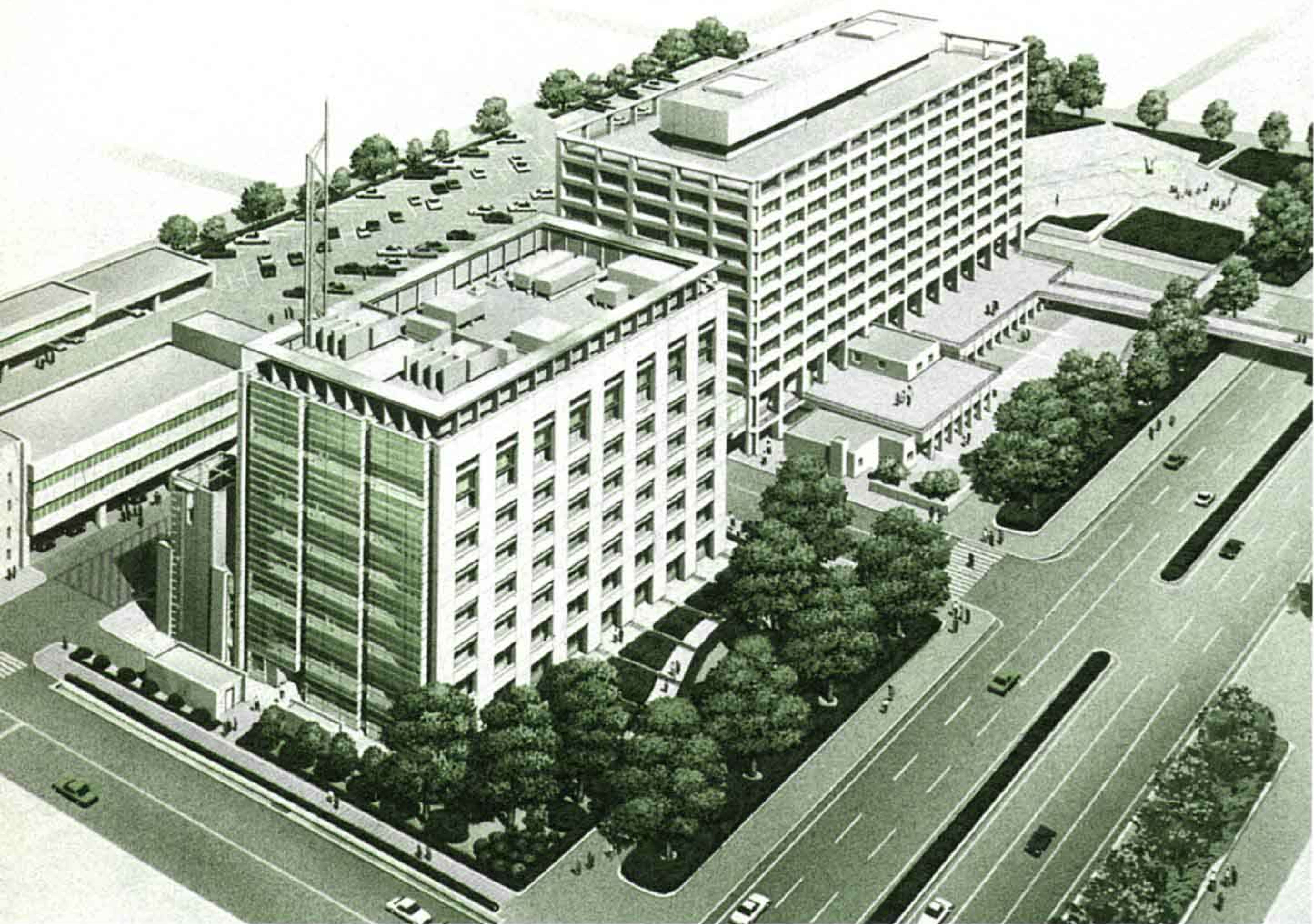
新消防防災庁舎完成予想図（手前）

発信地表示システムの導入で、通報を受けてから三秒後に通報者の場所や電話番号がコンピュータの画面上に表示されます。通報電話が発信装置となり、地図検索装置で自動的に災害の発生場所付近の地図が表示されるというシステムです。