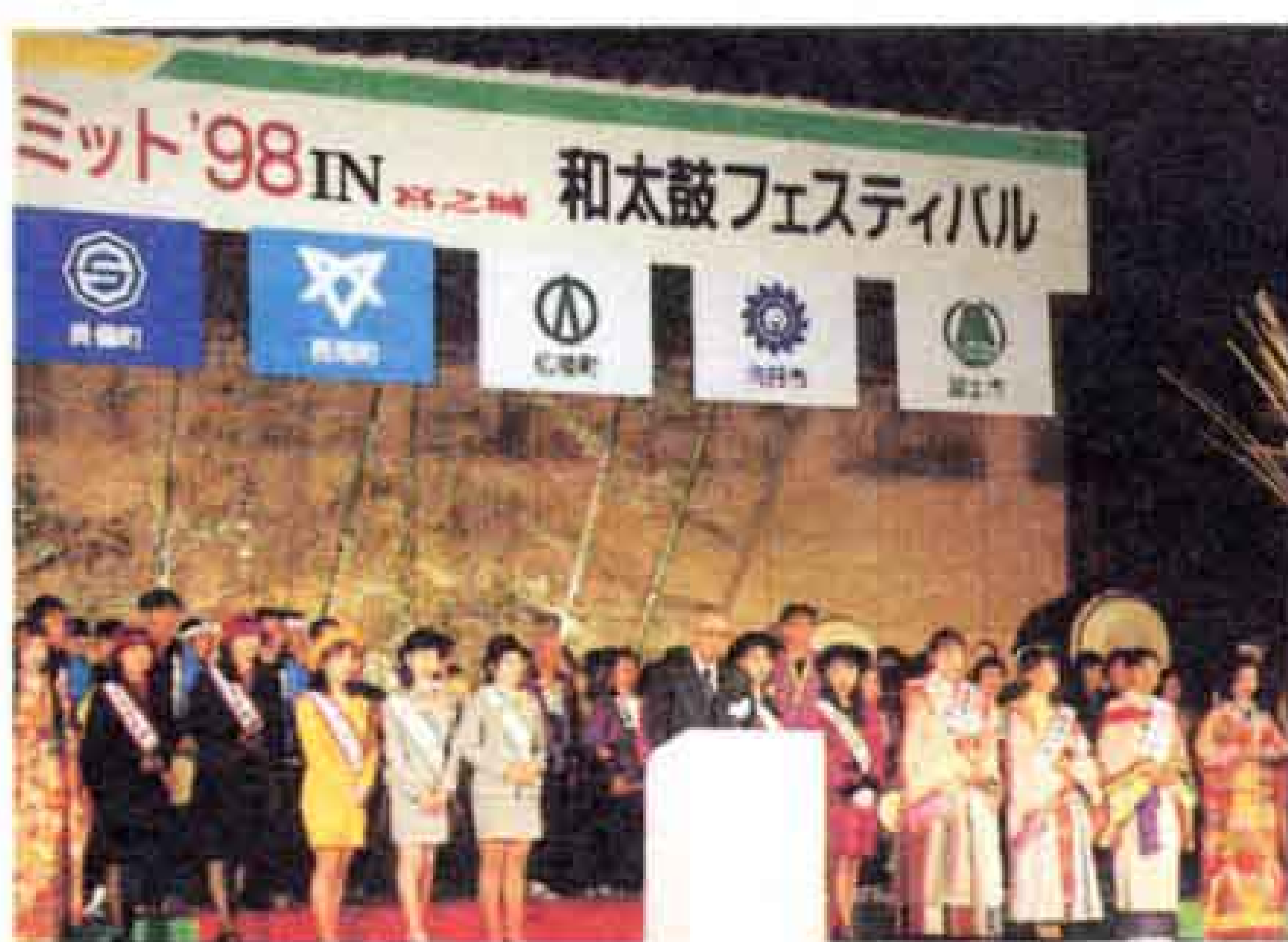
▲昨年、鹿児島県宮之城町で開かれた「かぐや姫サミット」の様

また、参加自治体から集まった和太鼓団体による「和太鼓フェスティバル」がサミットにあわせて開かれ、サミットを盛り上げます。