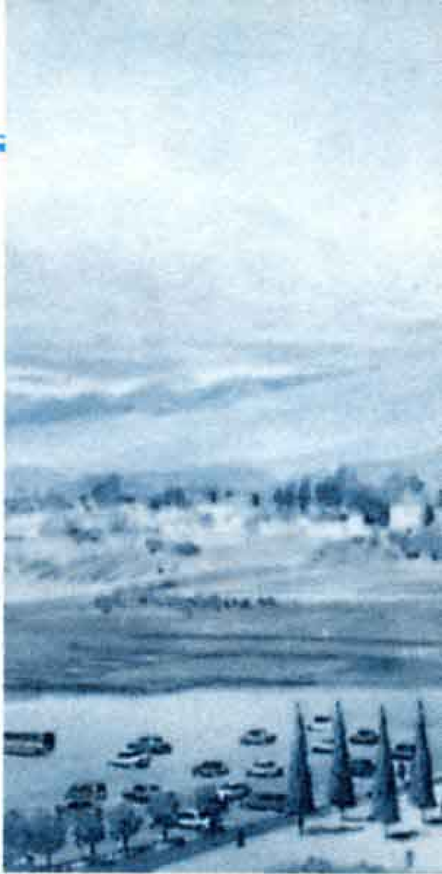
▶(仮称)総合水泳場完成イメージ図