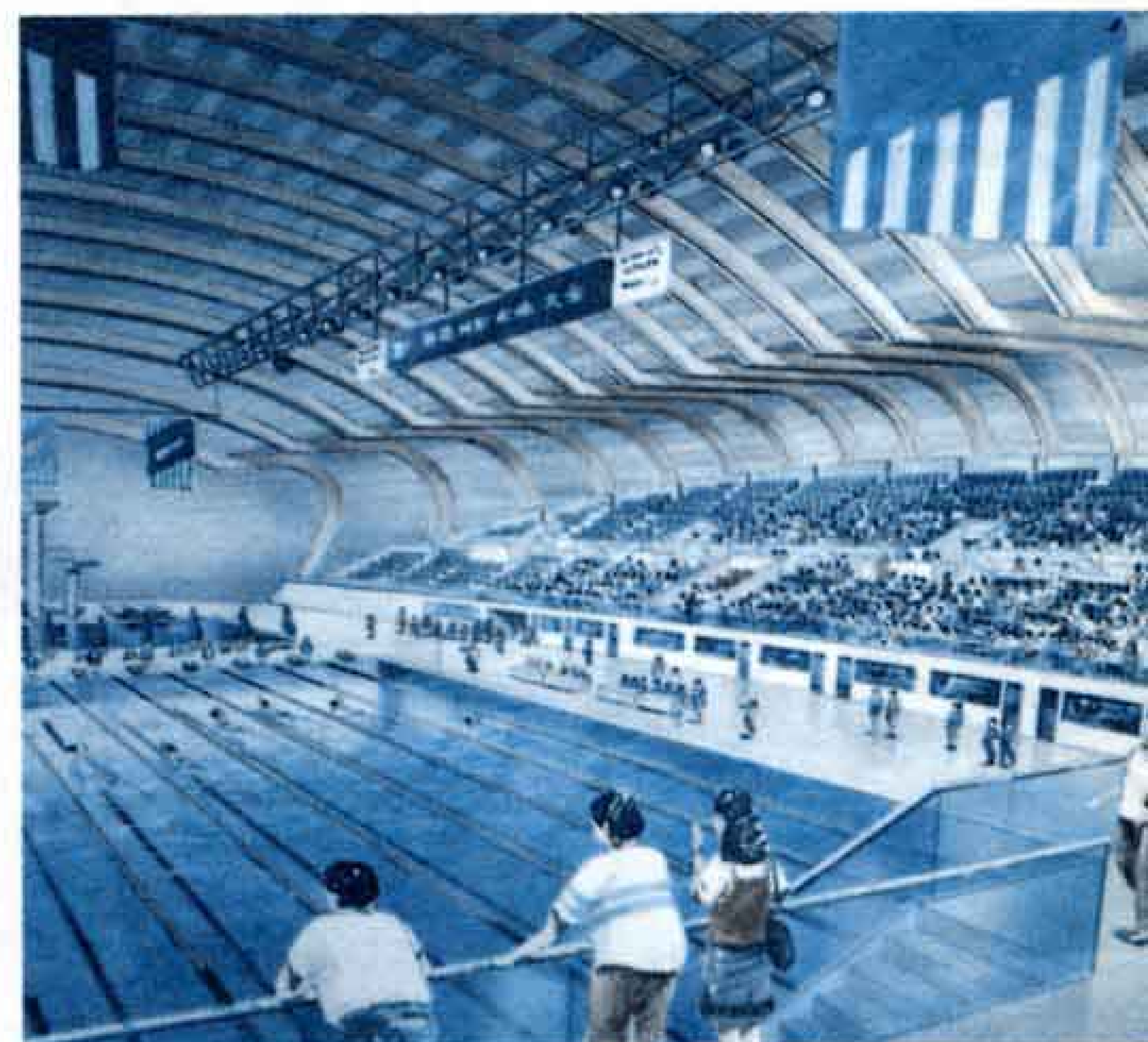
▲(仮称)総合水泳場内部イメージ図 競泳用プール、飛込用プール、 観客席は3,000人収容。(固定席2,000 人、仮設席1,000人)