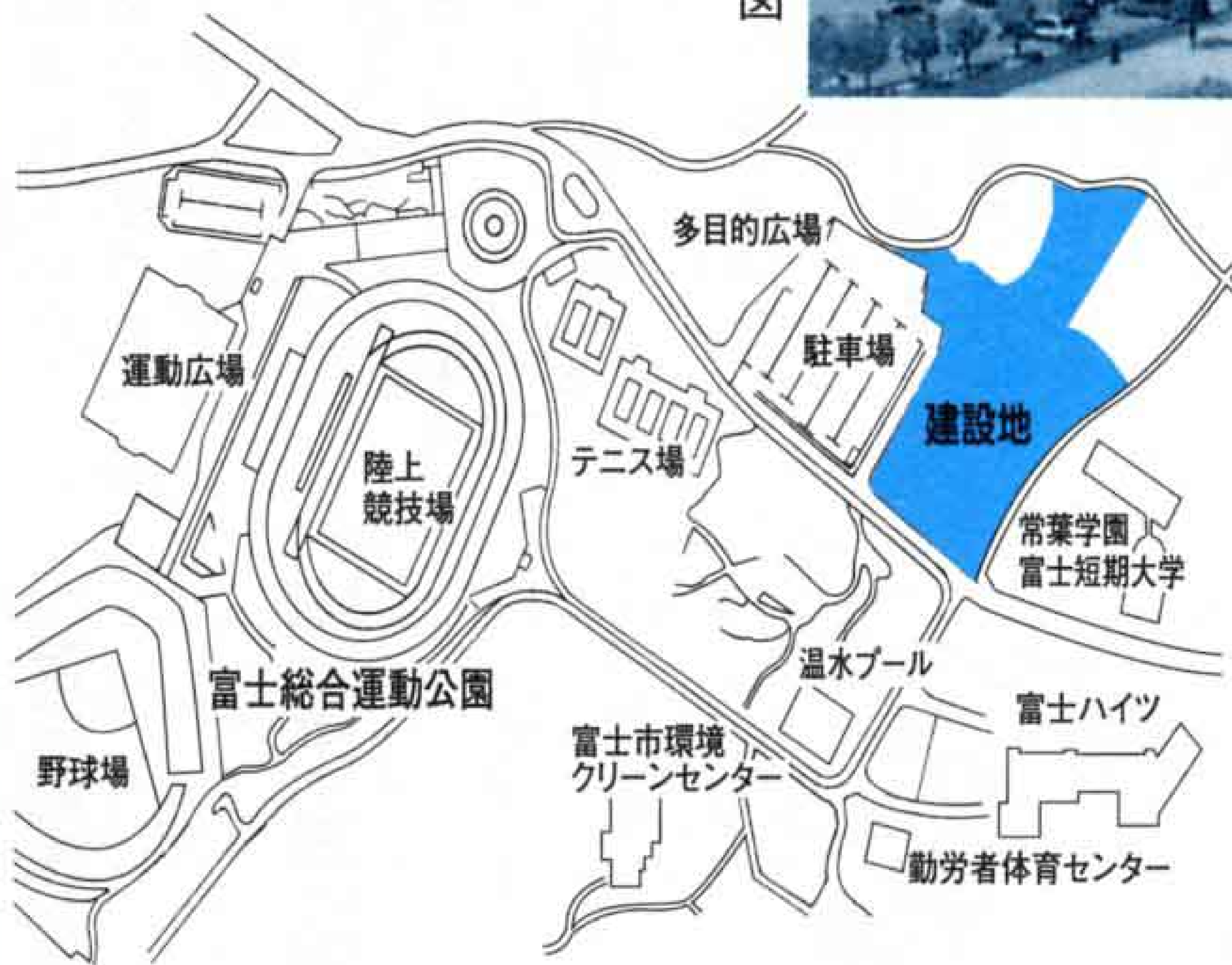
▲(仮称)総合水泳場付近図