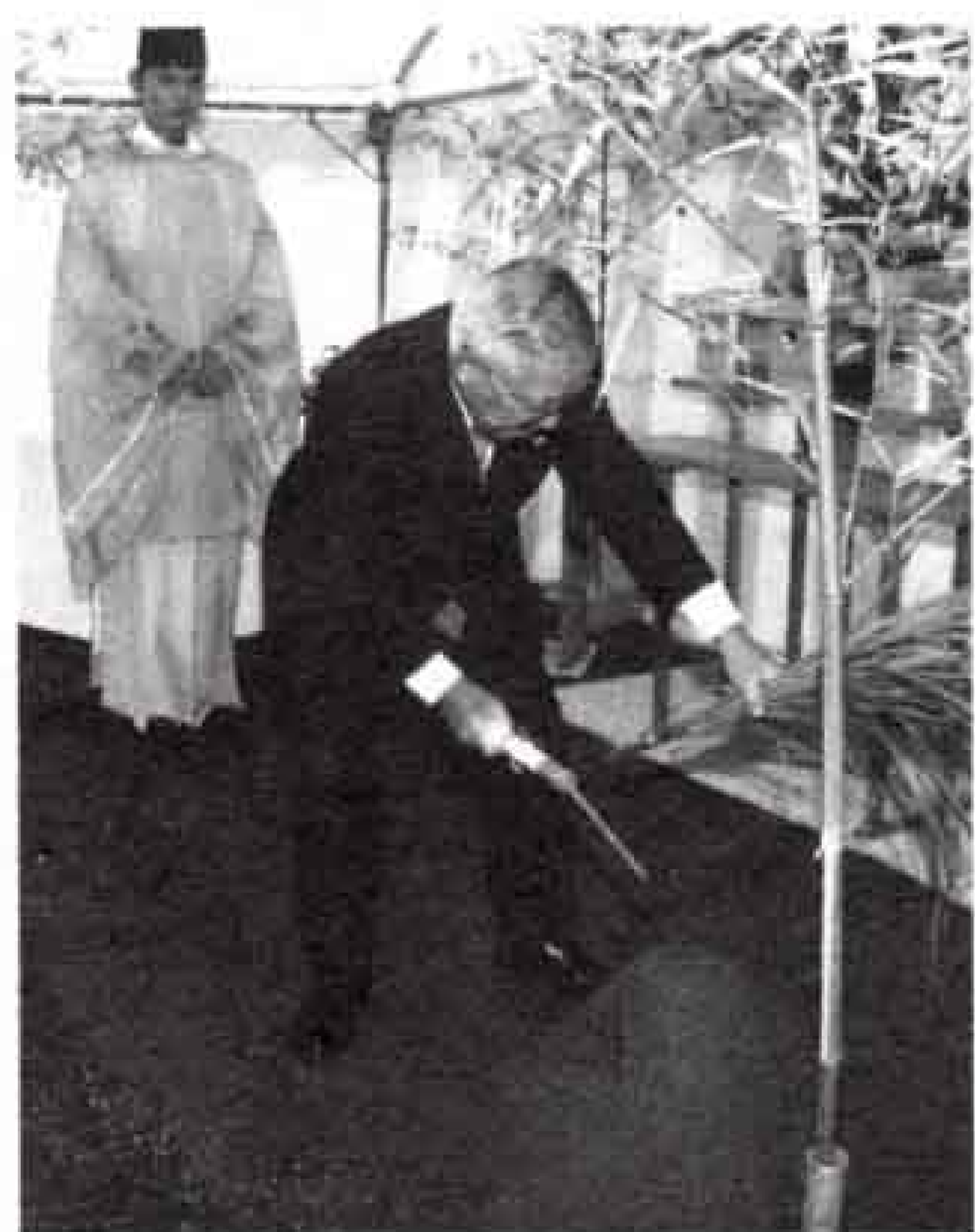
▲森林墓園工事の安全祈願祭