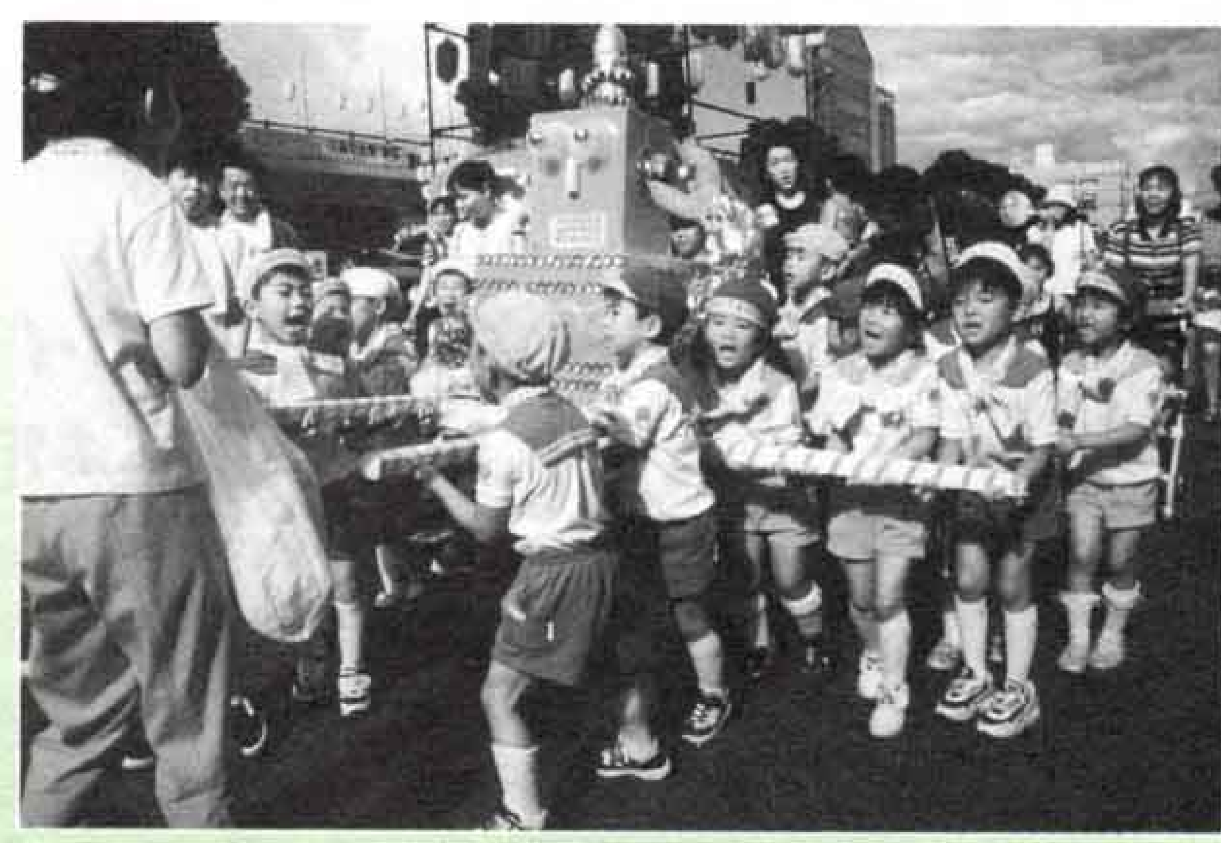
▶わっしょい、わっしょい！ こどもみこしパレード、 初登場で沿道から大声援