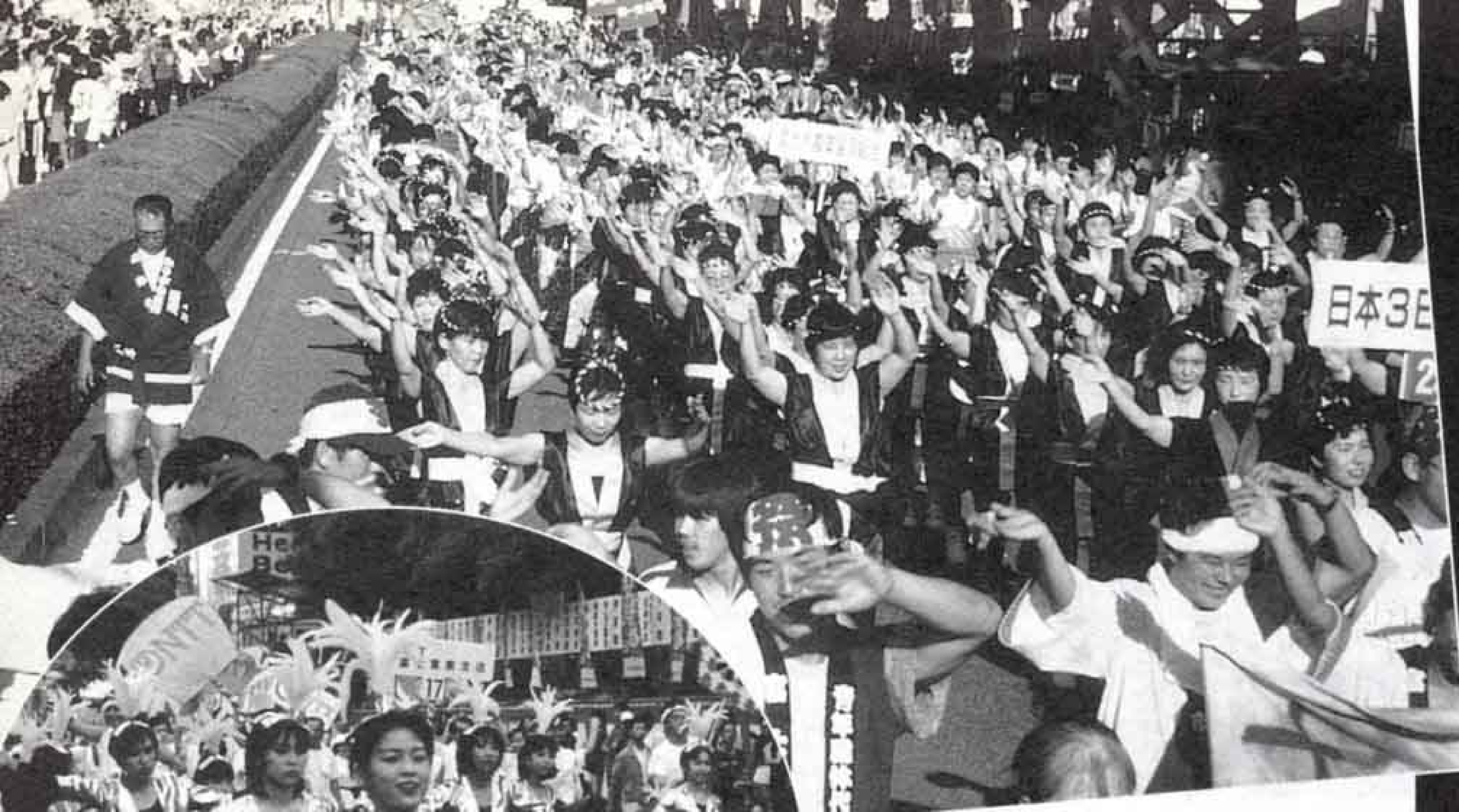
▲◀4,000人が熱狂した 市民総踊り