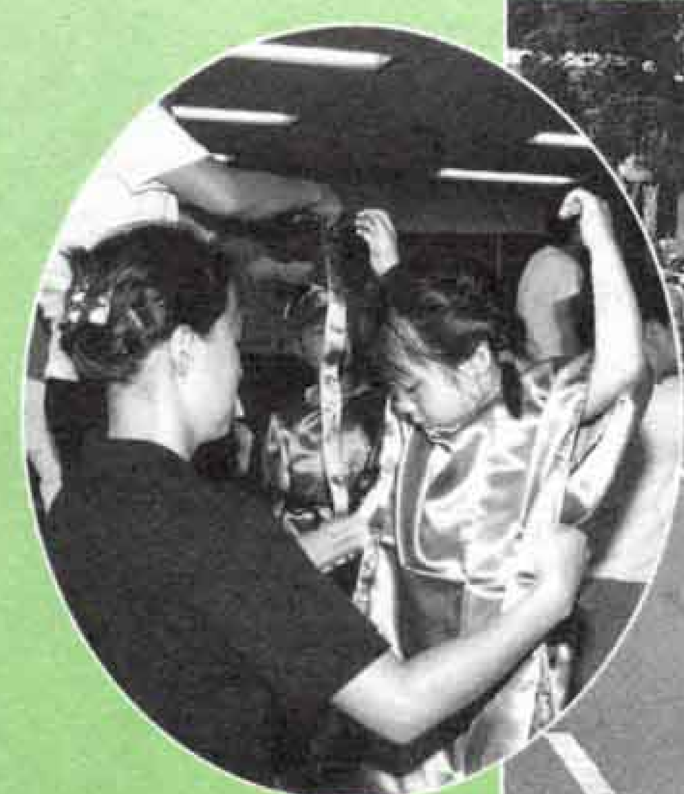
▲わたしもかぐや 姫絵巻の準備中