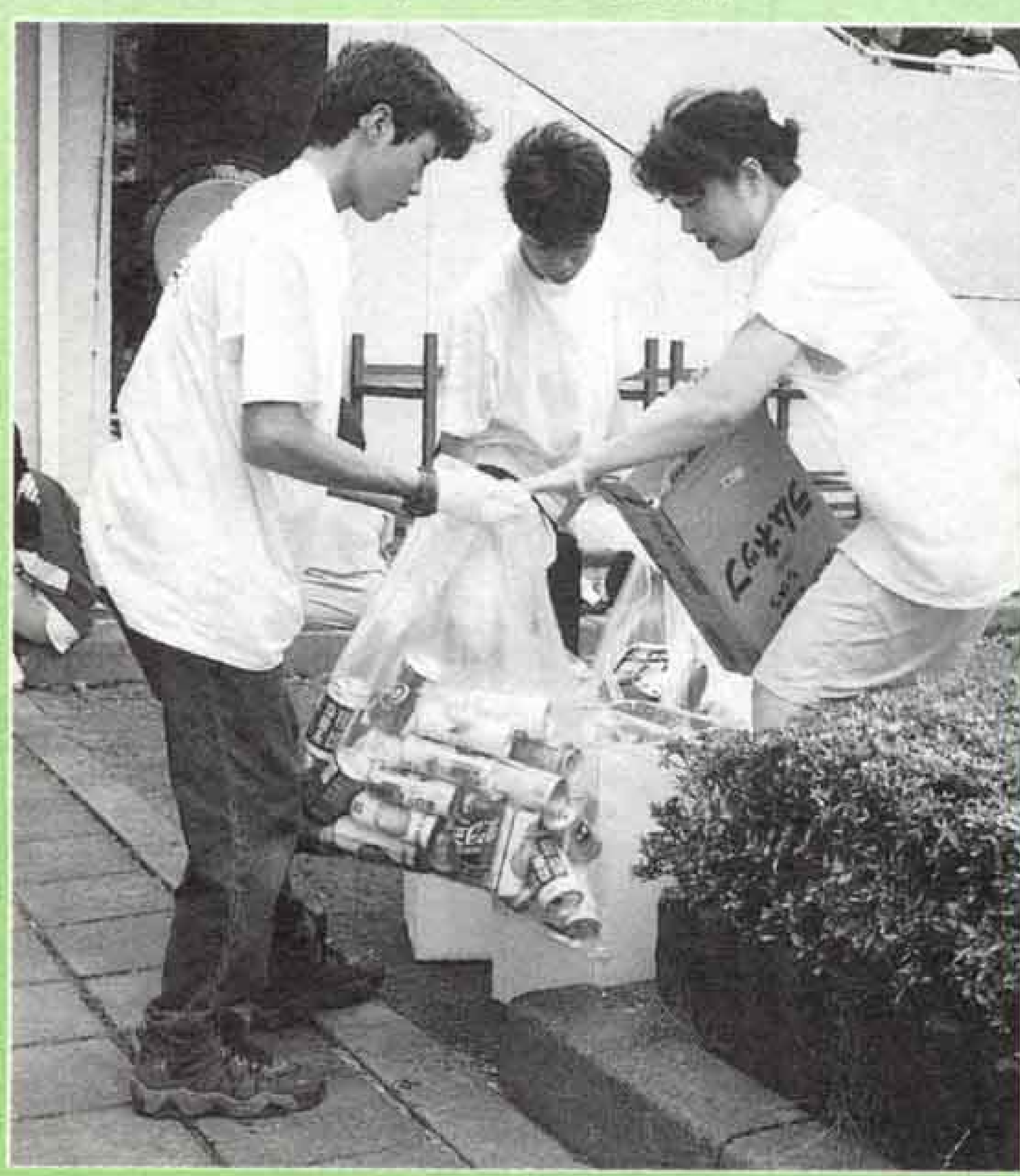
▼ ゼロ ごみ0の祭りを目指し、初出動のゴミバス ターズ2。中・高校生など約300人もの市 民がボランティアとして参加