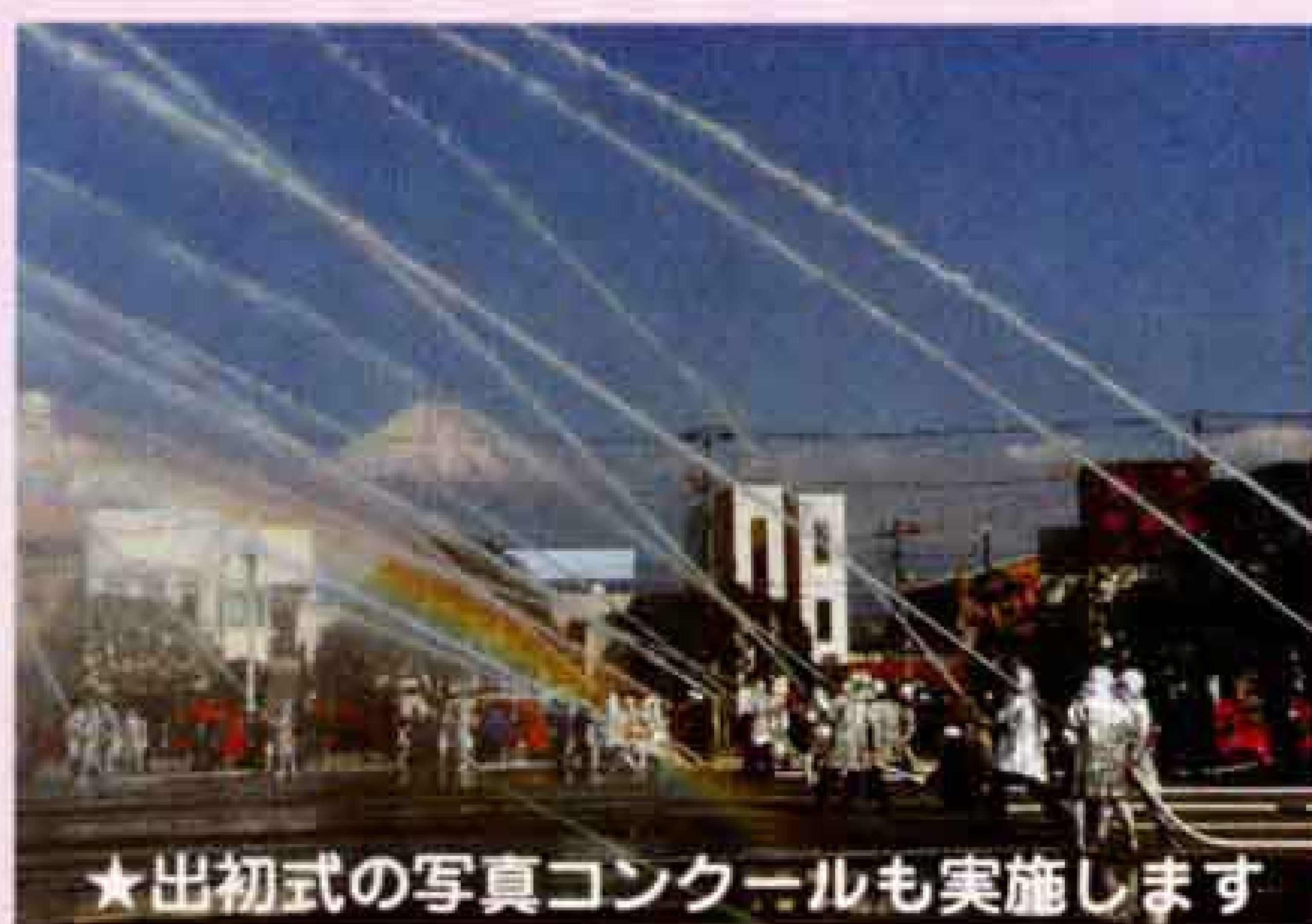
★出初式の写真コンクールも実施します