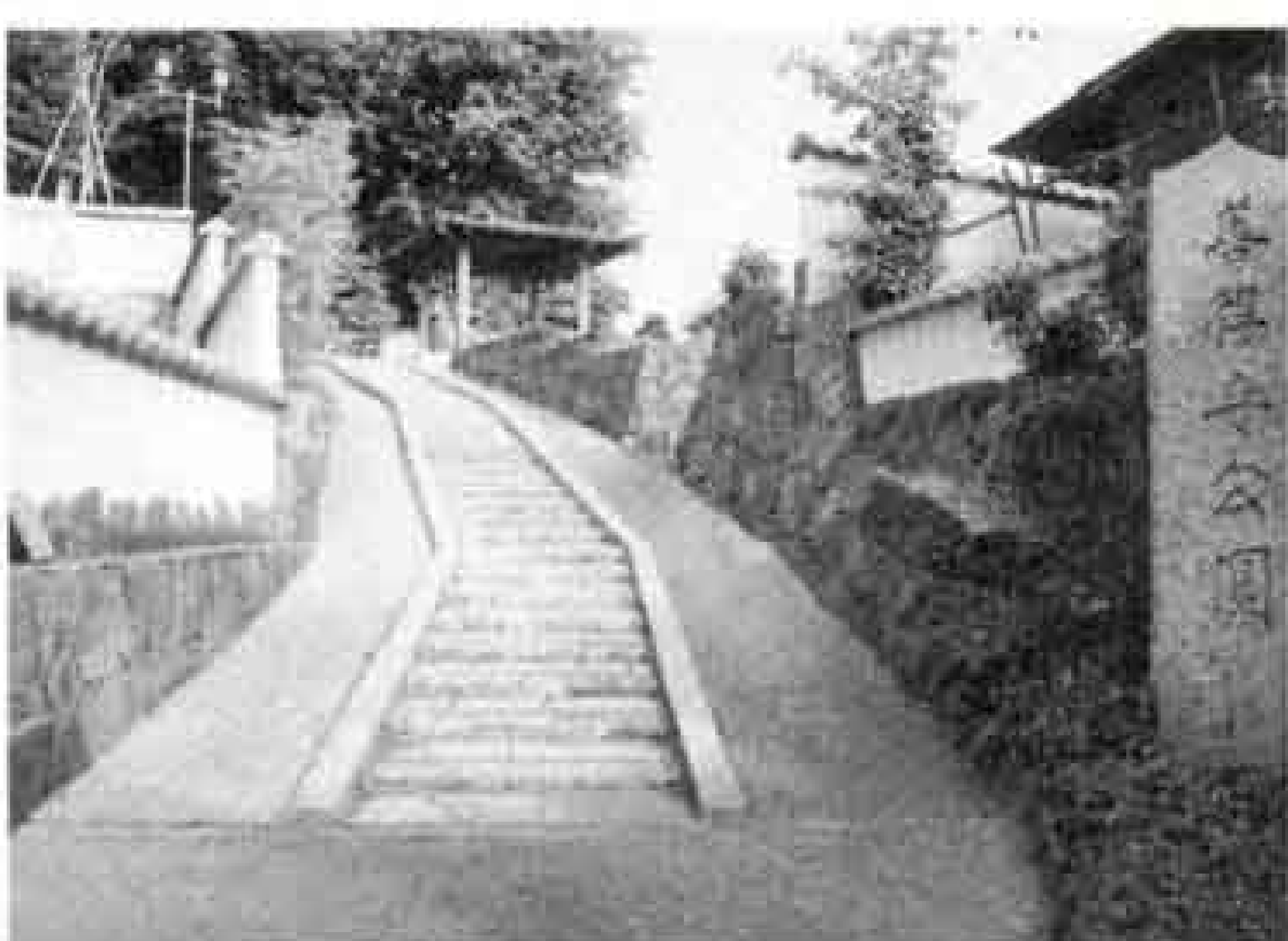
戦国時代の史跡が残る 善得寺公園

災害時の避難路や快適で安全な生活の確保を目的とした公園です。身延線廃線敷を利用した富士緑道が代表的な緑道です。