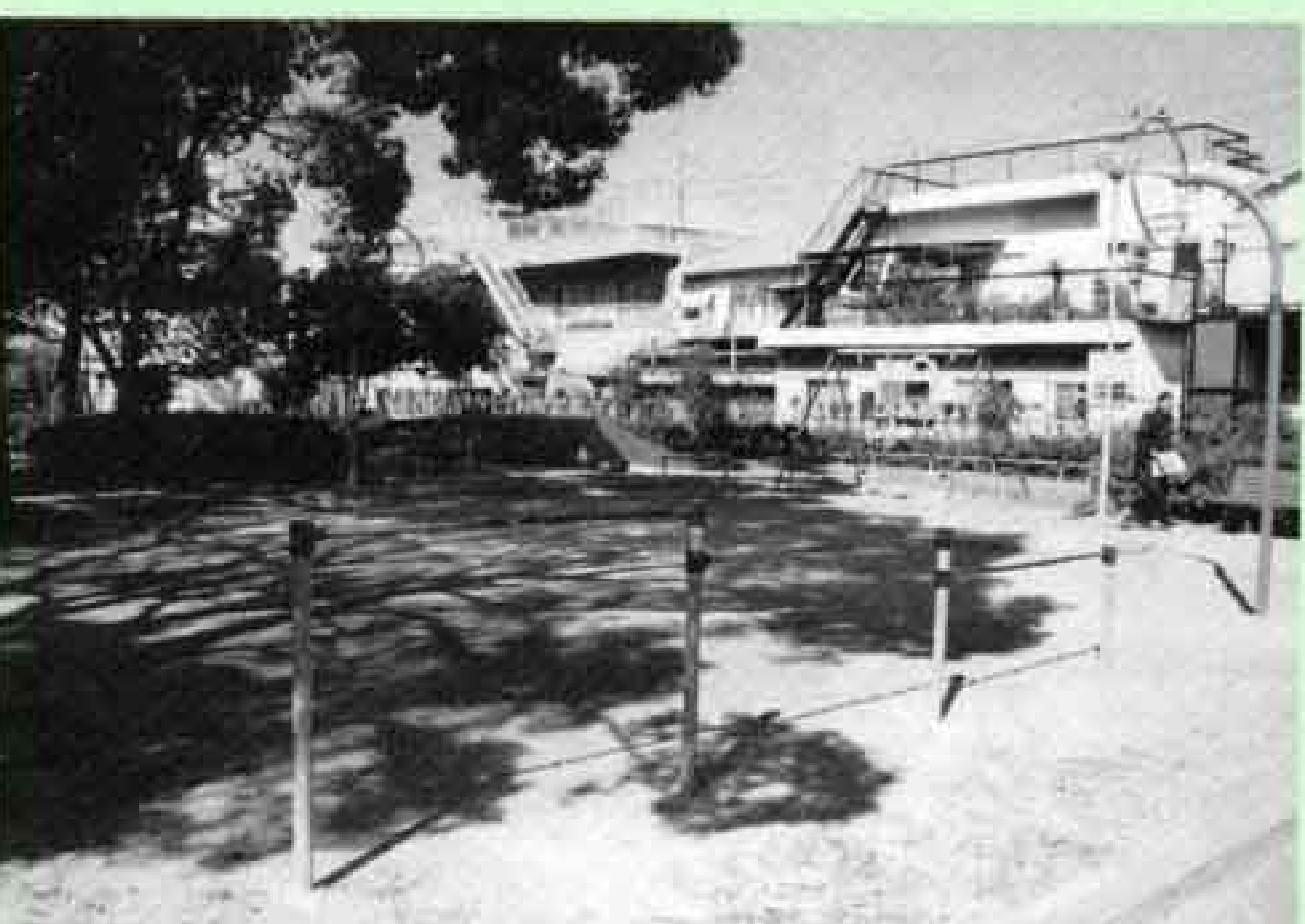
富士駅南第2公園（上横割）