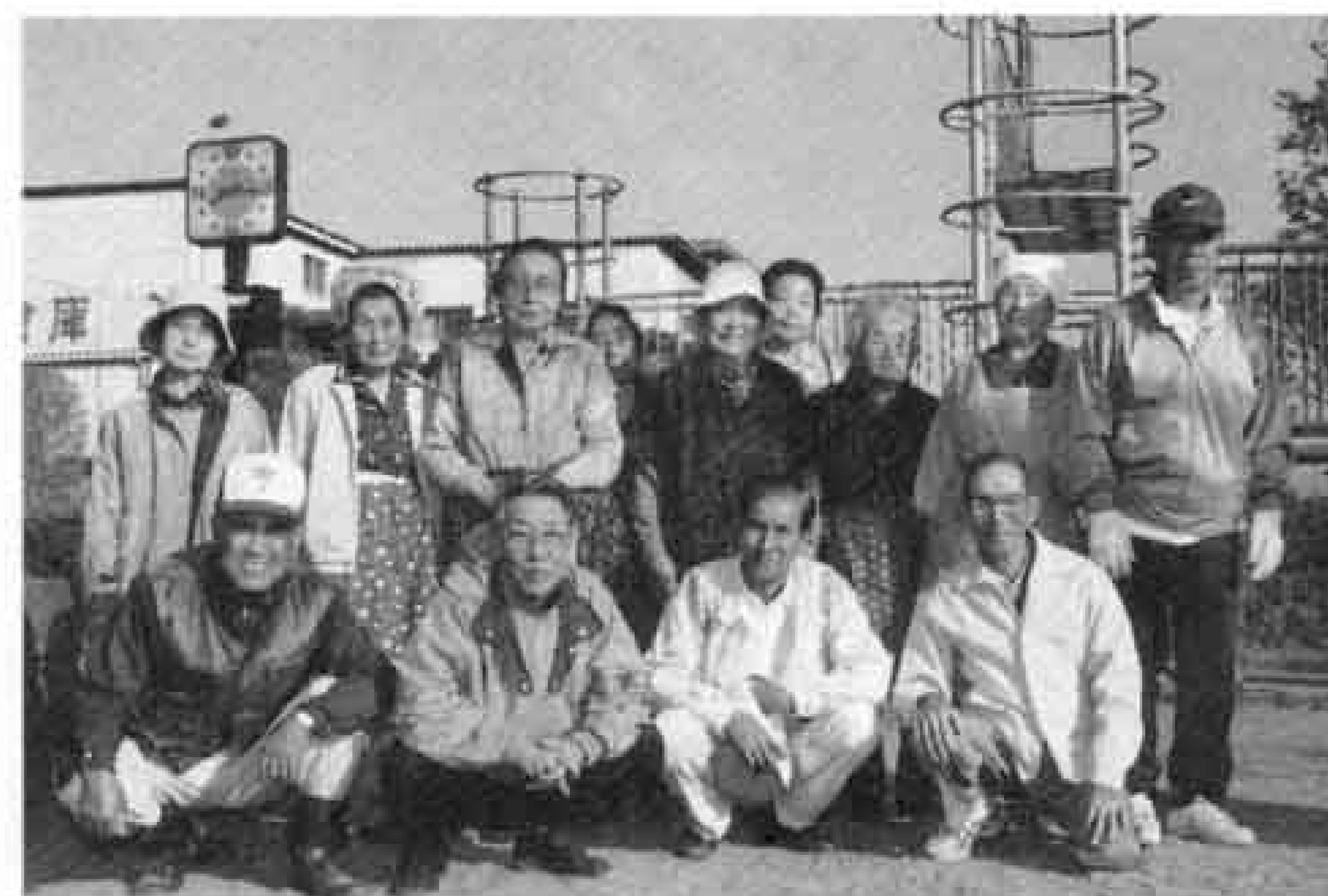
中島下老人クラブ笑話会の皆さん

公園は地域の環境づくりや御近所とのふれ合いにはとても大切なものなんです。この公園は、毎日親子連れが遊びに来たり、近所の人々が散歩したりとにぎやかで、いろいろな出会いや情報交換をそれぞれやっているようです。昔ほどではなくなりましたが、中には、公園の遊具を壊したり、テーブルで火を使って焦がしたりする人がいるんです。公園はなくてはならないみんなの大切な財産なので思いやりを持って大事に使ってほしいですね。