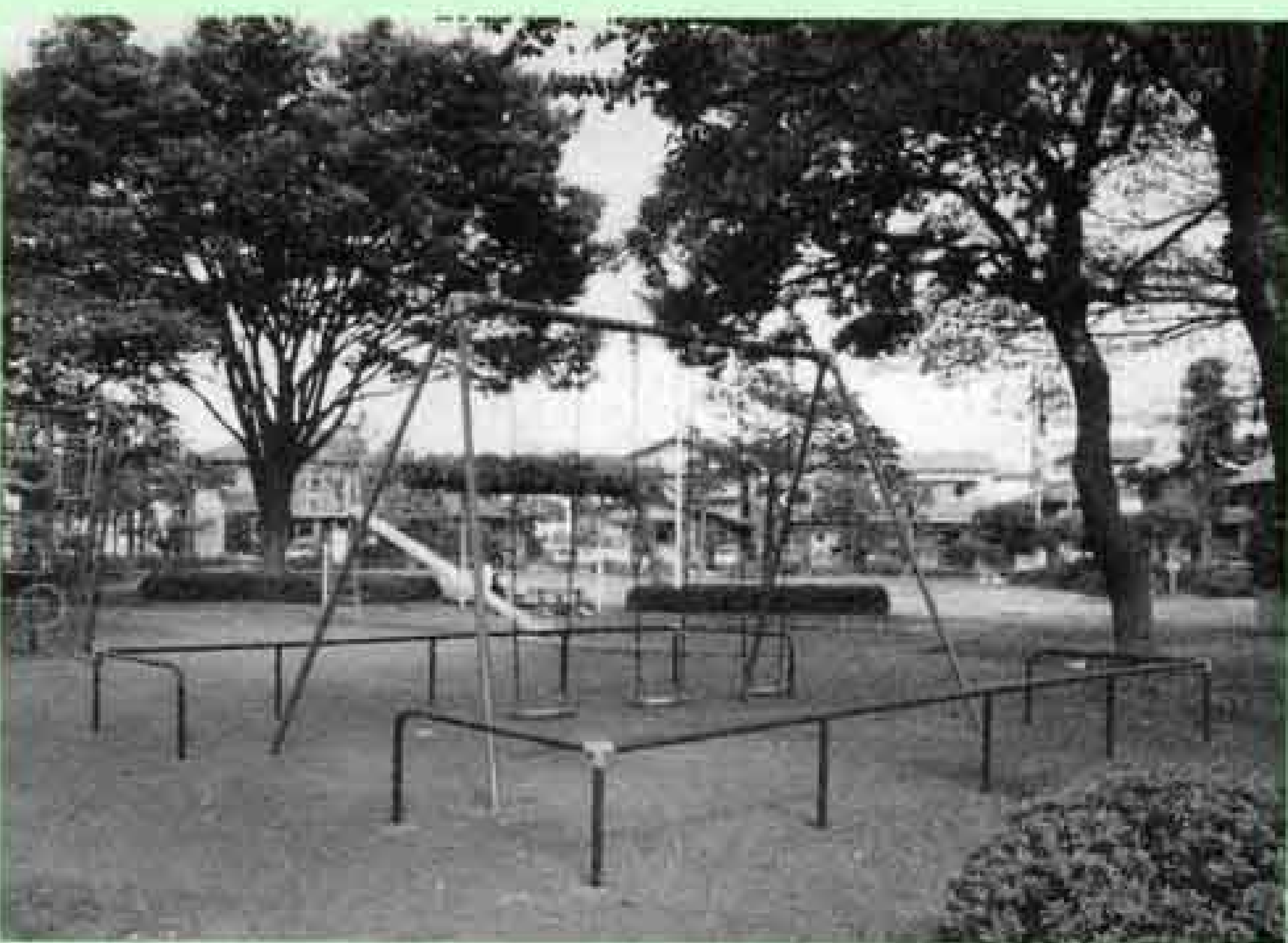
青島第2公園（青島町）