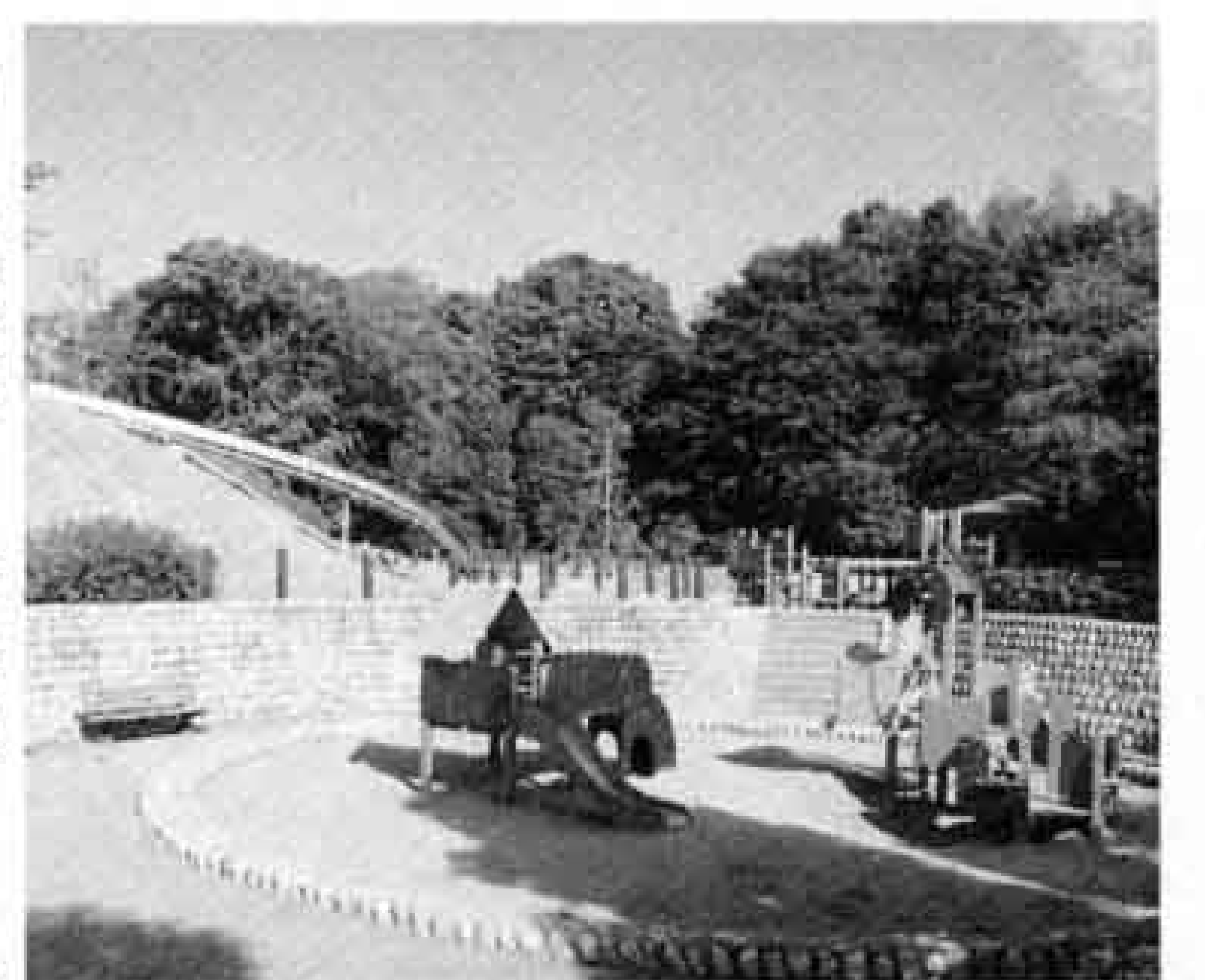
一部開園した原田公園

気軽にいつでも利用できる身近な公園として、各地域に点在しています。遊具などが置いて