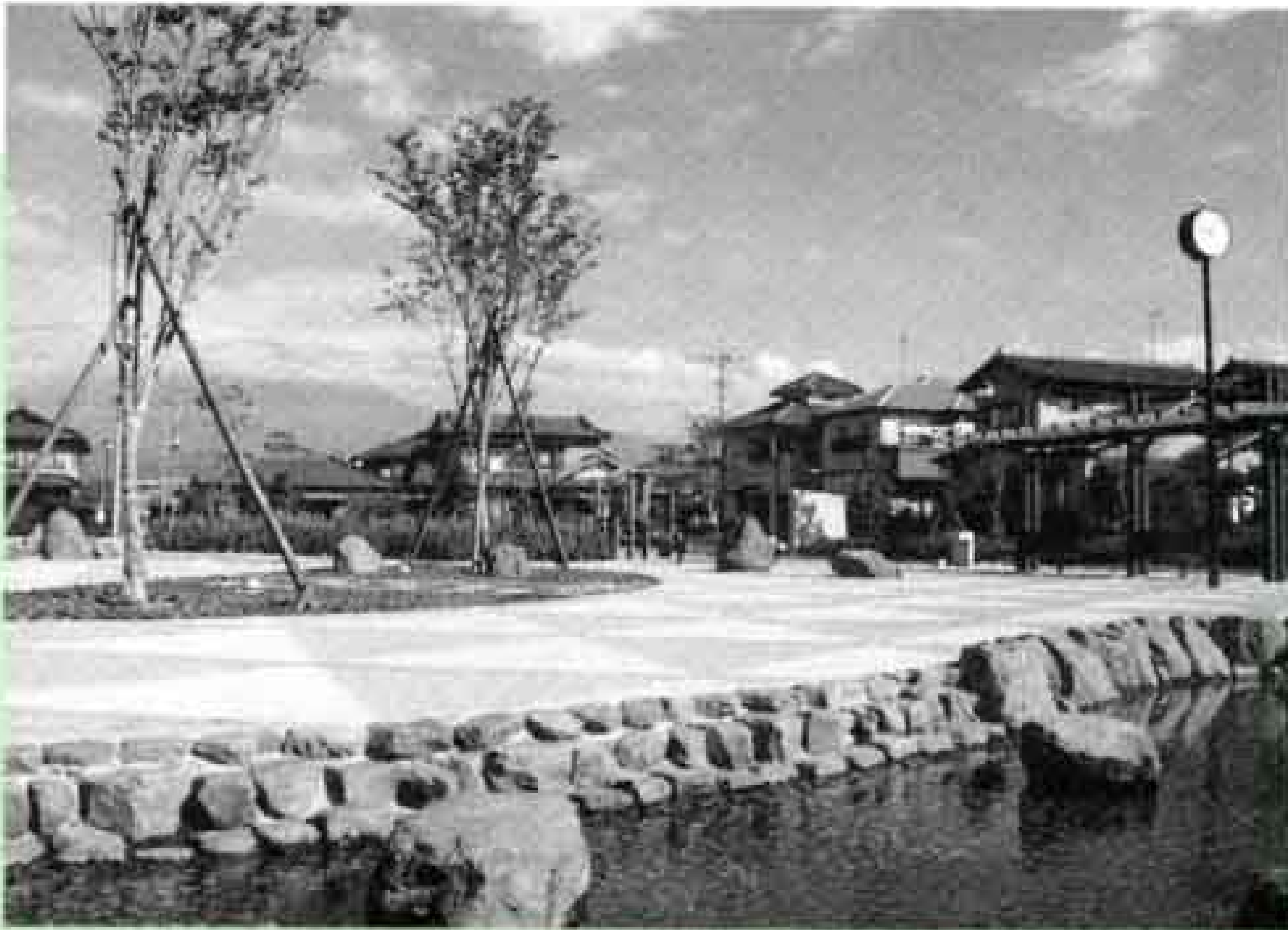
中部1号公園（五味島）